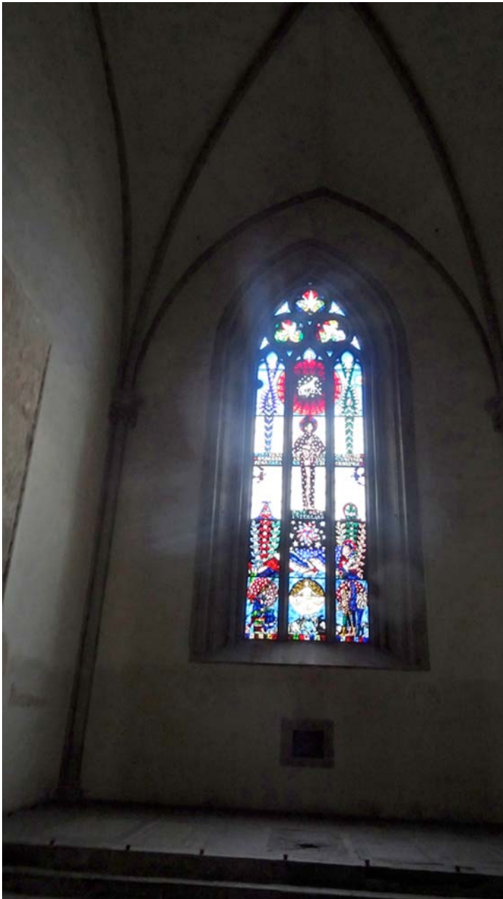
Die Fenster an den Frontseiten des Schiffs gehören zu den ältesten der Schweiz