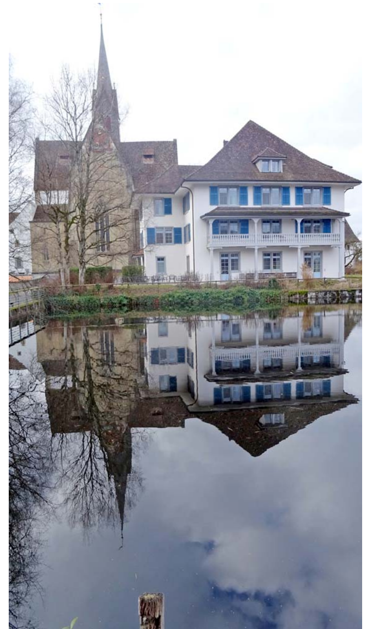
Schöner Blick zurück bei unserem Weiterzug nach Hausen am Albis: Architektur-Generationen spiegeln sich im ehemaligen Feuerwehr-Weiher