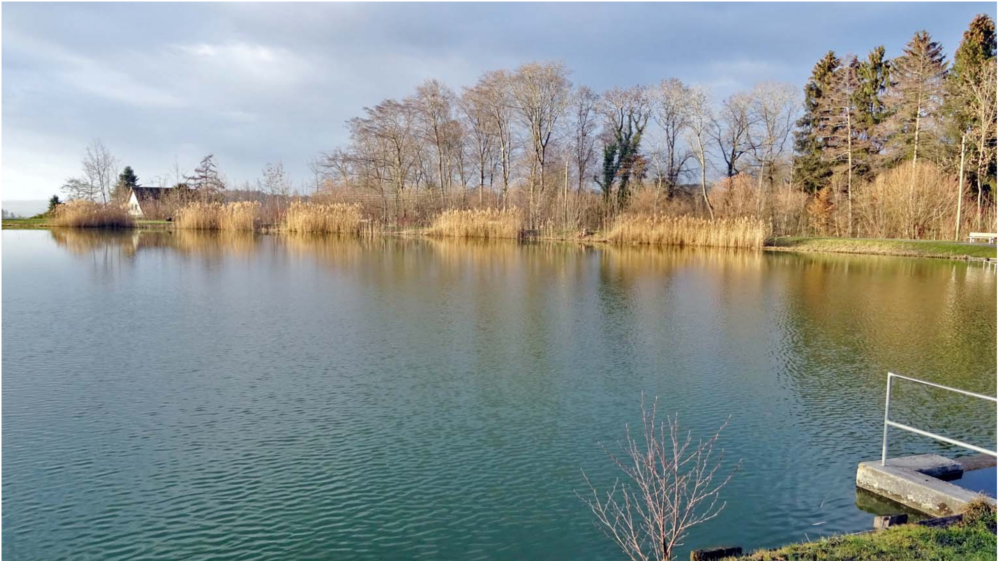
Herbst-Stimmung im Winter am Hedinger Bade-Weiher.

Würdiges Ende des ersten Wanderfreaks-Events im neuen Jahr: