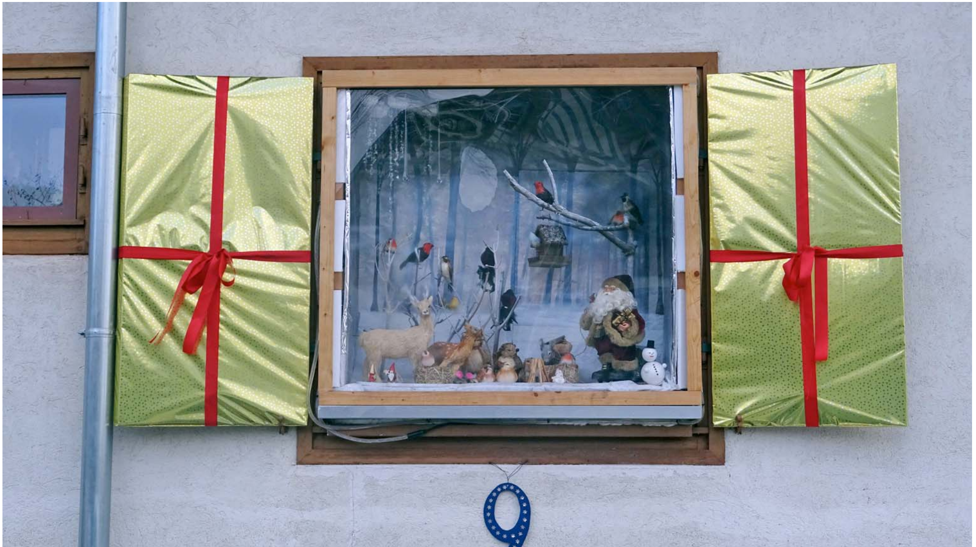
Die „Einrahmung“ links und rechts sind nichts anderes als verpackte Fensterläden