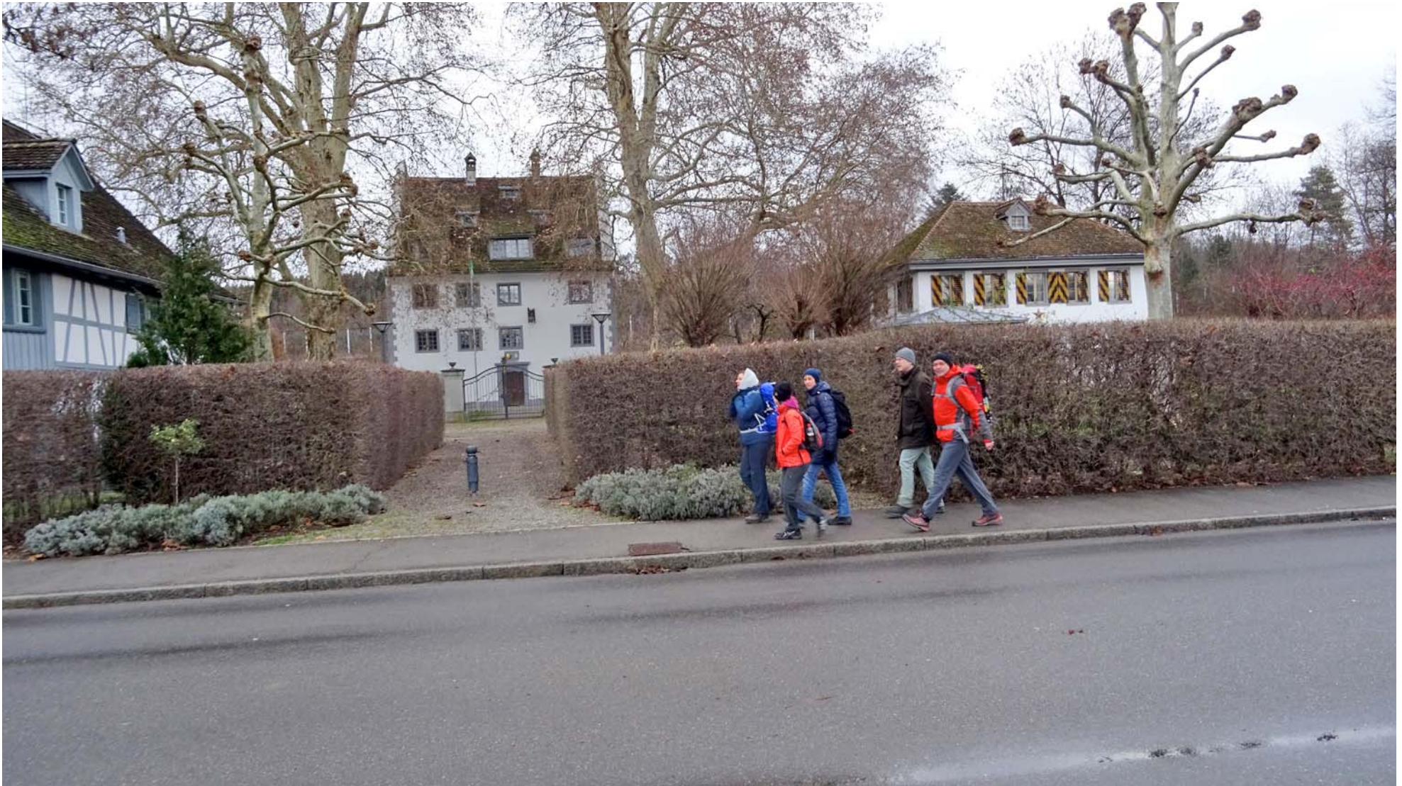
Promenade vor dem Geschts-trächtigen Schloss

Um 10:30 Uhr starten wir beim Bahnhof Knonau: