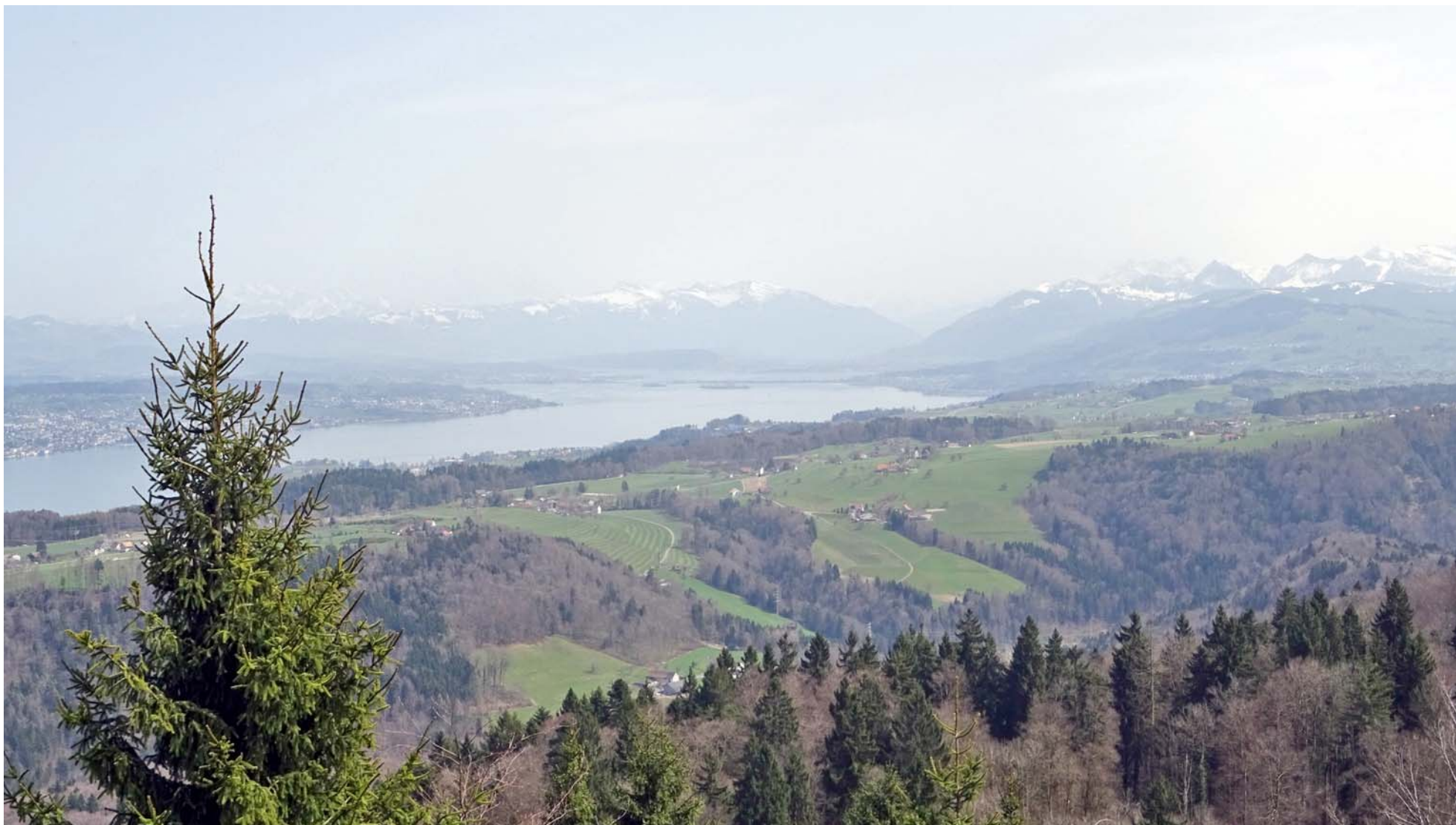
Der obere Zürichsee mit Seedamm, rechts die Glarner Alpen

Oben auf dem Albishorn bietet uns trotz eingeschränkter Weitsicht tolle Ausblicke: