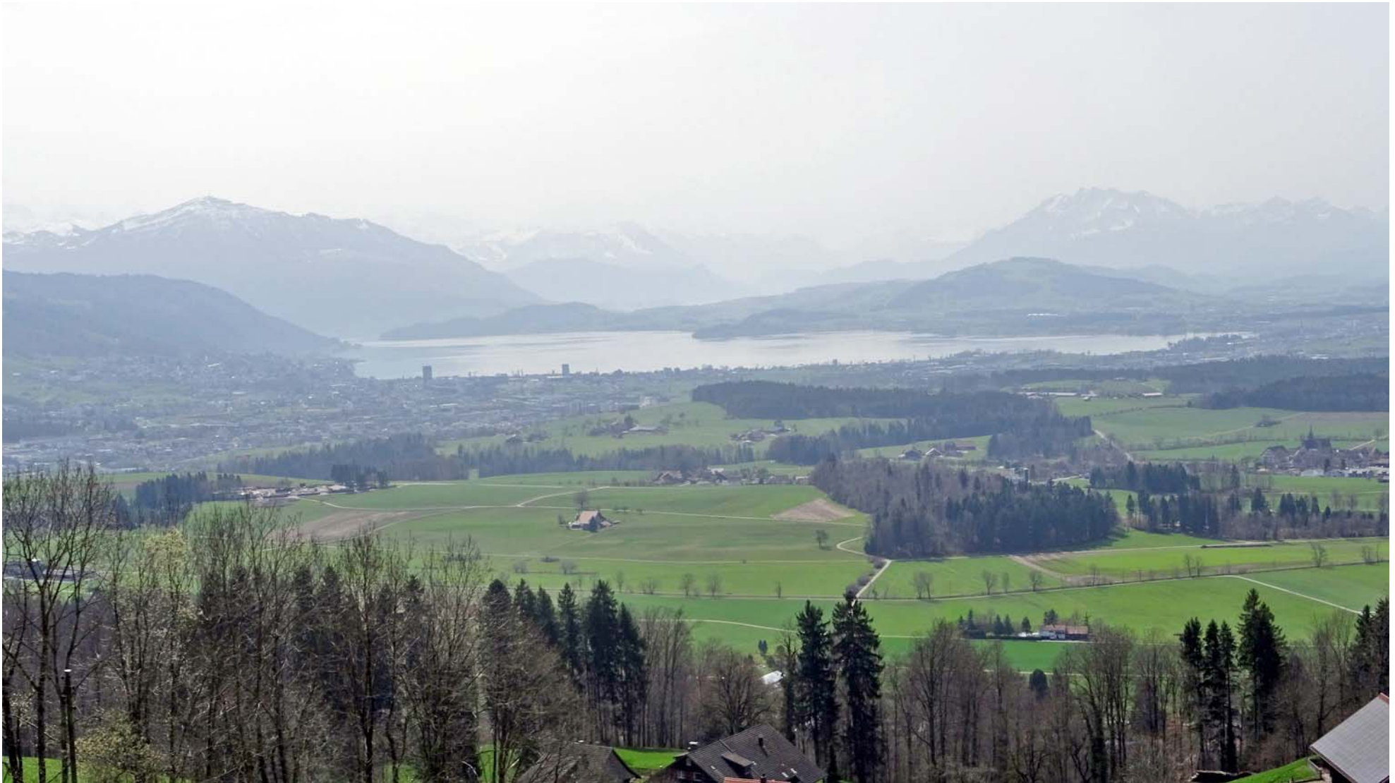
Blick auf den Zugersee, links die Rigi und rechts der Pilatus

Diese in-direkte Route haben wir gewählt, weil uns diese Aussicht auf dem „normalen Waldweg“ vorenthalten gewesen wäre: