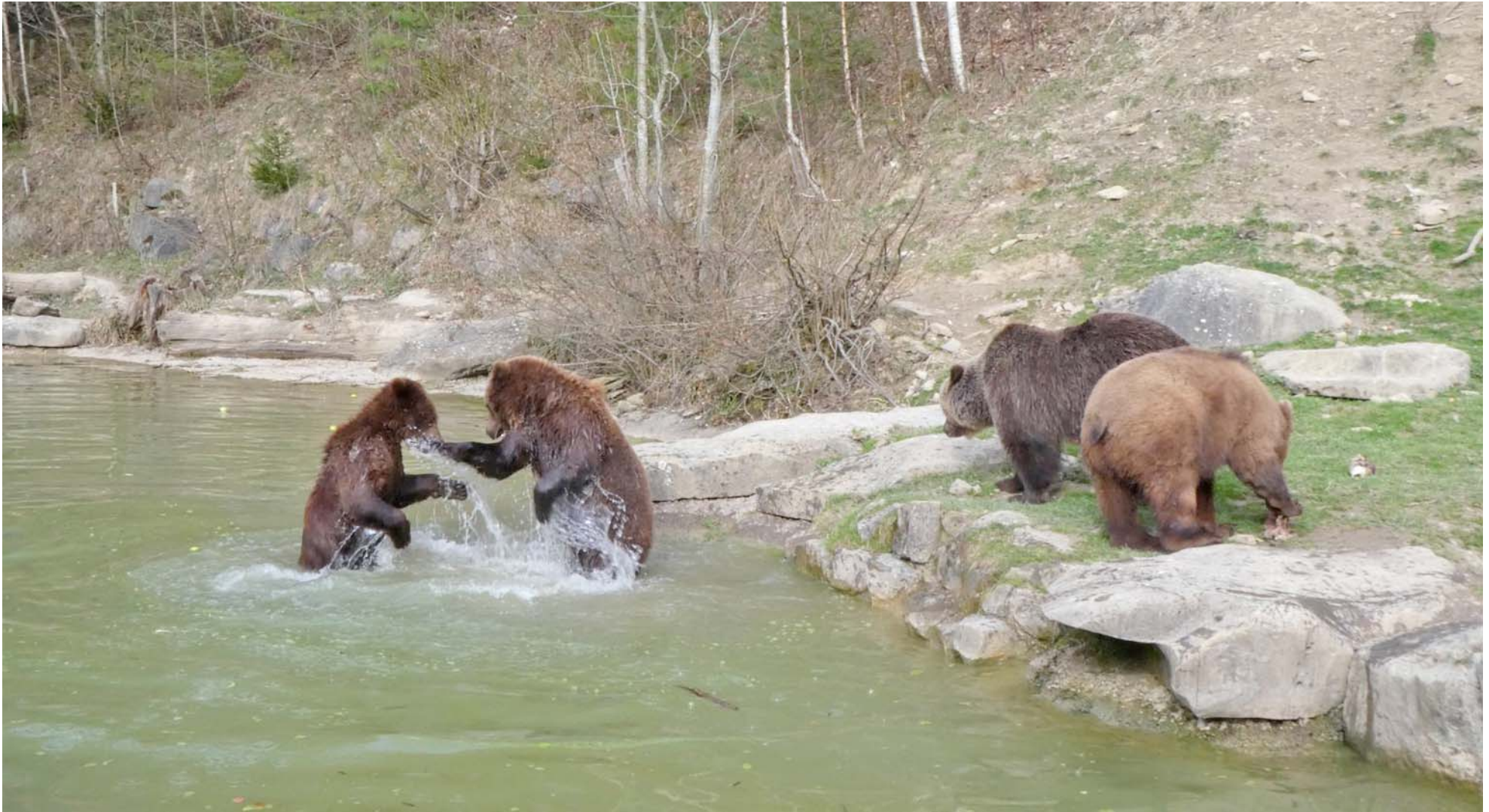
Die abschliessende Bären-Show entschädigte uns für das lange Warten

Im Wildpark Langenberg scheinen sich erst sämtliche Tiere an Schattenstellen verschlauft zu haben: