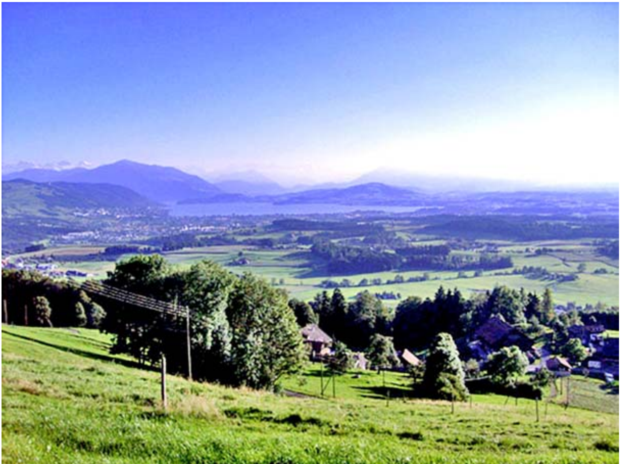
Dieses Archivbild zeigt, welche schöne Aussicht unser Barbeque bereichert hätte: Der Zugersee mit der Rigi (links) und dem noch erkennbaren Pilatus