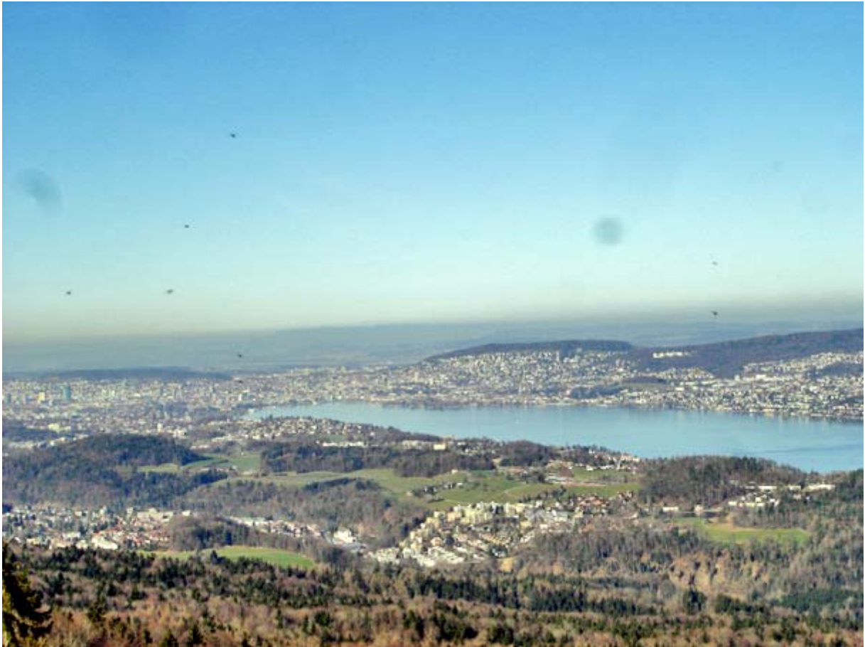
Die Stadt Zürich mit dem Prime Tower (links) und dem Dolder (halbrechts erhöht)

Natürlich war die Fernsicht auch auf dem Albishorn reduziert. Hier zwei Archiv-Fotos als Beispiele, was wir ohne den starken Dunst hätte sehen können: