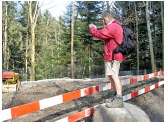
Fotograf eröffnet Kurzshorten-Saison

Mein Dank geht an Kurt, Roland, Sandro und Sue für die angenehme Begleitung auf dieser Tour. Ein besonderer Dank geht an Kurt für den offerierten Wein und die spendierte Espresso-Runde.