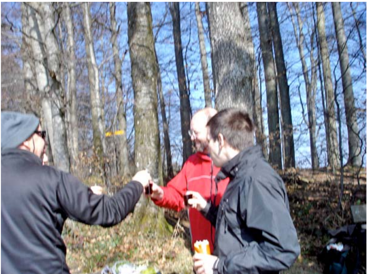
Wir geniessen es auch so: Während die Flammen lodern, ist erst einmal anstossen angesagt