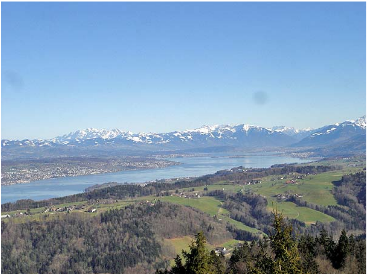
Zürich- & Obersee mit Säntis und Glärnisch-Massiv