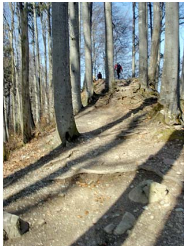
Der Kretenweg zum Albishorn wird uns als ein Highlight dies Wanderung in Erinnerung bleiben