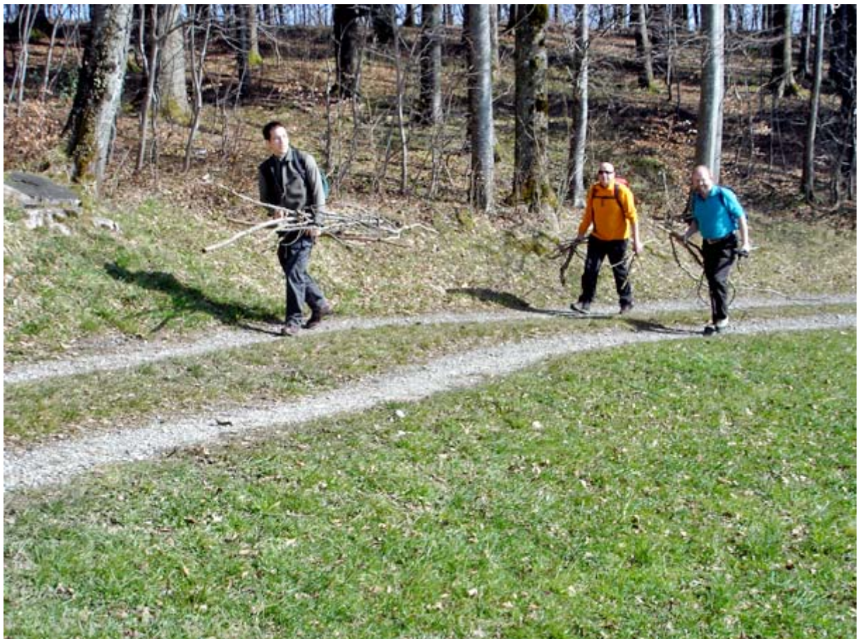
Oberhalb des Weilers Ober-Albis beginnen wir mit der Logistik für das Grillfest ;-)