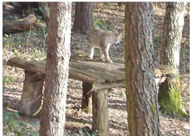
Luchs als Haus-Besitzer