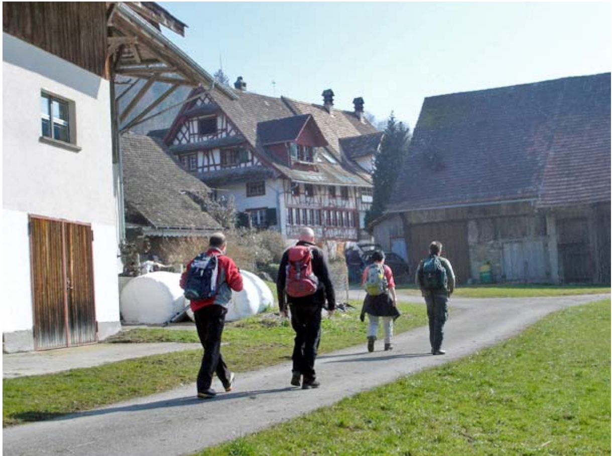
Eine halbe Stunde nach dem Start: Querung des Weilers Husertal