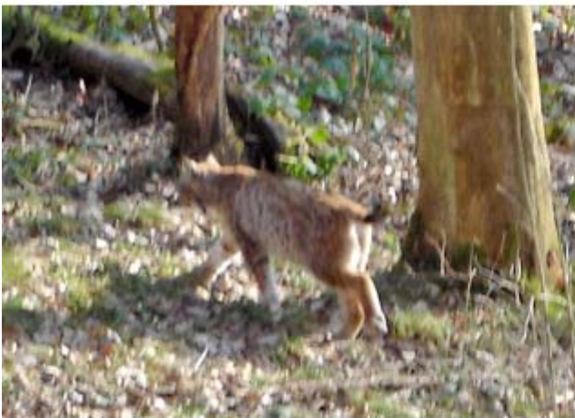
Luchs auf der Pirsch