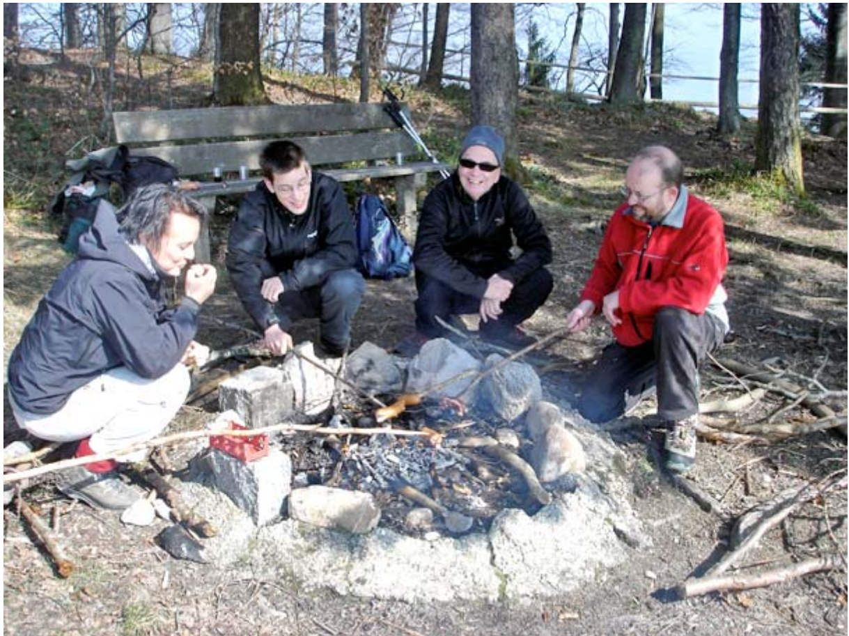
Dann geht's zur Sache: Fröhliches Cervalat-Braten