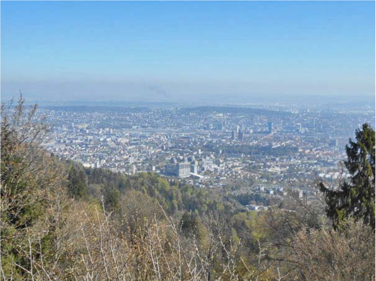
Blick auf die Stadt Zürich vom Uetliberg Kulm

Gleich zu Beginn eine imposante Perspektive: