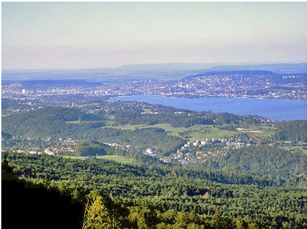
...ein gezoomter Blick auf die Stadt Zürich im Norden