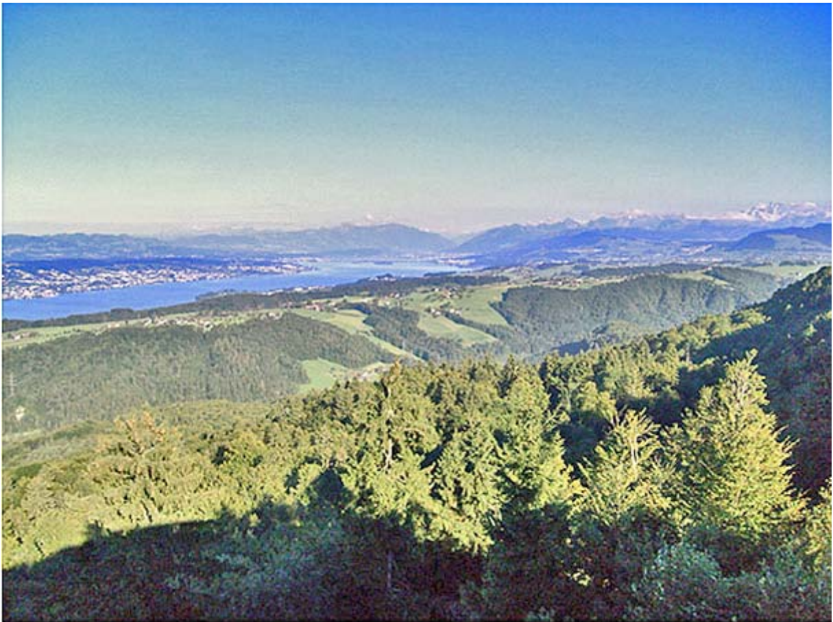
Blick auf den oberen Zürichsee mit den Glarner Alpen und...

Leider ist die heutige Fernsicht auf dem Albishorn stark getrübt; deshalb müssen zwei Archivbilder vom Herbst 2011 herhalten um aufzuzeigen, was dieser schöne Aussichtspunkt zu bieten imstande ist: