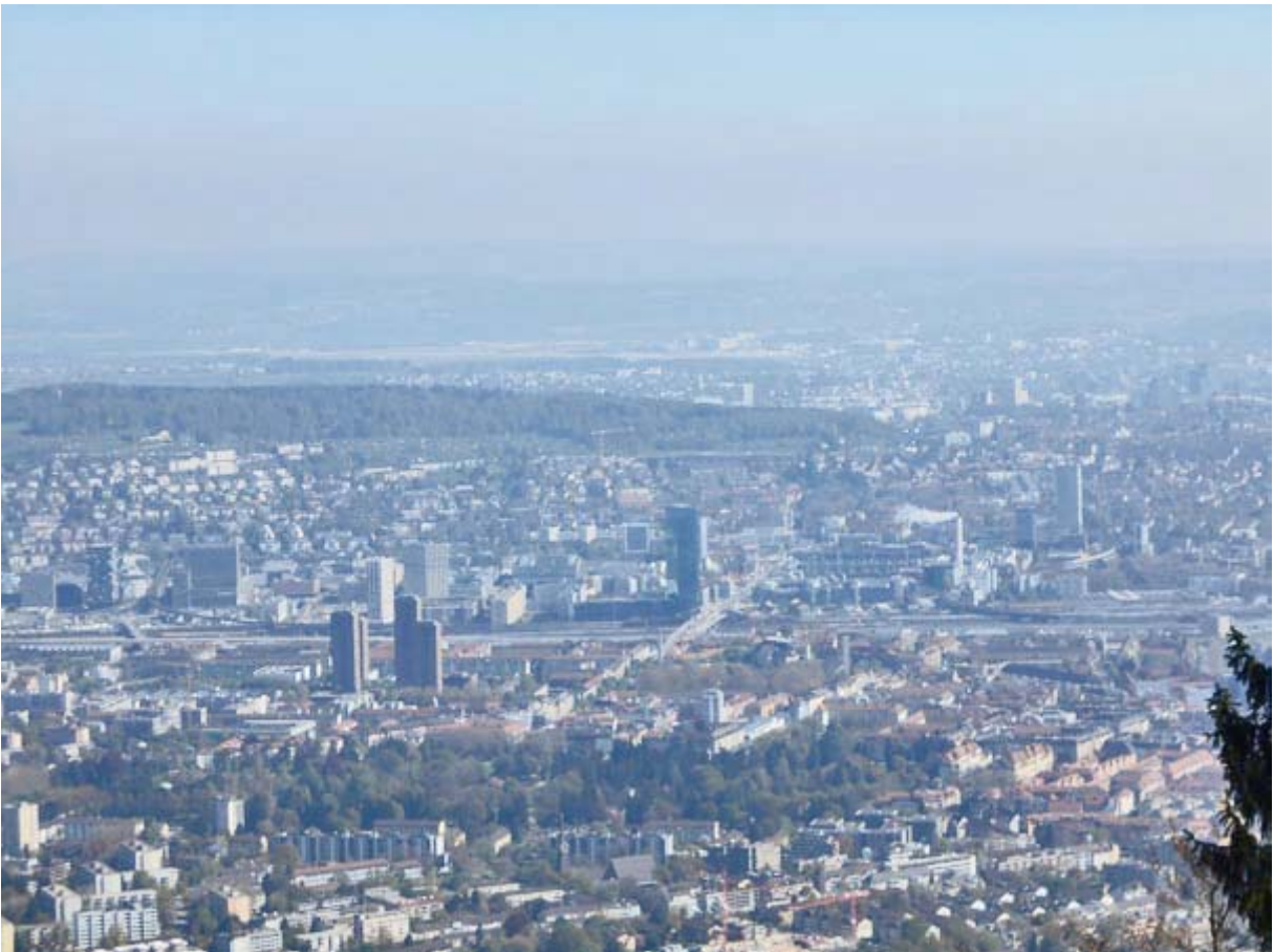
Nun ist im Hintergrund auch der Flughafen Kloten erkennbar