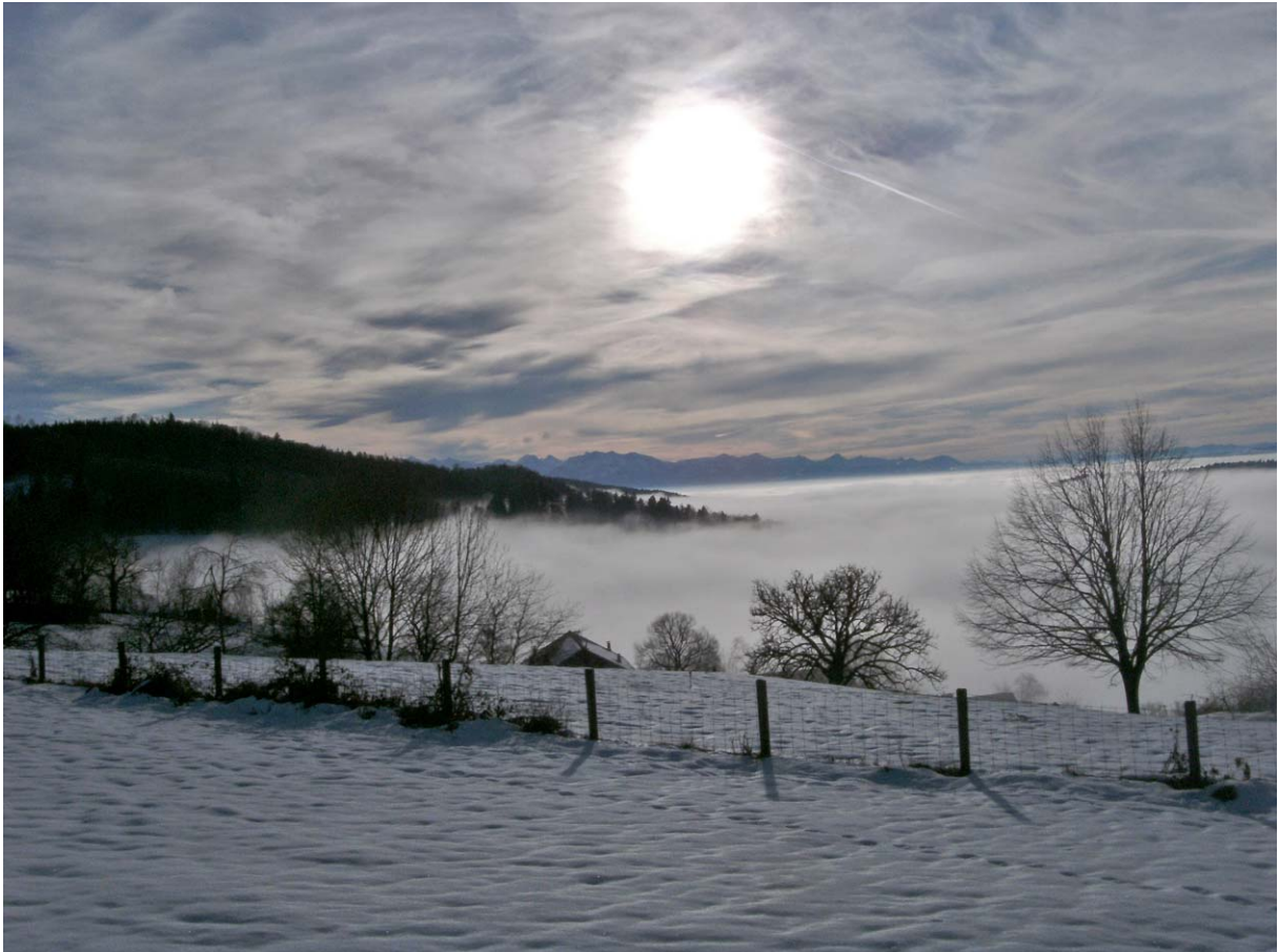
Mystische Stimmung über dem Reppischtal

Kurz vor dem Teehüsli steige ich in Richtung hintere Buechenegg ab: