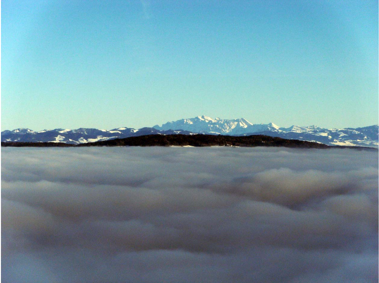
Der gezoomte Säntis

Kurz vor dem Teehüsli steige ich in Richtung hintere Buechenegg ab: