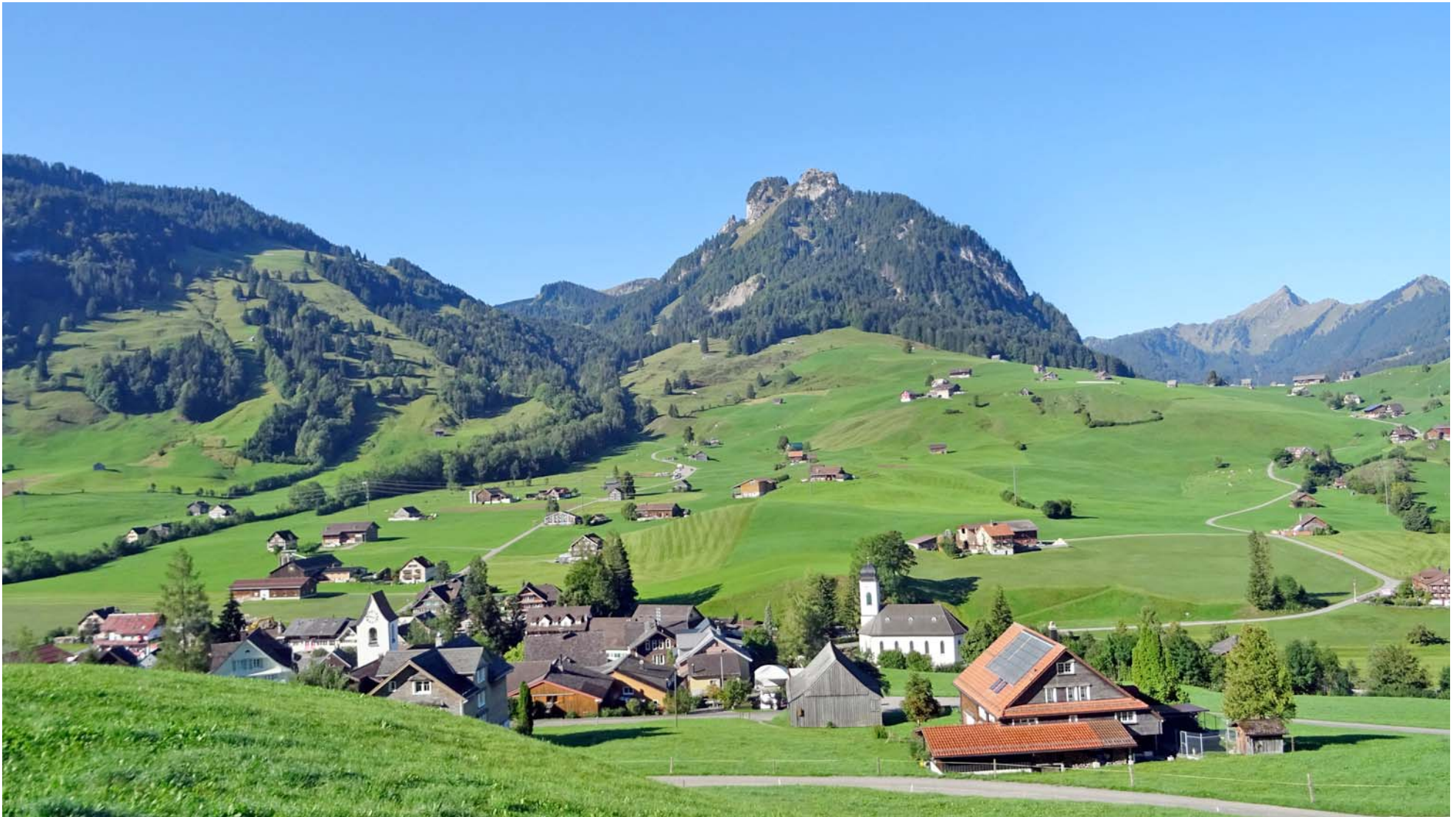
Blick zurück auf den Startort Stein SG; in der Bildmitte oben der dominante Gulme

Nach einer 150 m langen Flachstrecke geht's bis zum Risipass nur eines: Bergauf, zum Teil recht steil: