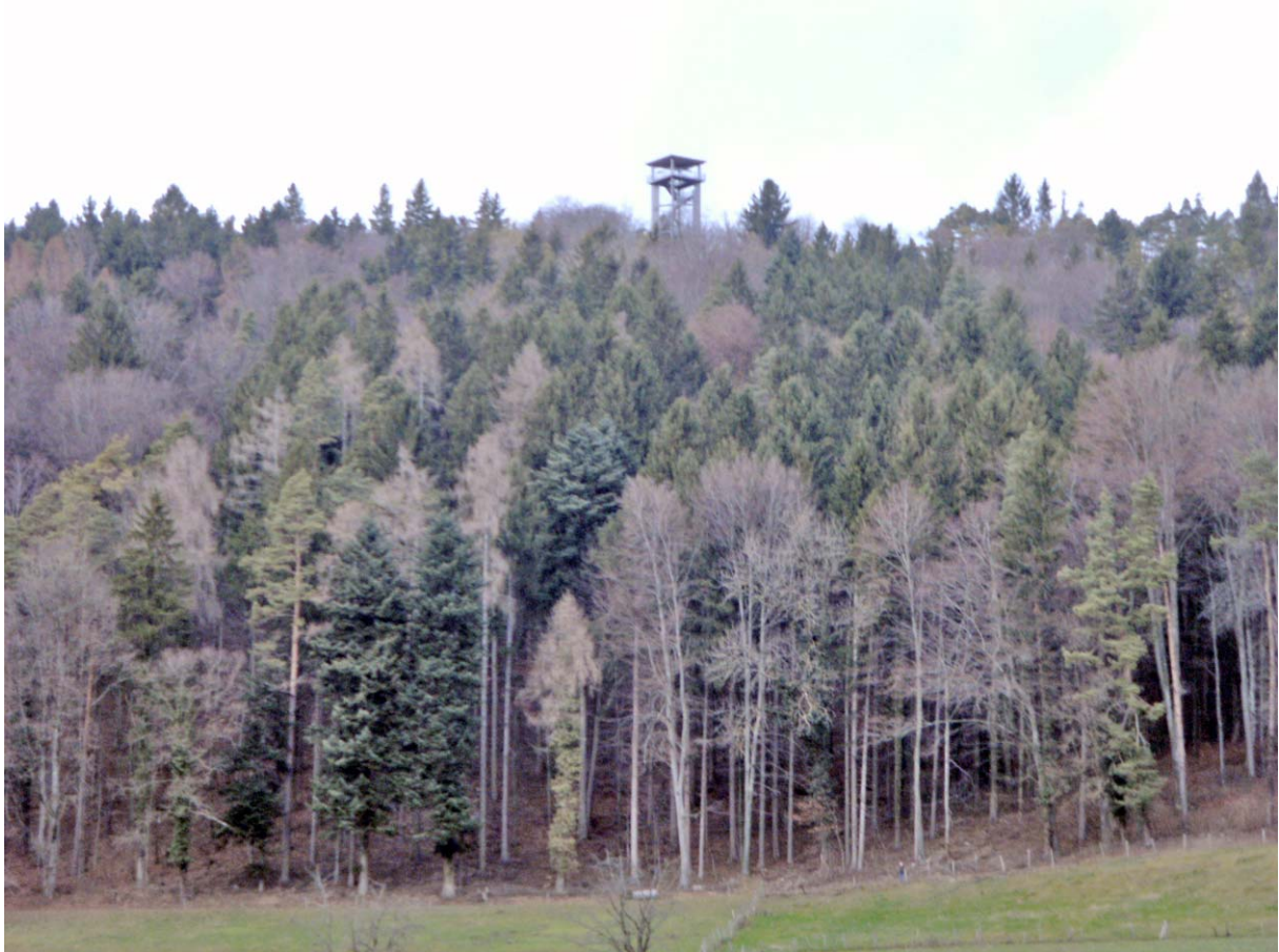
Gezoomter Hochblick zum Aussichtsturm Altberg

Wir steigen in Richtung Oetwil ab und drehen unterwegs links ab nach Geroldswil: