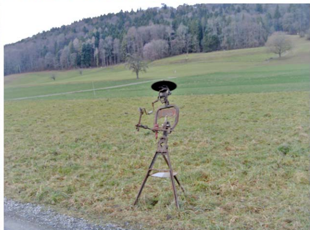
„Art by Agro“ im Limmattal