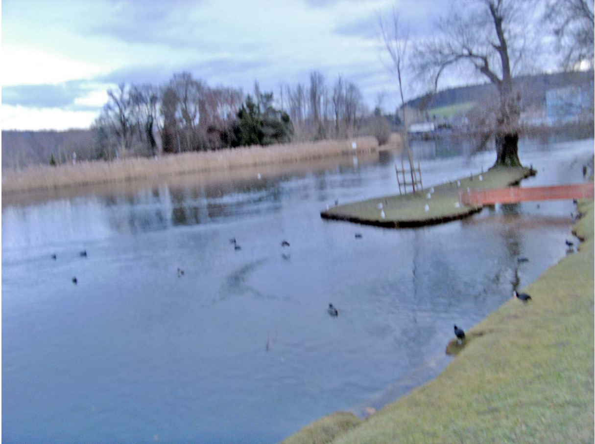
Vogelparadies nahe unserem Ziel Bahnhof Dietikon

Fazit dieser Wanderung: Die Route der beschriebenen Altbergschleife entspricht einer ausgedehnten Genusswanderung und kann ganzjährig begangen werden. Im Hochsommer schützen die vielen Wald-Passagen vor der Hitze; uns schützten sie vor den heftigen Winden. Mein Dank geht an Willi für die angenehme Begleitung und die spendierte Runde auf dem Altberg.