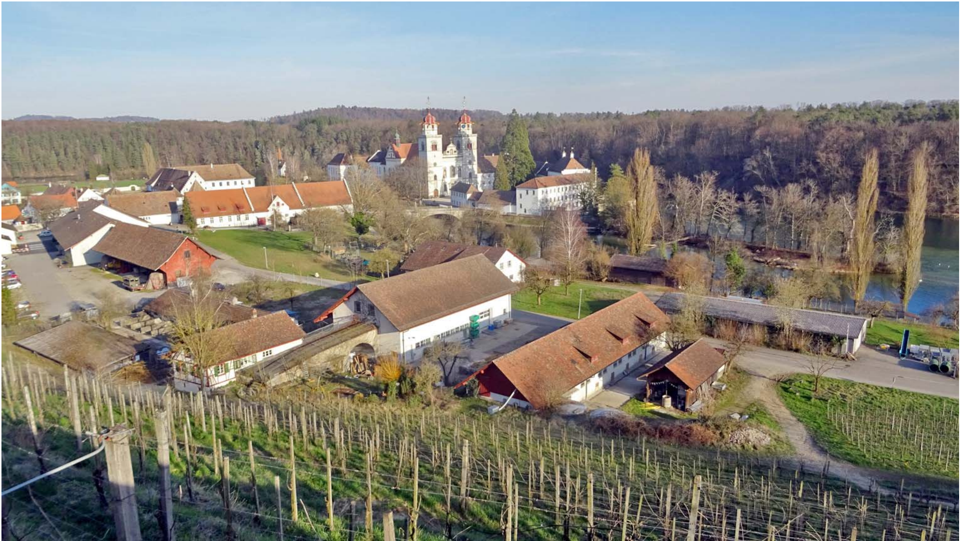
Die Klosteranlage Rheinau, auf genommen vom Plateau der Bergkirche Rheinau.