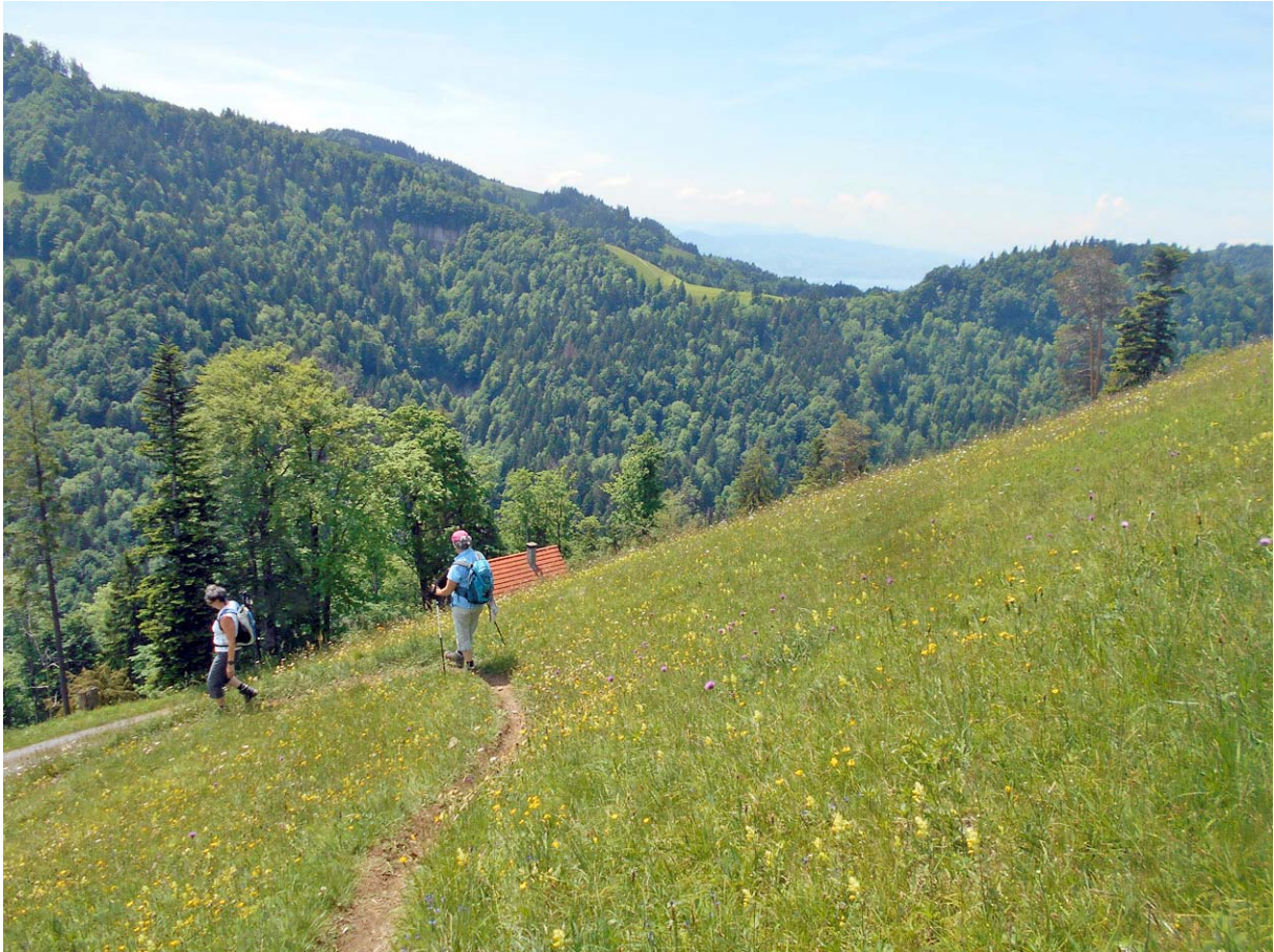
Einzige Wald-lose Passage über das Dägels-Wiesli

Der steile, fast endlose Abstieg zur Tösssscheidi wird uns nachhaltig in Erinnerung bleiben: