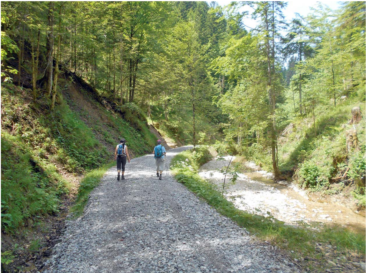
...Brandenfels in Richtung Wolfsgrueb auf