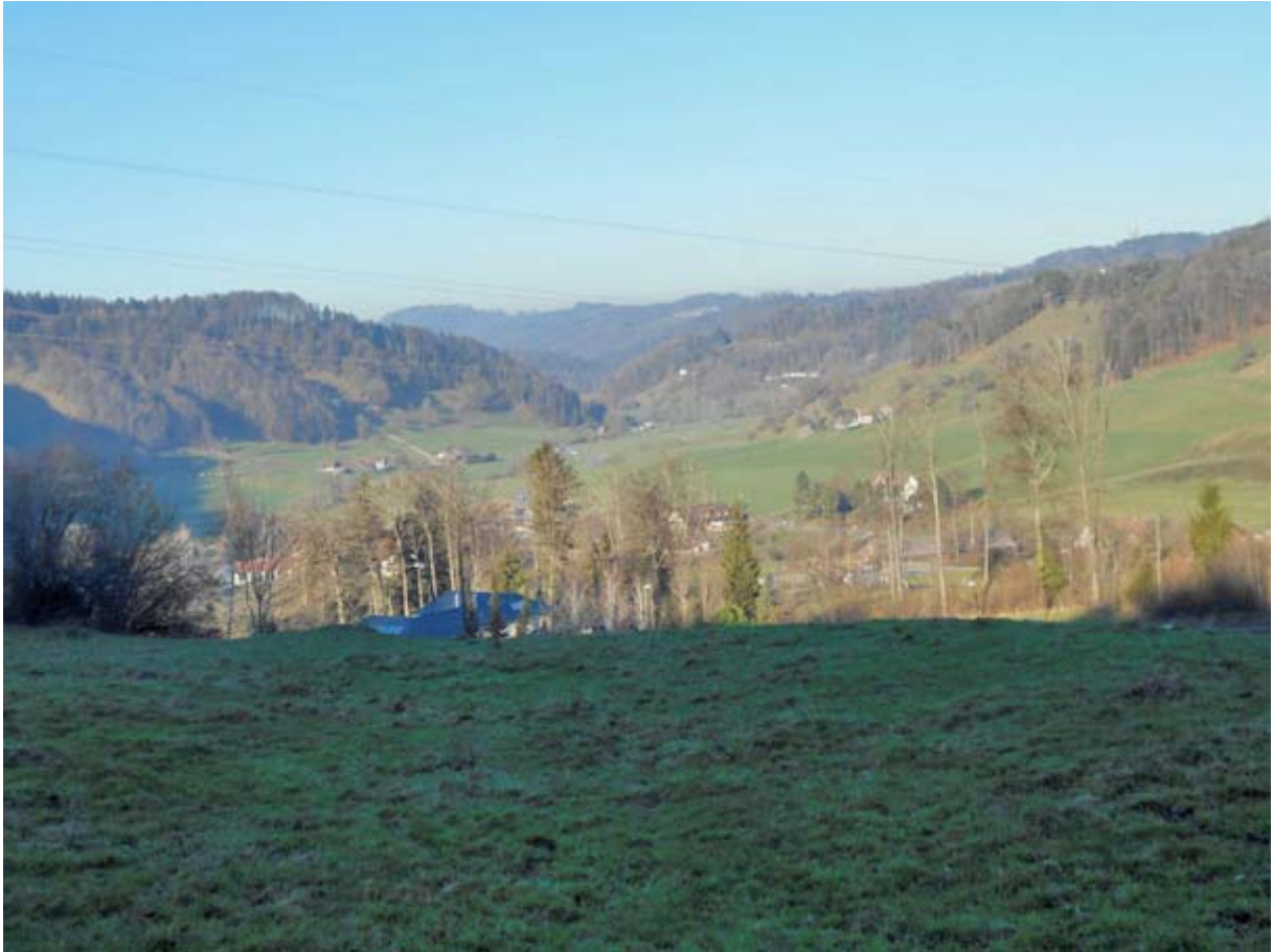
Blick auf das obere Reppischtal mit dem Uetliberg im Hintergrund

Kurz nach 14:00 Uhr fahre ich via dem Hedinger Waldsee hoch zum Weiler Müliberg: