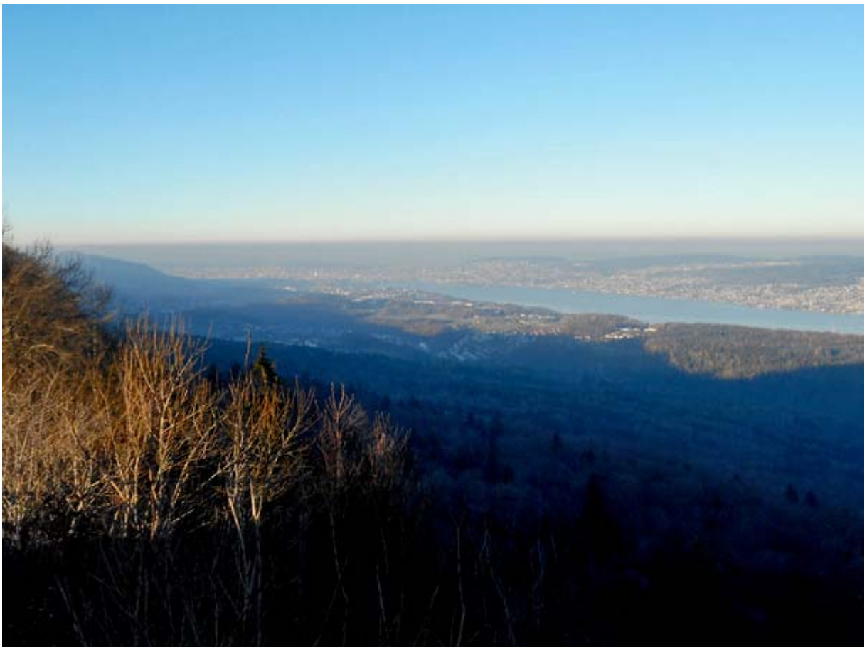
Der untere Teil des Zürichsees mit der Stadt Zürich