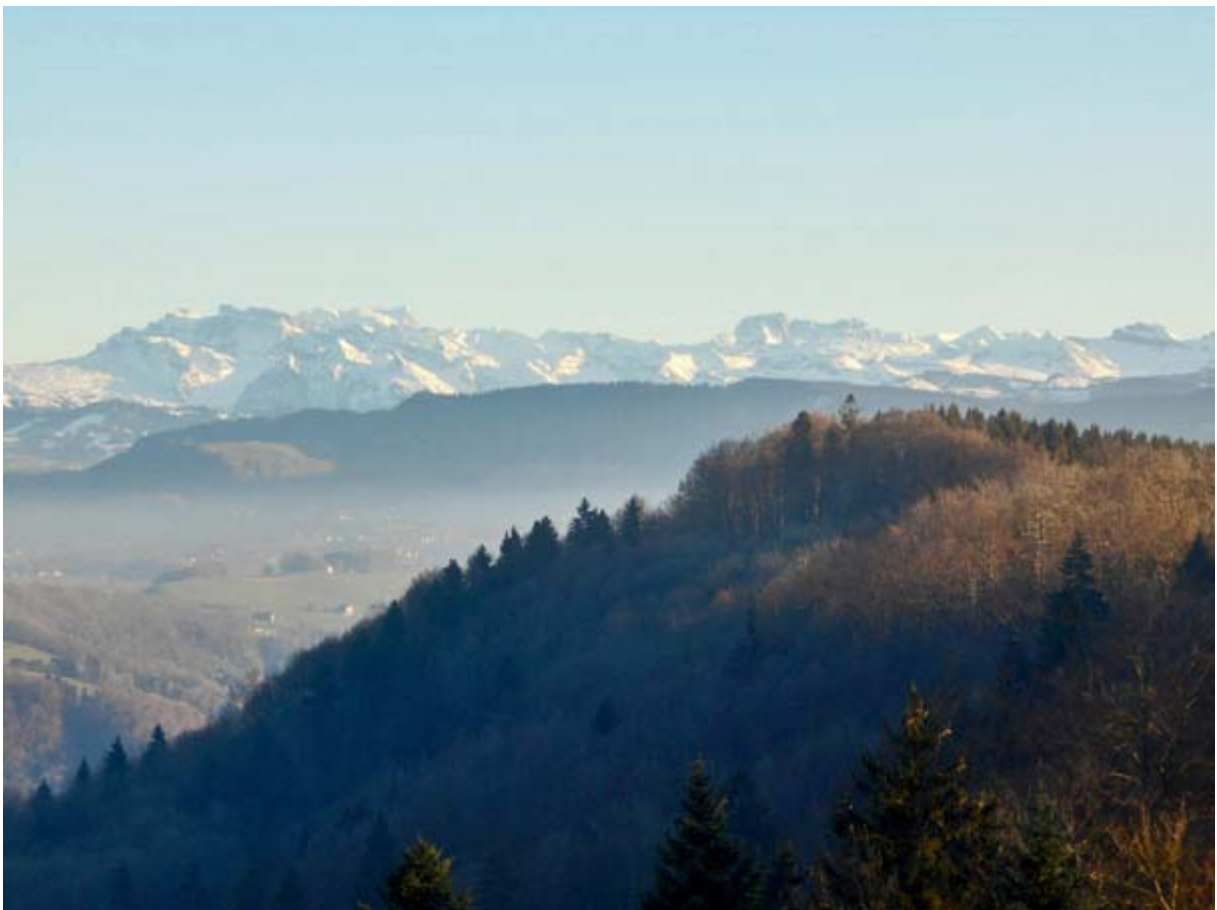
Gezoomter Glärnisch und Drusberg