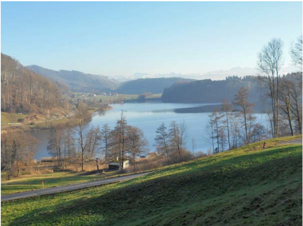
Oben am Bergkamm links hinten erkenne ich mein heutiges Ziel, das Albishorn

Nach der Überquerung des Aeugsterbergs eine rasante Abfahrt zum idyllischen Türlerseer