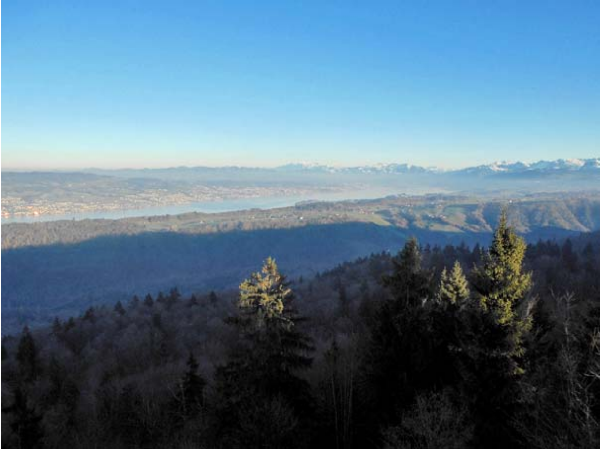
Der obere Teil des Zürichsees mit den Glarner Alpen

Oben auf der Terrasse des Albishorns ist die Aussicht wieder einmal Phänomenal: