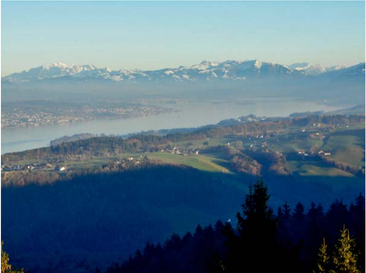
Gezoomte Glarner Alpen mit den noch erkennbaren Inseln Ufenau und Lützelau