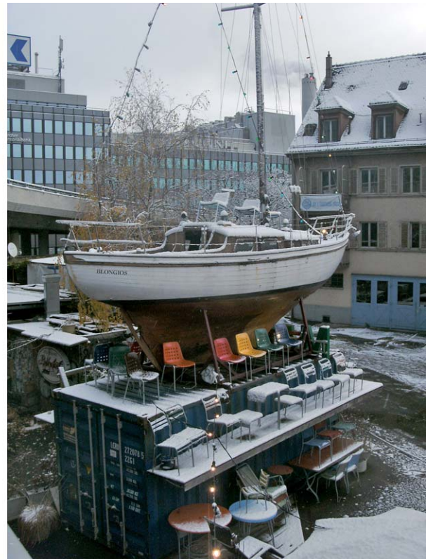
Links sind rund 50% meiner heutigen Höhenmeter mal etwas anders visualisiert und rechts eine Gartenbeiz der speziellen Art und keiner sitzt drin ;-)