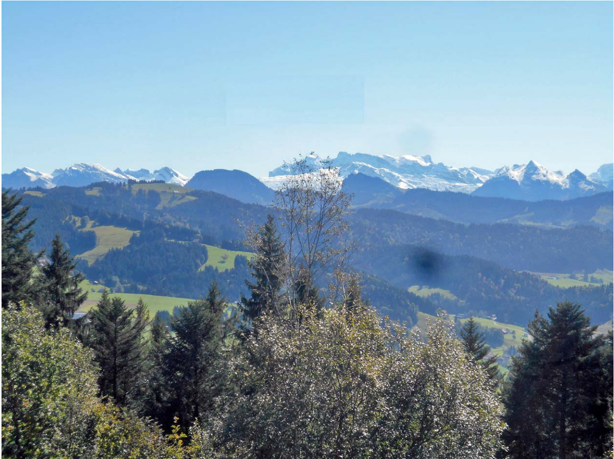
Blick gegen Südwesten: Das Glärnisch-Massiv grüsst aus der Ferne

Wie die Aussicht vom Etzel-Kulm sein könnte, zeigen diese zwei Archiv-Bilder: