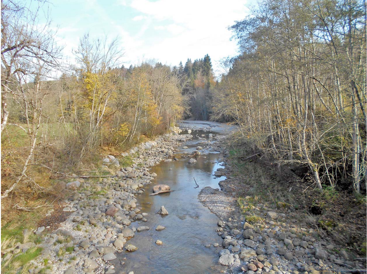
Blick von der Brücke auf die noch junge Sihl

Beim Geissboden überqueren die Sihl und nehmen (für heute) Abschied von ihr: