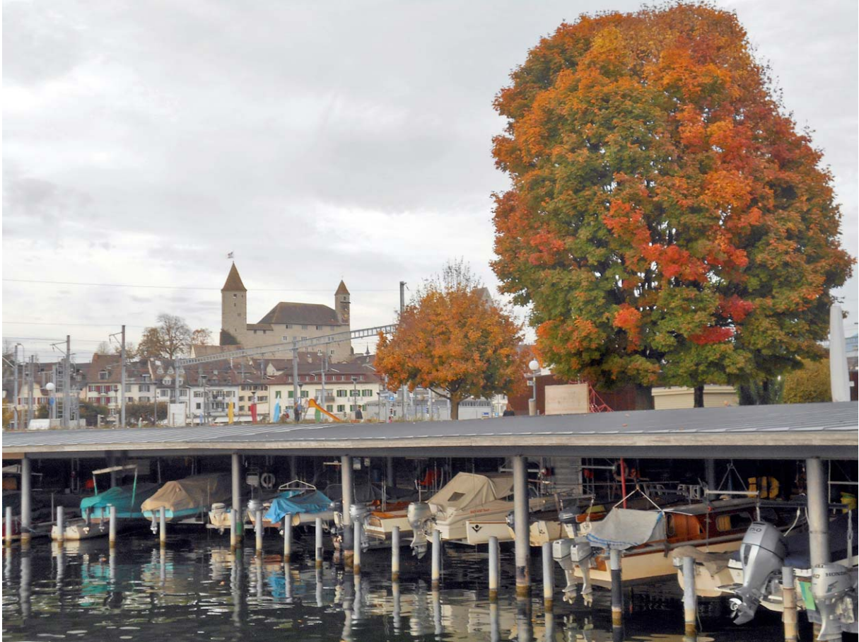
Das alte Schloss Rapperswil wird eskortiert von den aktuellen Herbstfarben.

Ganz am Schluss unserer Wanderung ein würdiges Schlussbild: