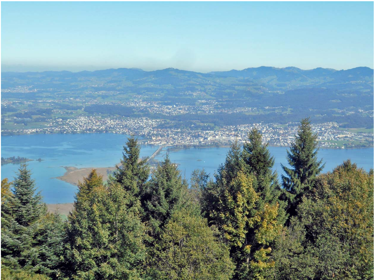
Tiefblick gegen Osten: Unser Wanderziel Rapperswil grüsst von weit unten ;-)