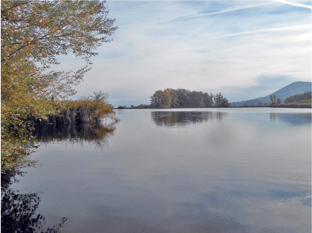
Der Itlismoosweiher oberhalb von Samstagern

Weil er so schön ist, nehmen wir gerne einen kleinen Umweg in Kauf: