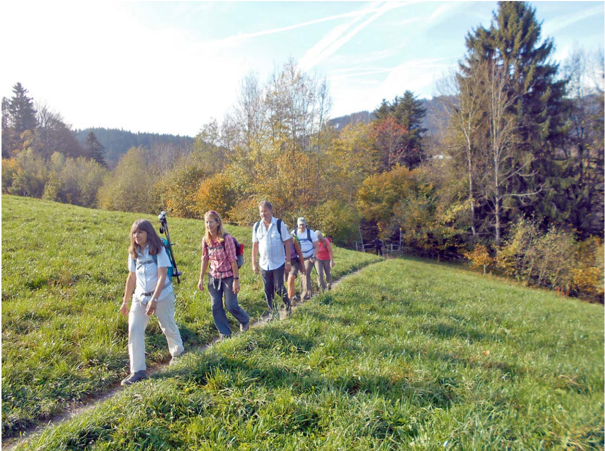
Man(n) / Frau beachte die sommerlichen Wander-Tenues

Exakt zu Beginn des nun folgenden Aufstiegs in Richtung Büel setzt sich die Sonne durch: