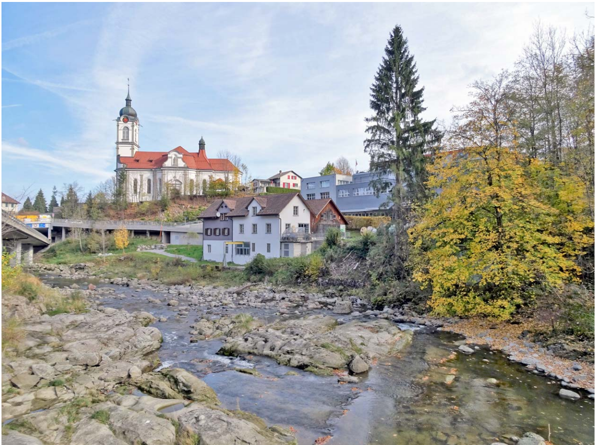
Blick zurück auf die 1907 – 1909 erbaute Barock-Kirche

Wir erreichen Schindellegi um 10:30 Uhr und biegen in den Sihlufer-Weg ein: