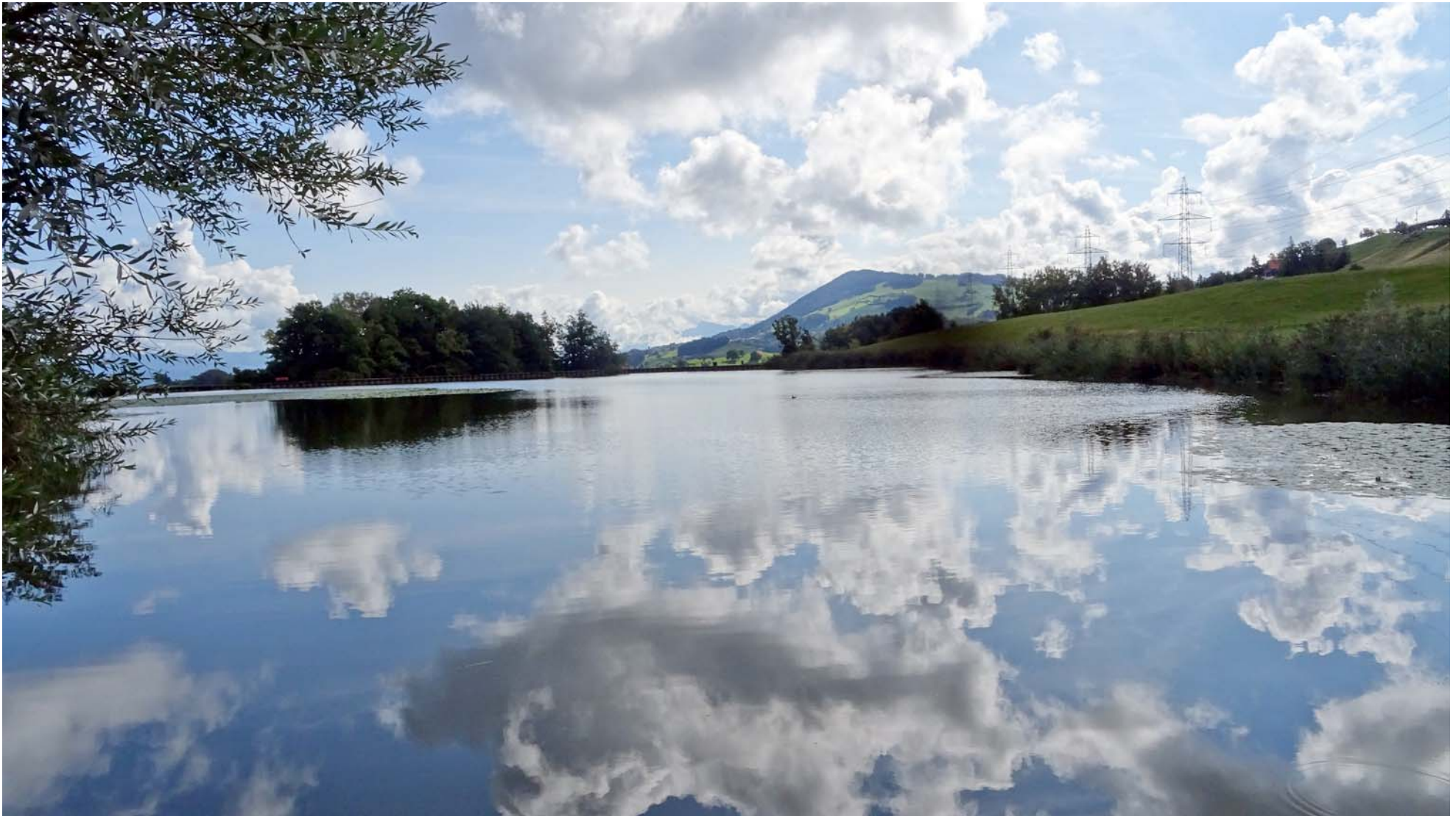
Der lauschige Itlismoosweiher, in der Bildmitte hinten unser Etappenziel Etzel

15 Minuten nach unserem Start beim Bahnhof Samstagern stehen wir am Ufer des ersten Gewässers am heutigen Tag: