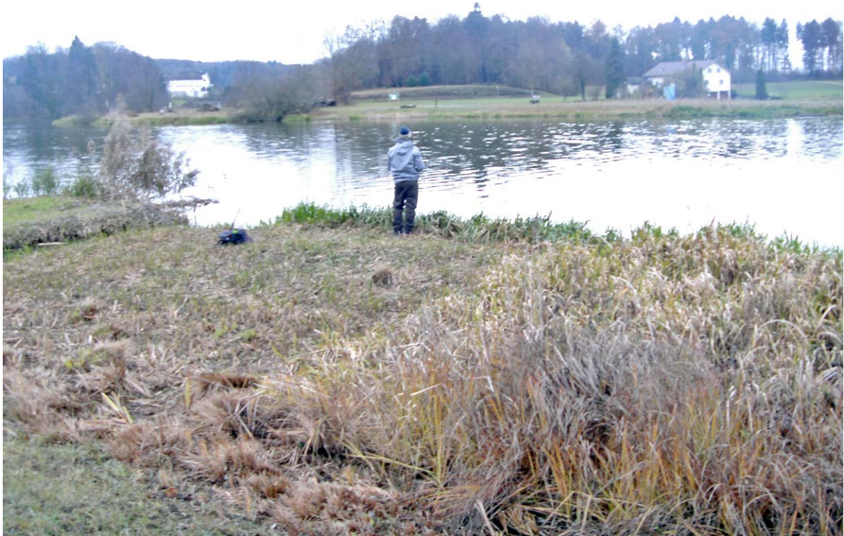
In der Bildmitte links das Kloster St. Martin

Unterwegs angetroffen: Da wartet einer wohl vergeblich auf die Geisshof-Fähre ;-)