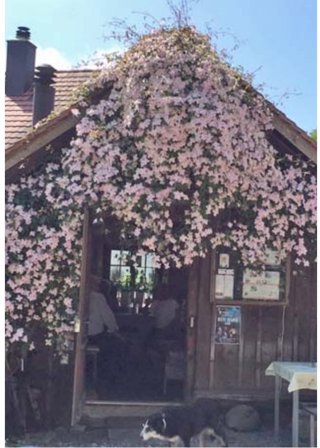
Links eine der vielen Magerwiesen, rechts ein blumiges Haus-Dekor

Das Highlight dieser Route ist der Cheisacher Aussichts-Turm mit dem eigenwilligen Design: