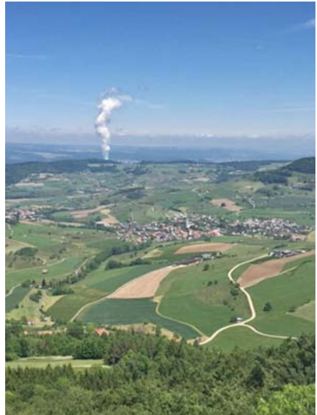
Rechts die Aussicht vom Turm auf die Gemeinde Sulz vor der Dampffahne des AKW Leibstadt

Bei allen Fotos auf dieser Seite war Ruth am Drücker