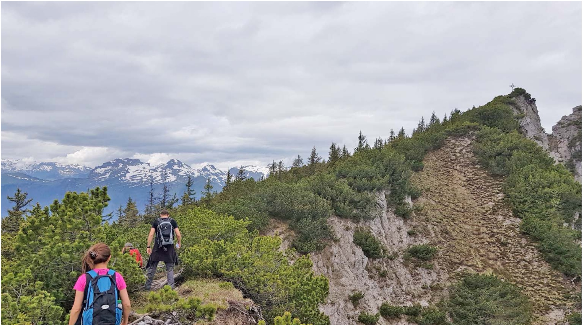
Wir folgen dem gut erkennbaren Wurzelweg zum Gipfelkreuz

Vom Chemi folgt der finale (nicht markierte) Auf stieg auf den Alpspitz: