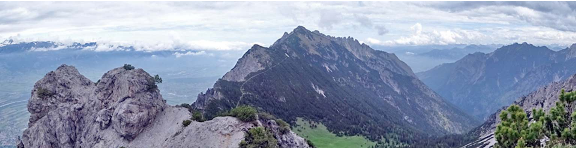
Im Nordosten die ganze Bergkette mit Kuegrat, dem Gasellikopf und den 3 Schwestern