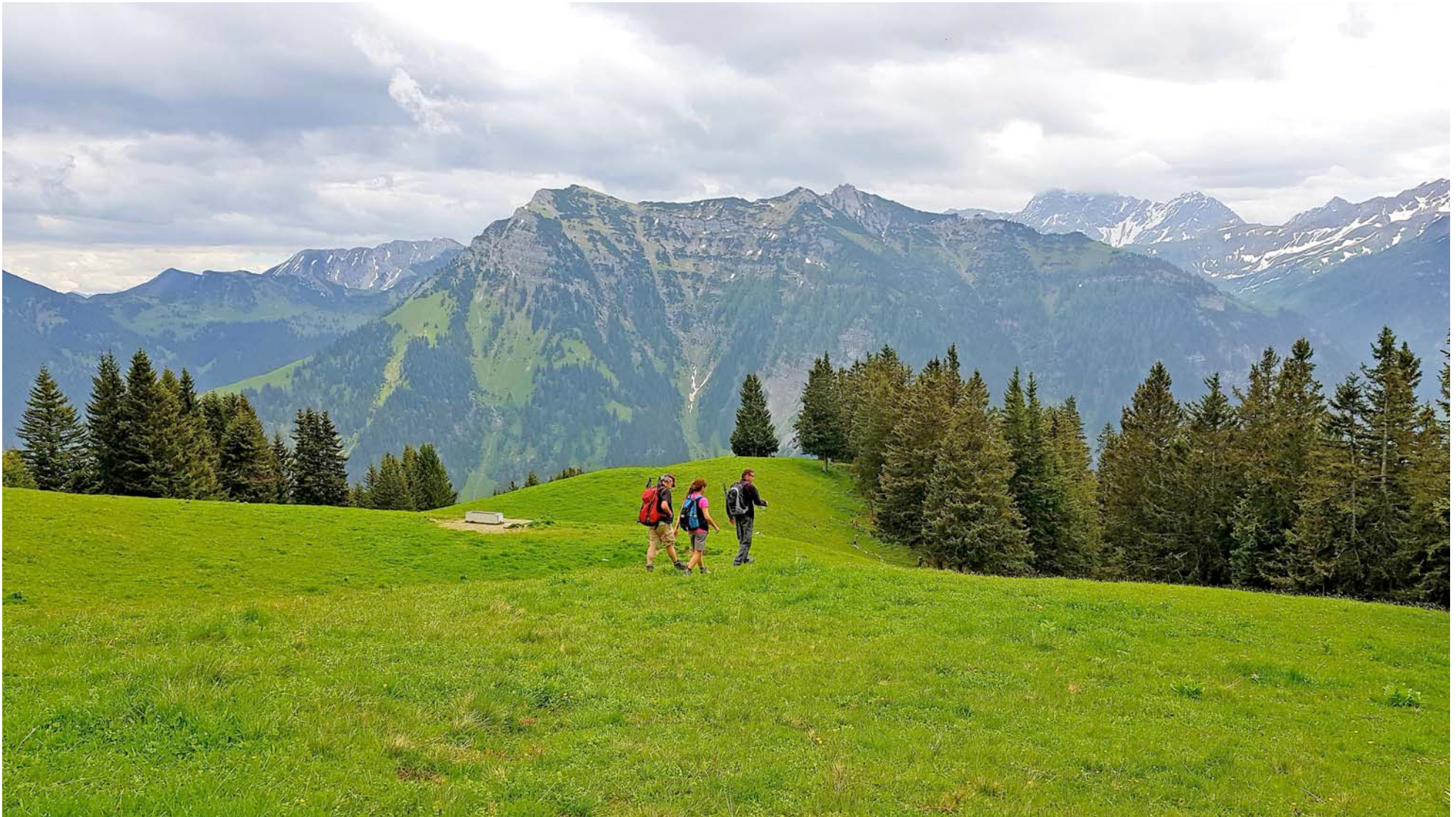
Herrliche Wiesland-Traverse vor dem Panorama der Liechtensteiner Alpen

Unterwegs nach Stegbauen wir auch noch die Besteigung des Plattaspitz's ein: