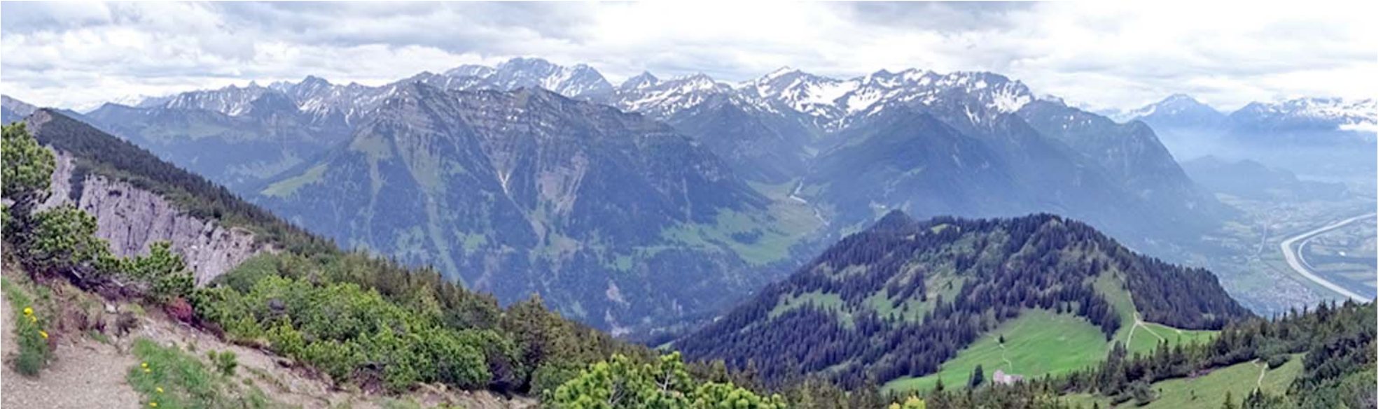
Im Westen die Bündner und Glarner Alpen, rechts aussen das obere Rheintal