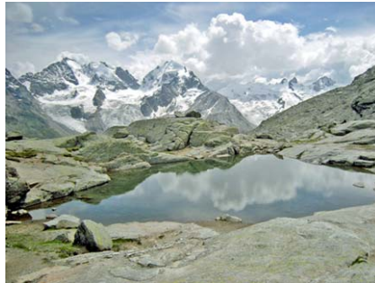
Bergsee auf Fuorcla Surlej