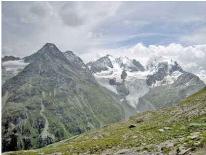
Die Berninakette zeigt sich