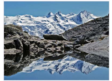
Optische Spielerei der Natur