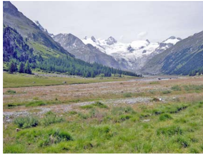
Blick vom Hotel Roseg