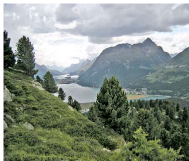
Ein letzter Blick zurück