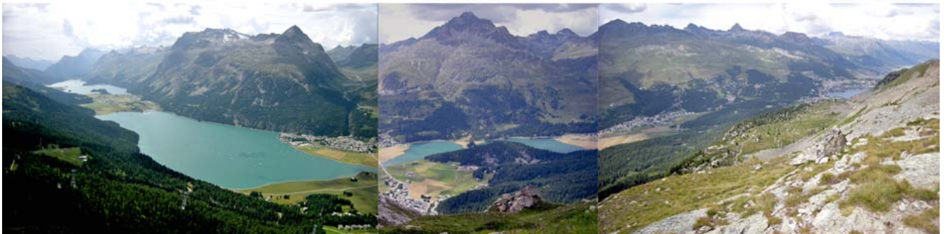
Atemberaubende Panoramasicht von Crap Alv