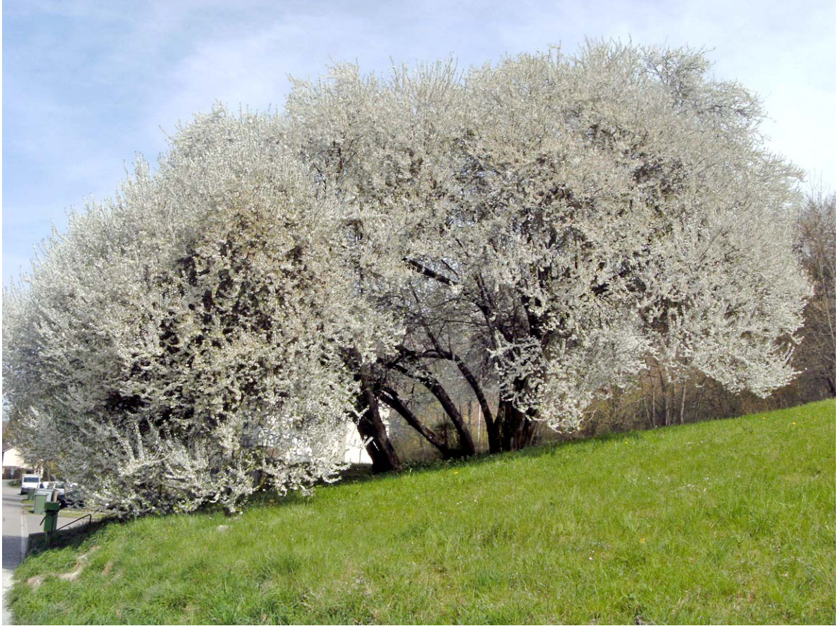
Stellvertretend diese mächtige Schlehe oberhalb von Rorbas.

Am heutigen Tag durften wir immer wieder staunen, wie fortgeschritten die Blust schon ist: