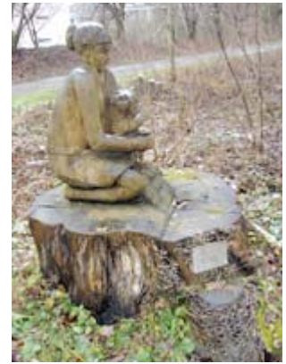
Mutter mit Kind