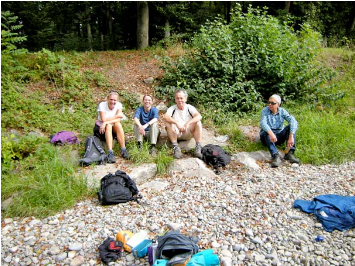
In einem solch lauschigen Ambiente hielten wir denn auch unsere Mittagsrast ab.