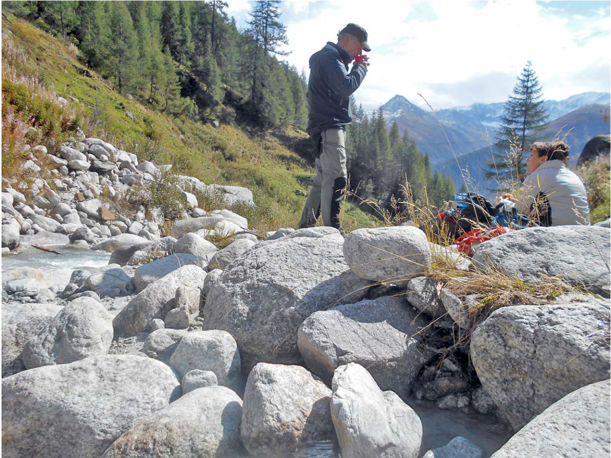
Kalorien-Nachschub direkt am Bach-Ufer

In diesem schönen Ambiente halten wir unsere einzige ausgedehnte Rast ab: