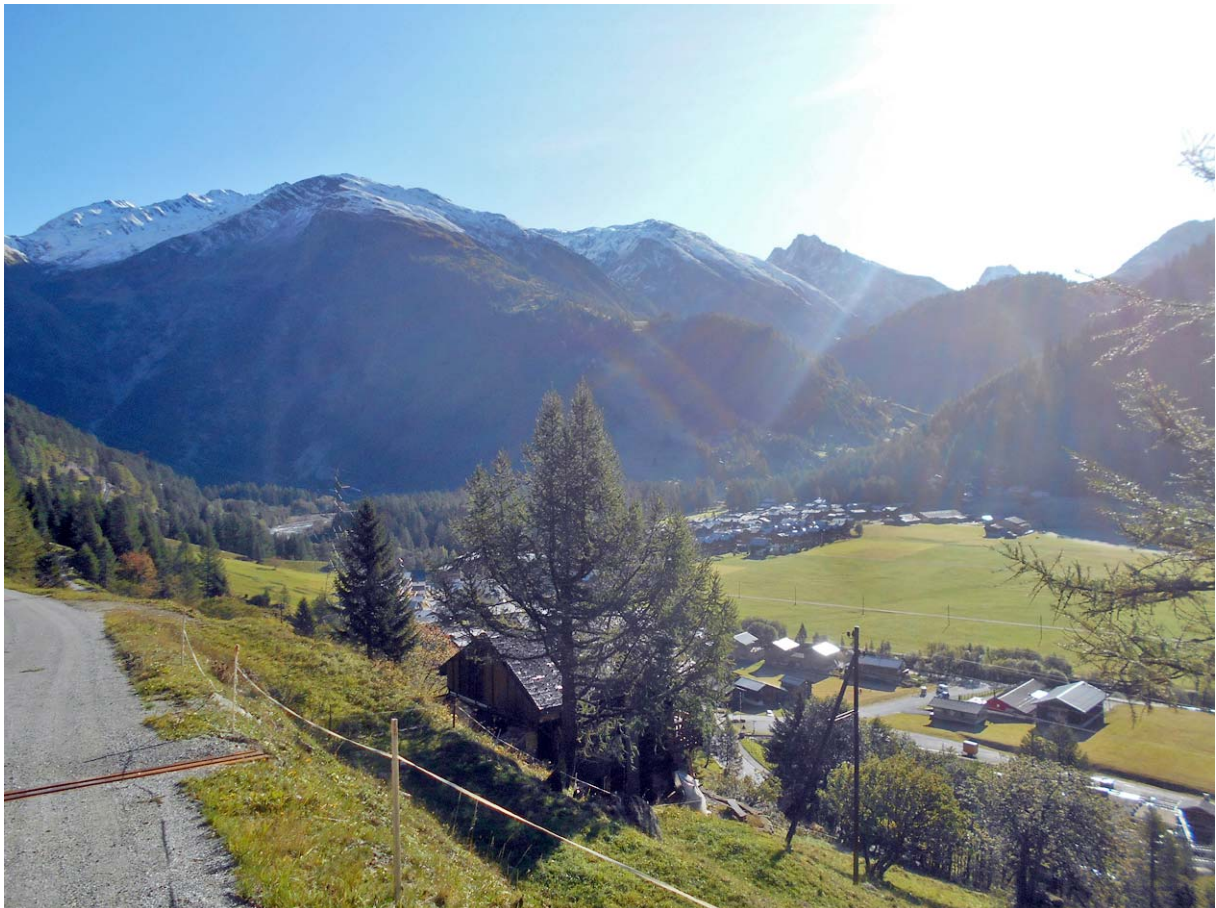
Blick zurück auf unseren Startort im ersten Aufstieg

Es ist 09:10 Uhr, als wir in Oberwald starten: