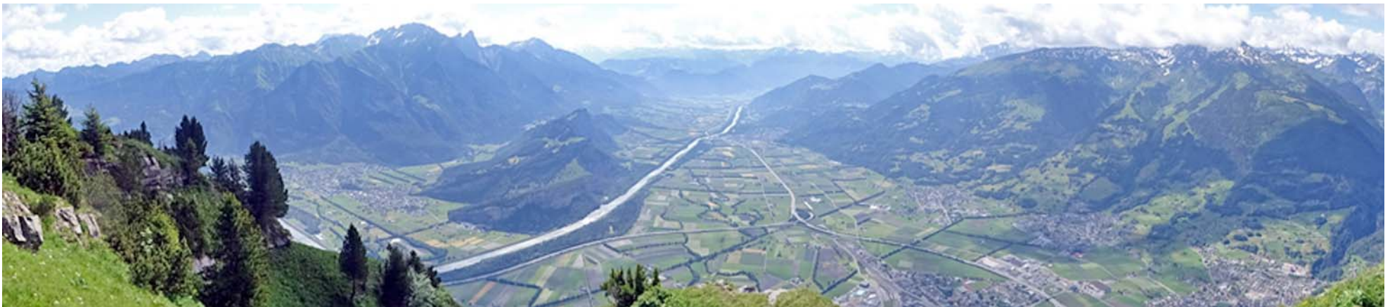
Blick gegen Süden: Das Churer Rheintal