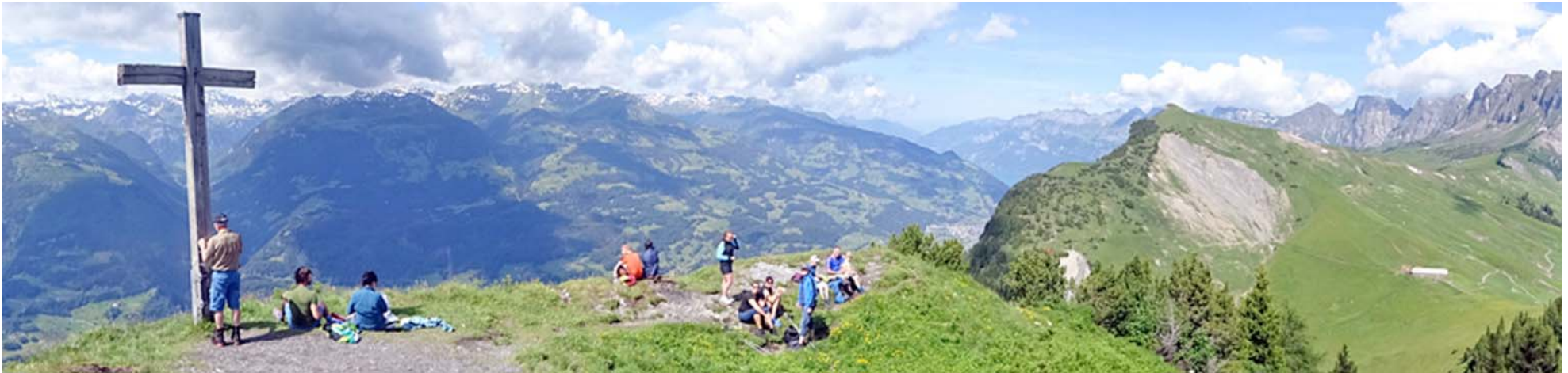
Blick gegen Norden, hinter dem Gipfelkreuz das Weisstannental, rechts der Bildmitte in Stück Walensee