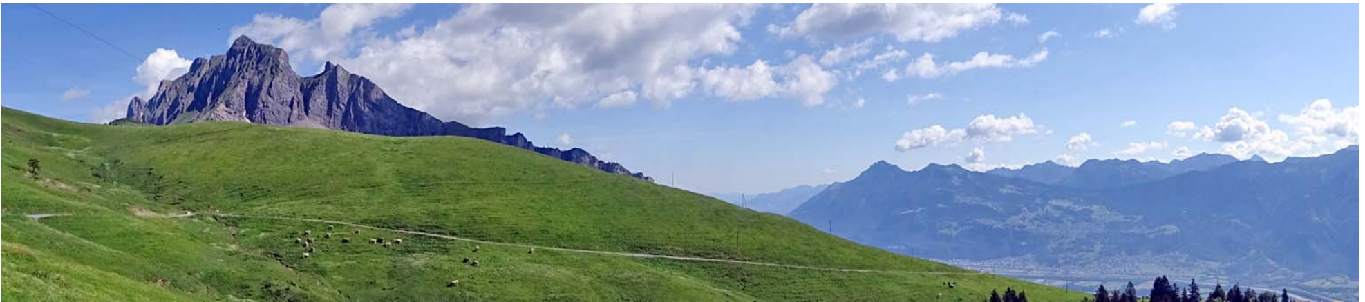
Der Alvier, rechts unten das obere Rheintal