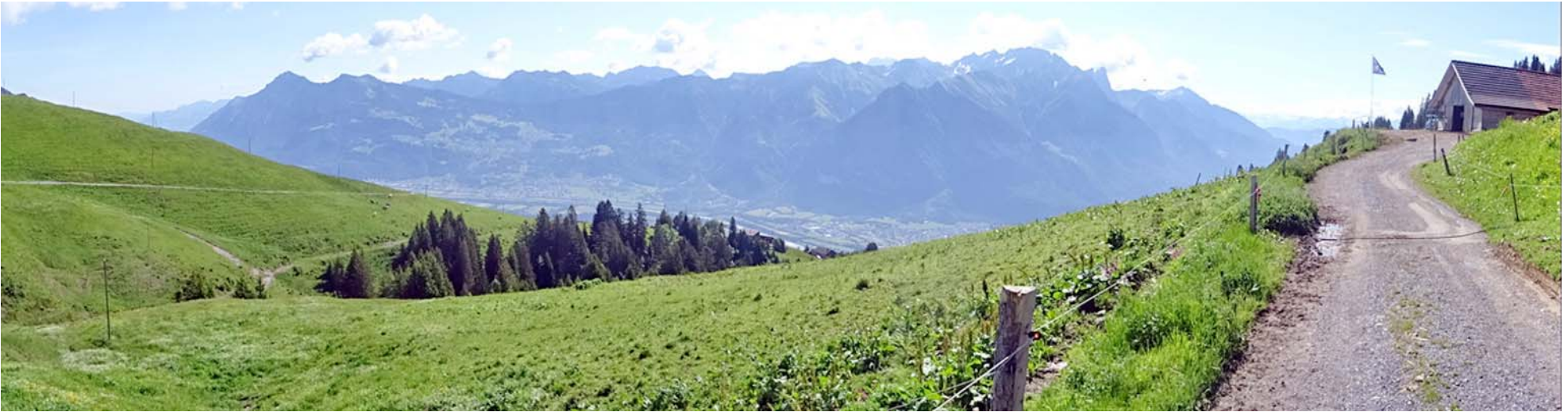
Die Liechtensteiner Alpen, rechts aussen der Falknis