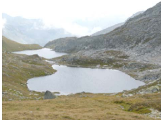
Laghi di Valletta*