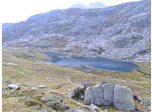
Lago d'Orsiorora 1