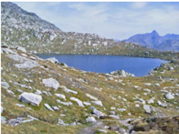
Lago d'Orsiorora 2