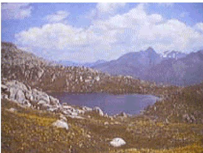
L. di Orsioro-1