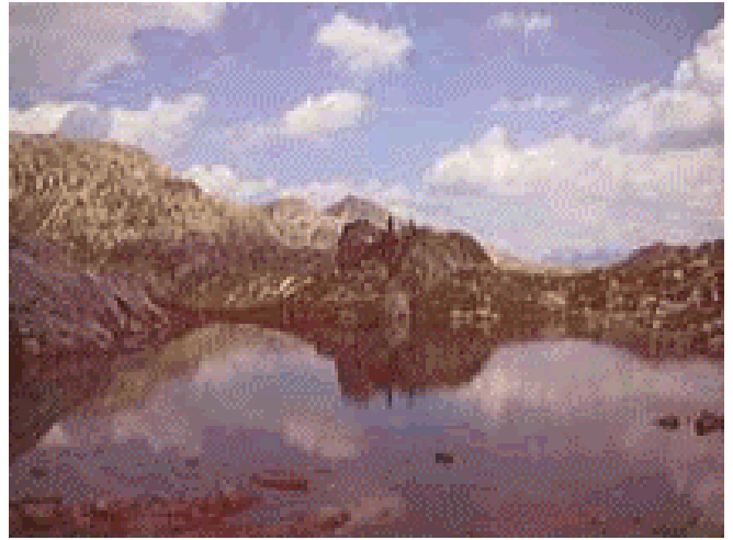
L. della Volleta