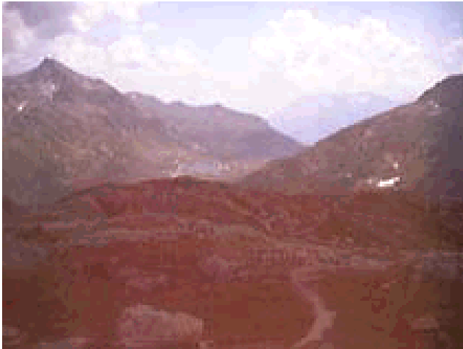
Gotthard-Hospiz mit Monte Prosa