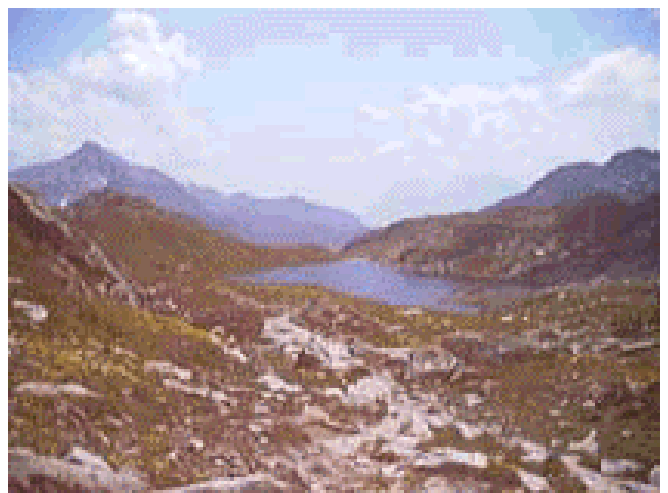
L. di Orsioro-2