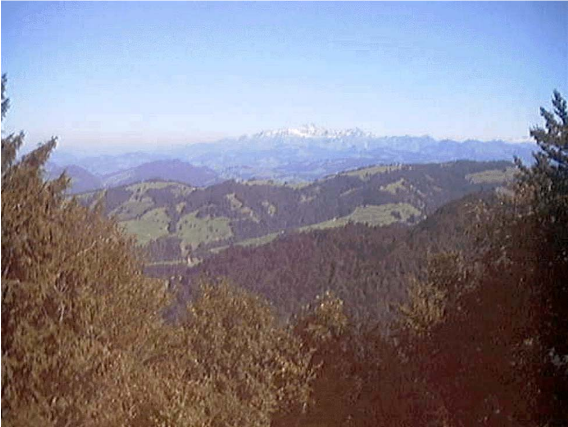
Blick vom Schnäbelhorn in Richtung Säntis