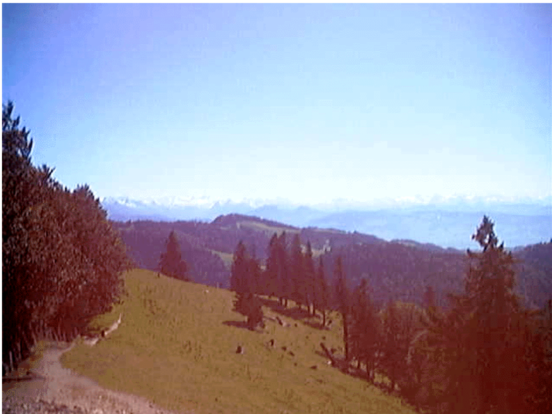
Blick vom Schnäbelhorn in Richtung Berner Alpen

Ein Service von Auer Hiking Tours: Weitere Wandervorschläge auf www.hrm-auer.ch/bibliografie.php