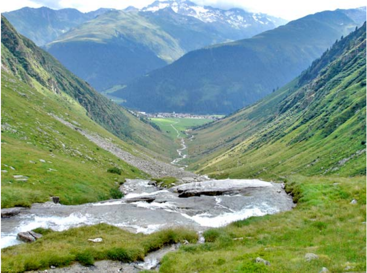
Höhenwanderung Bristen – Etzlihütte – Chrüzlipass – Sedrun