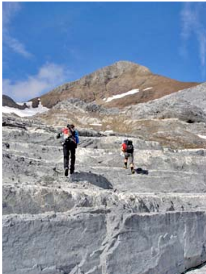
Musenalp – Uri Rotstock – Musenalp: Das absolute Highlight des Jahres!