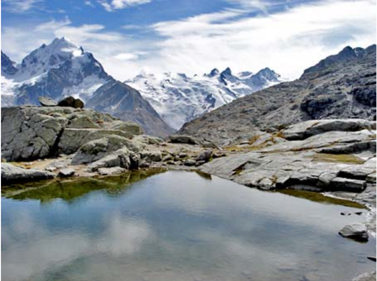
St. Moritz — Hahnensee — Fuorcla Surlej — Val Roseg — Pontresina