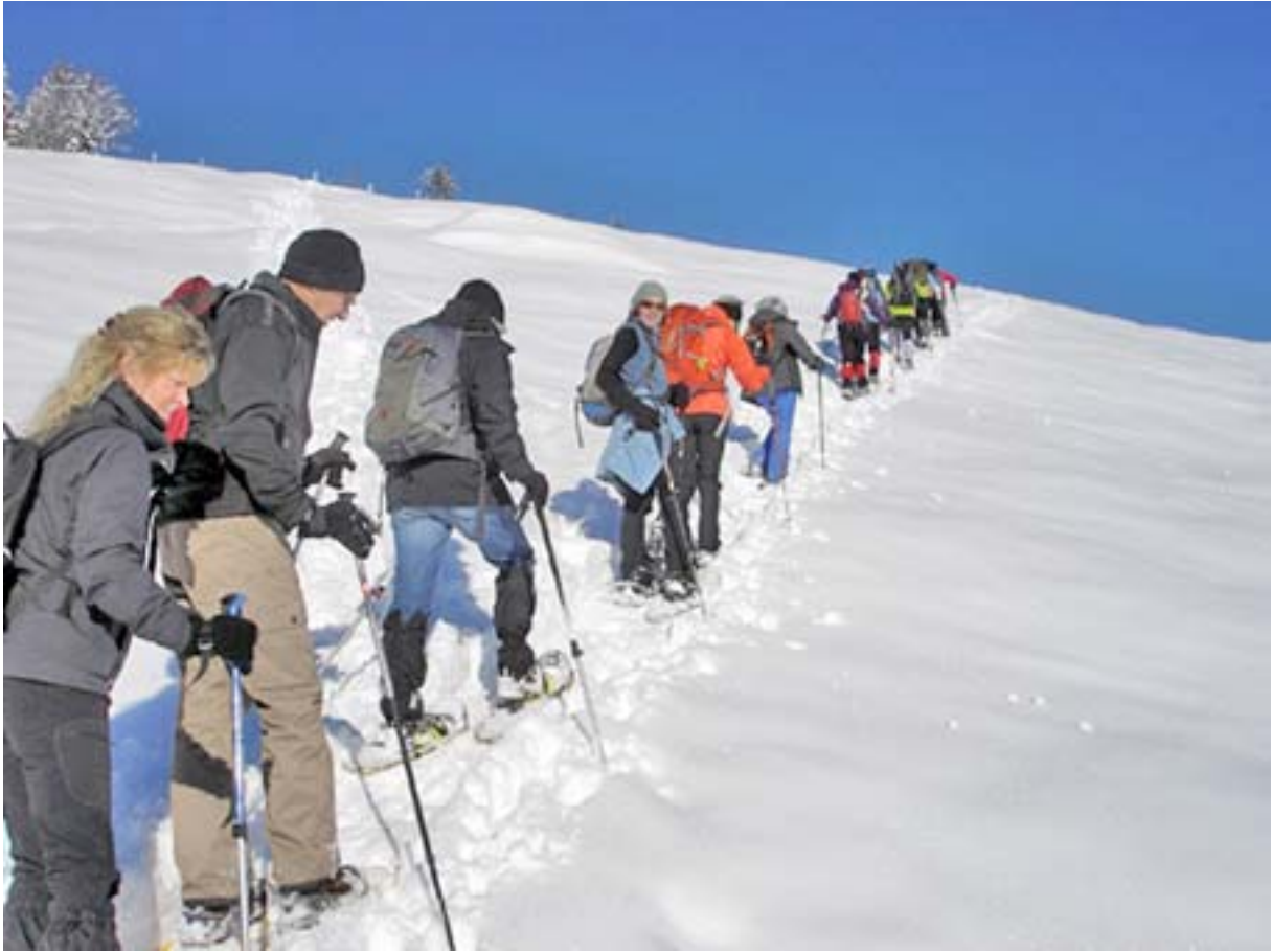
Schneeschuhwanderung von Rothenthurm auf den Ahoren und abenteuerlich zurück