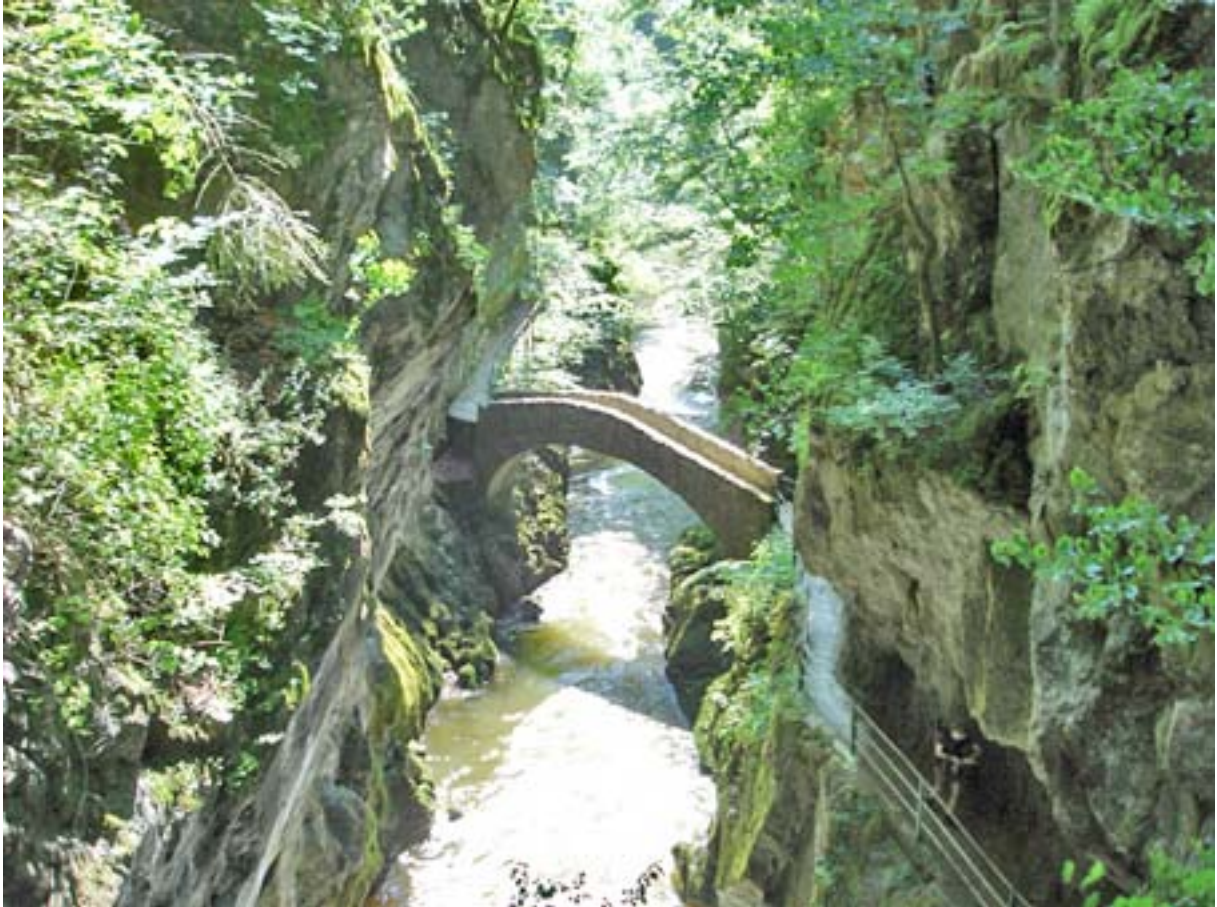
Von Boudry durch die Areuse-Schlucht nach Noiraigue und rund um den Creux du Van