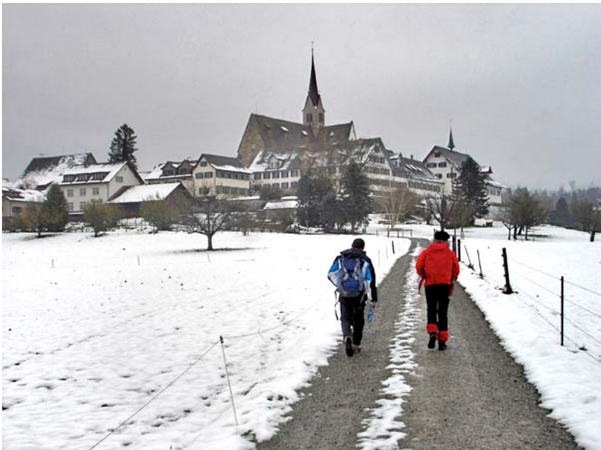
Winterwanderung auf der Top-Etappe des Ämtlerwegs