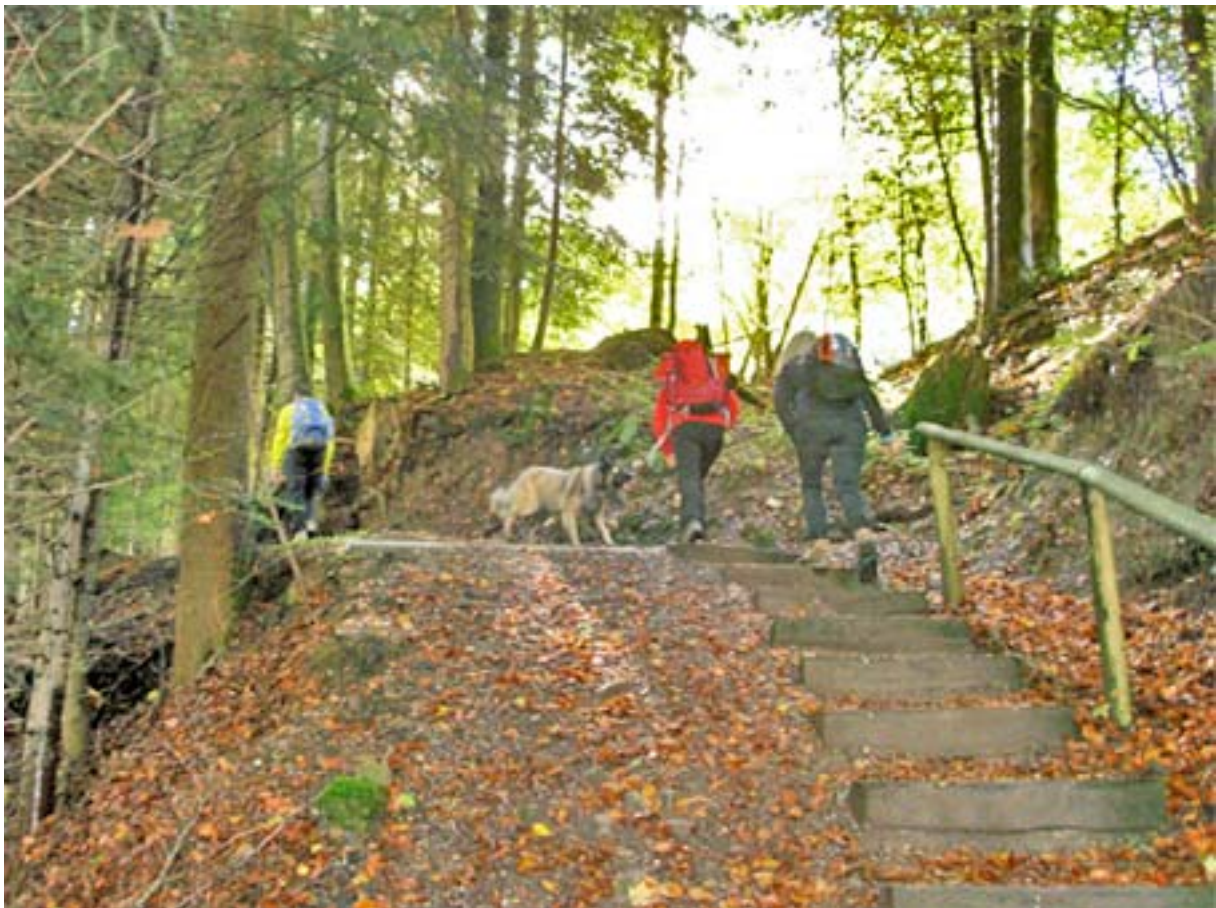
Von Wolhusen entlang den Wasserläufen der kleinen Emme und der Waldemme nach Flüfli