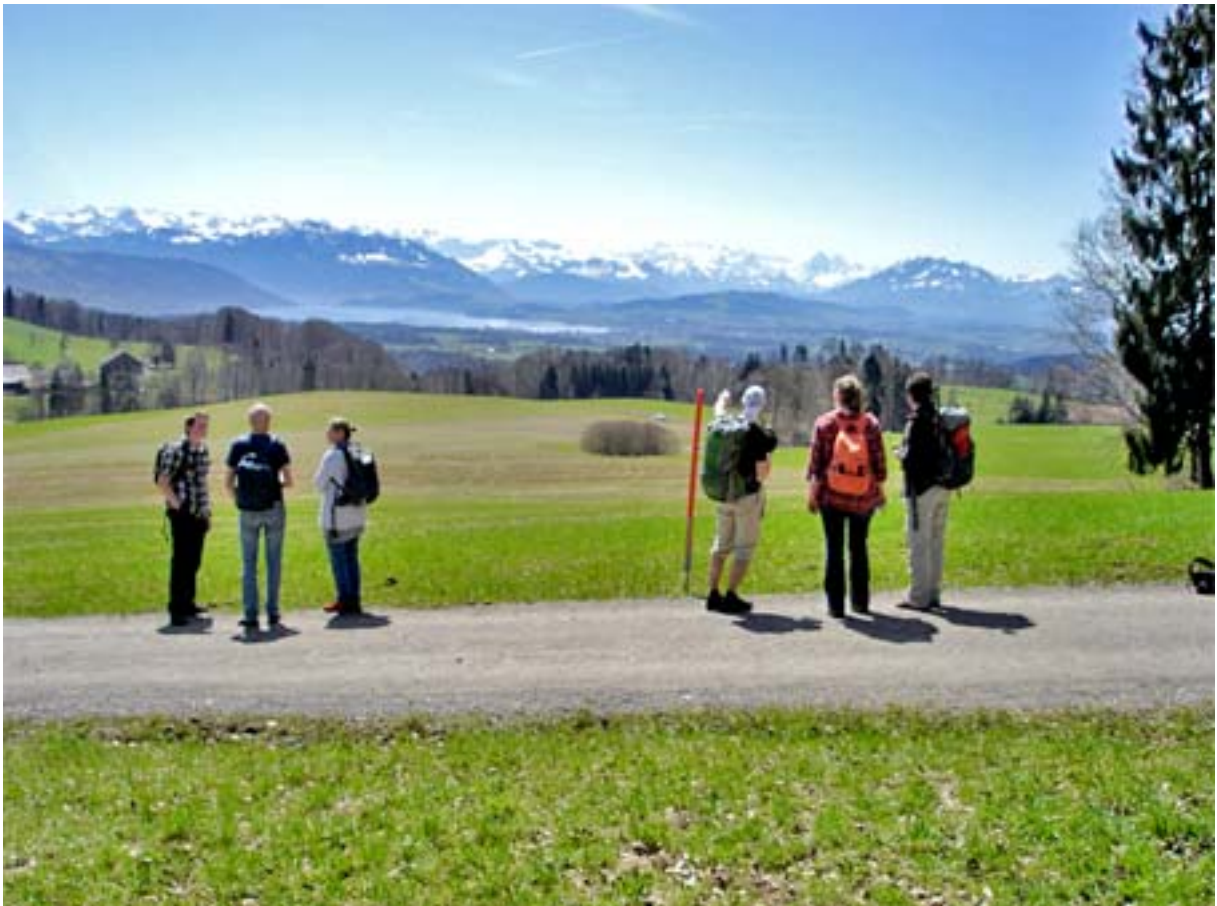
Frühlingswanderung auf der Albiskette