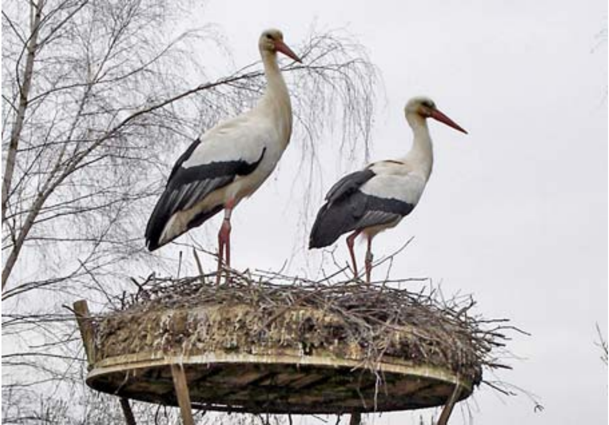
Vpn Weiach über den Stadlerberg nach Dielsdorf