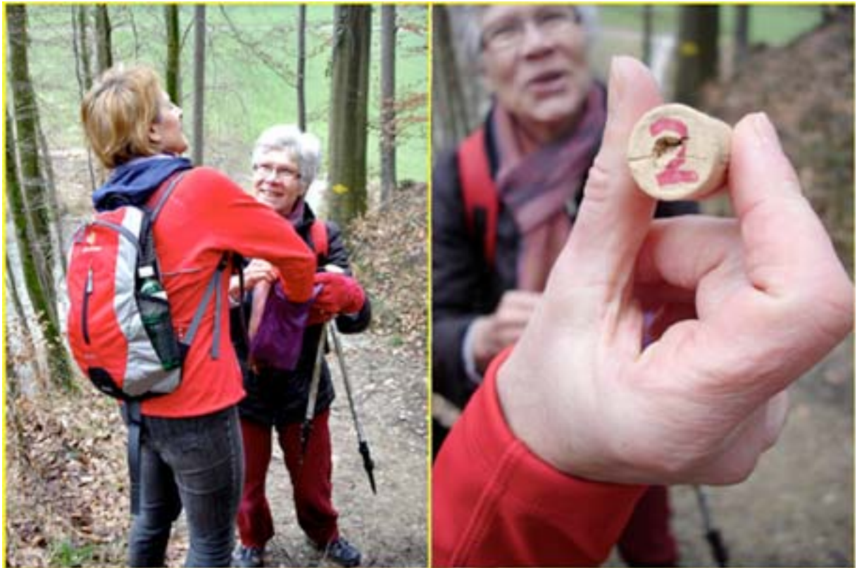
Los-gesteuerte Zufallswanderung von Dättlikon ins Blaue