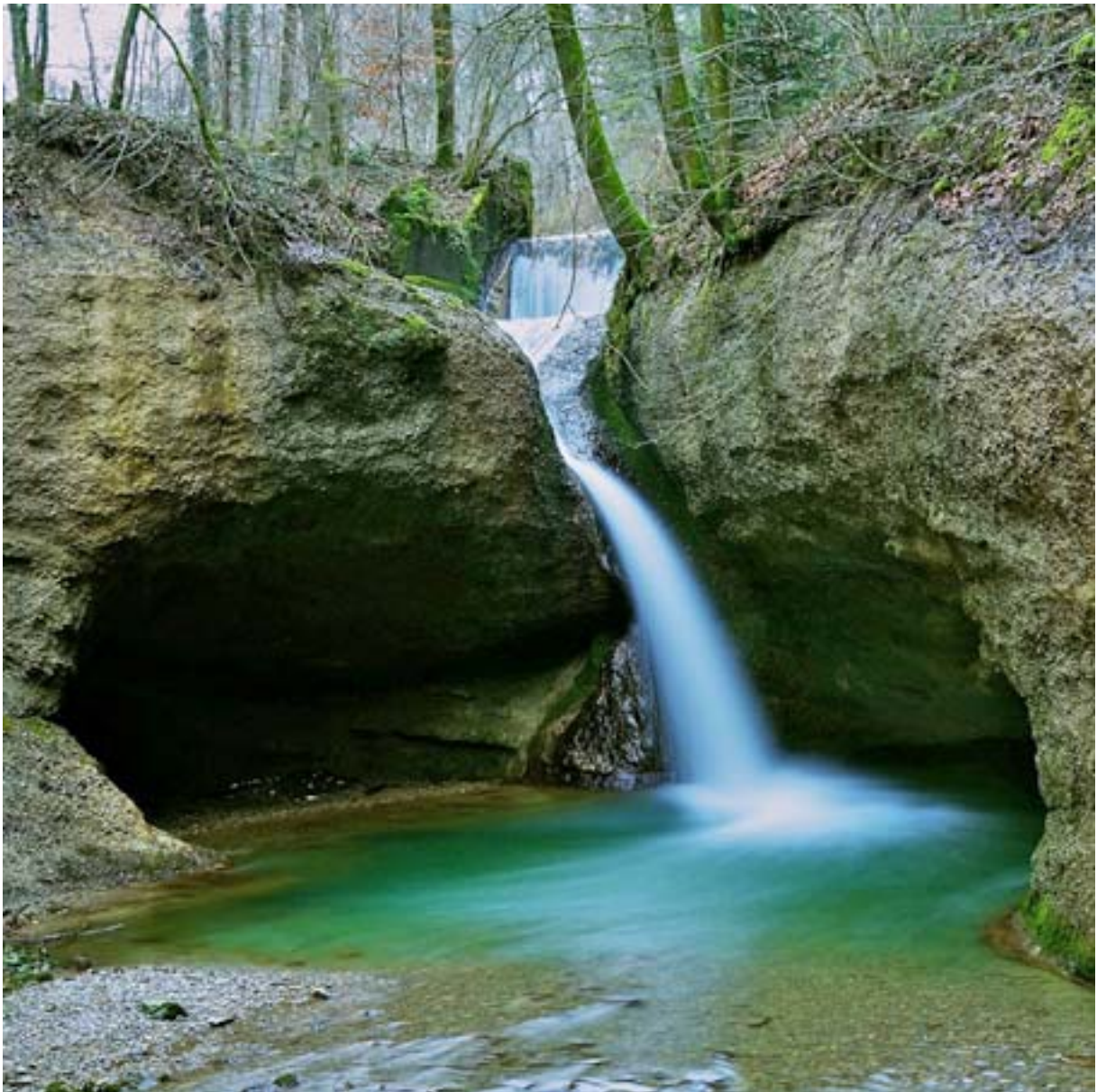
3-Tobel Wanderung im Zürcher Oberland