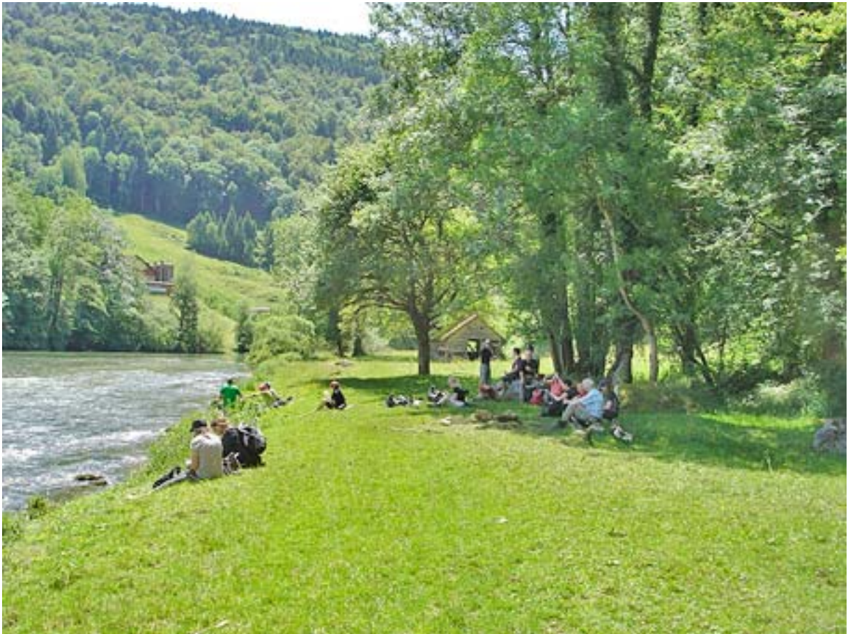
Von St. Ursanne auf den Clos du Doubs und auf dem Uferweg zurück