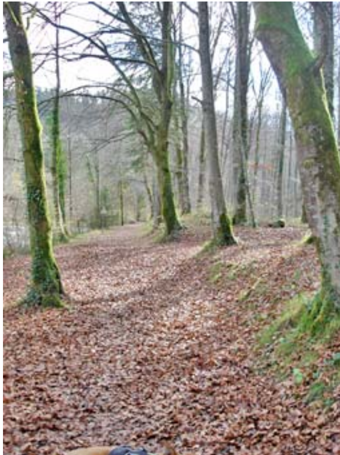
Herbstwanderung entlang dem Tössufer