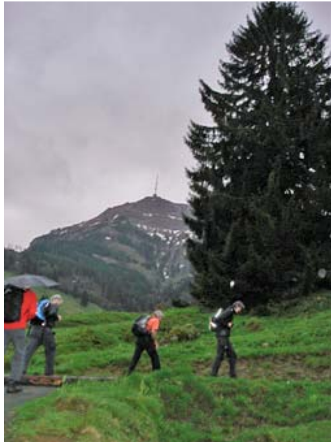
Rigimarsch von Bremgarten auf die Rigi Kulm: 50 km / 1500 Höhenmeter