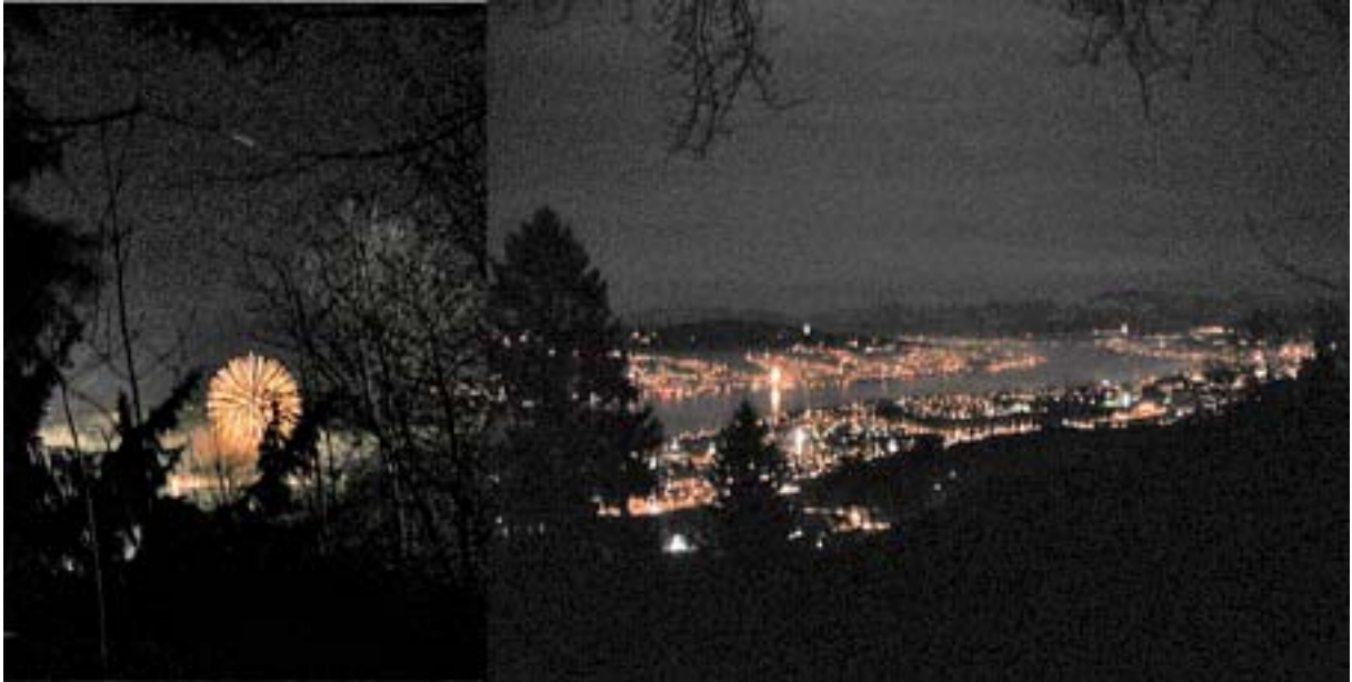
Nachtwanderung und Apéro auf dem Uetliberg