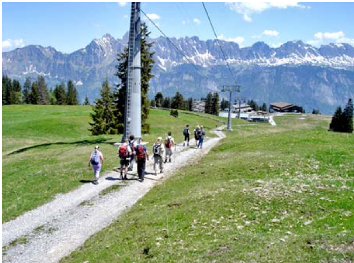
Von Oberterzen auf die Tannbodenalp mit anschließender Rundwanderung