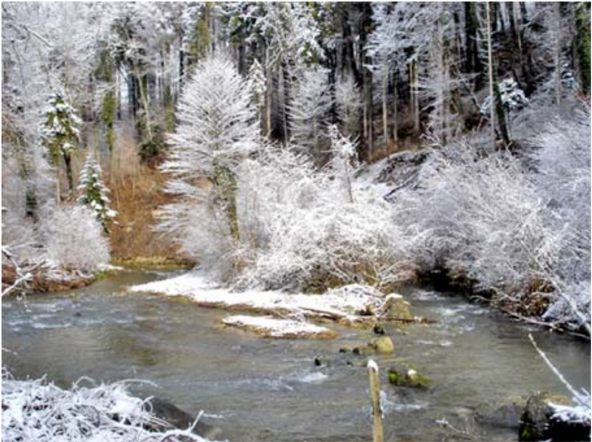
Wanderung zu Kulturstätten im Grenzgebiet der Kantone Aargau und Zürich