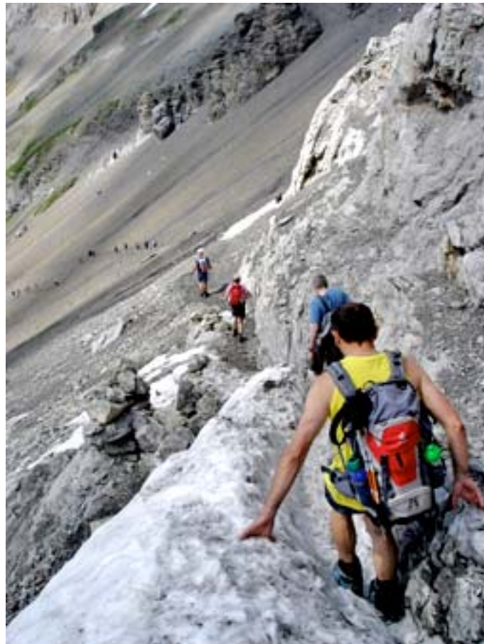
Höhenwanderung Griesalp — Hohtürli — Kandersteg