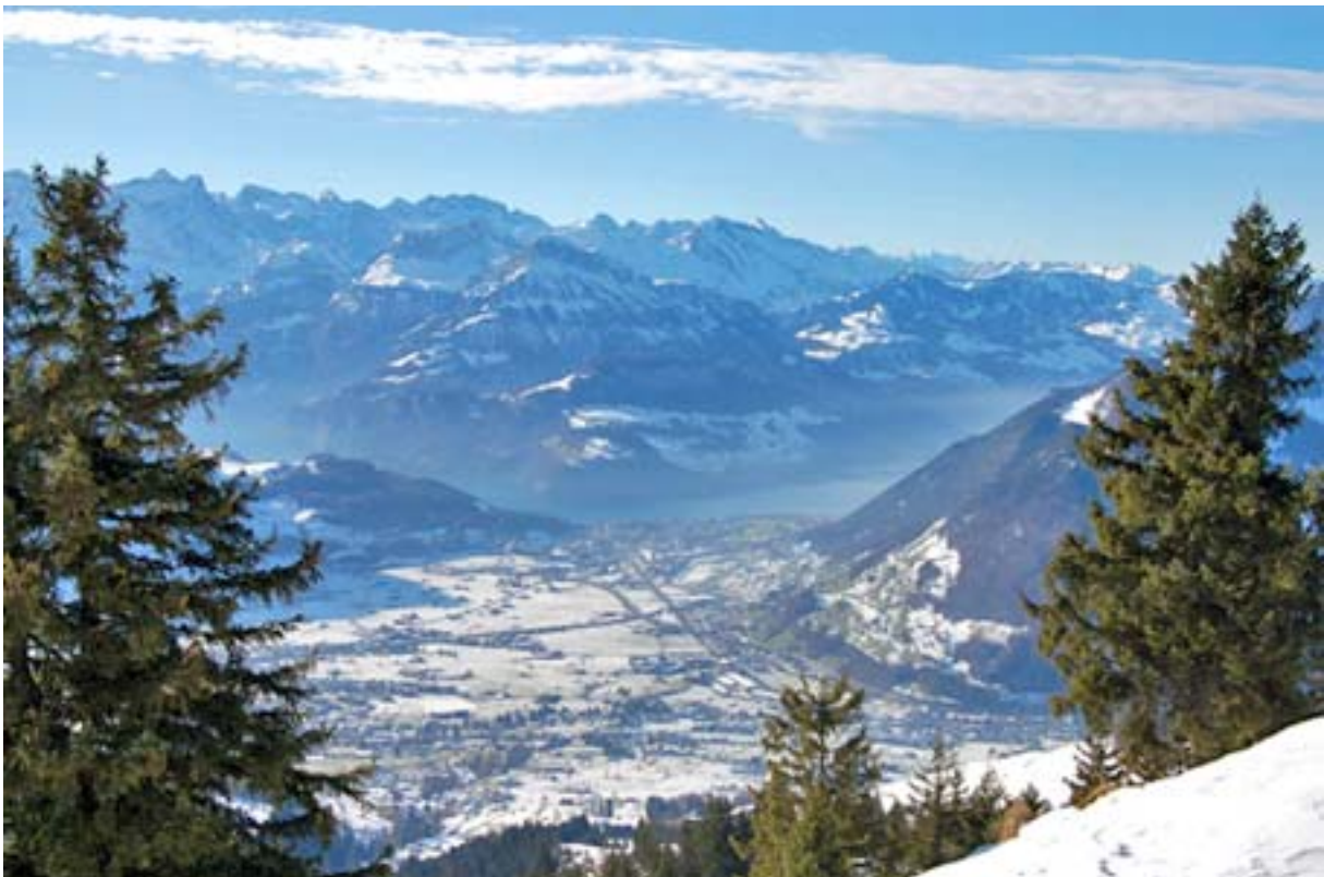
Schneeschuhwanderung Mostelberg – Nüsellstock – Rothenthurm