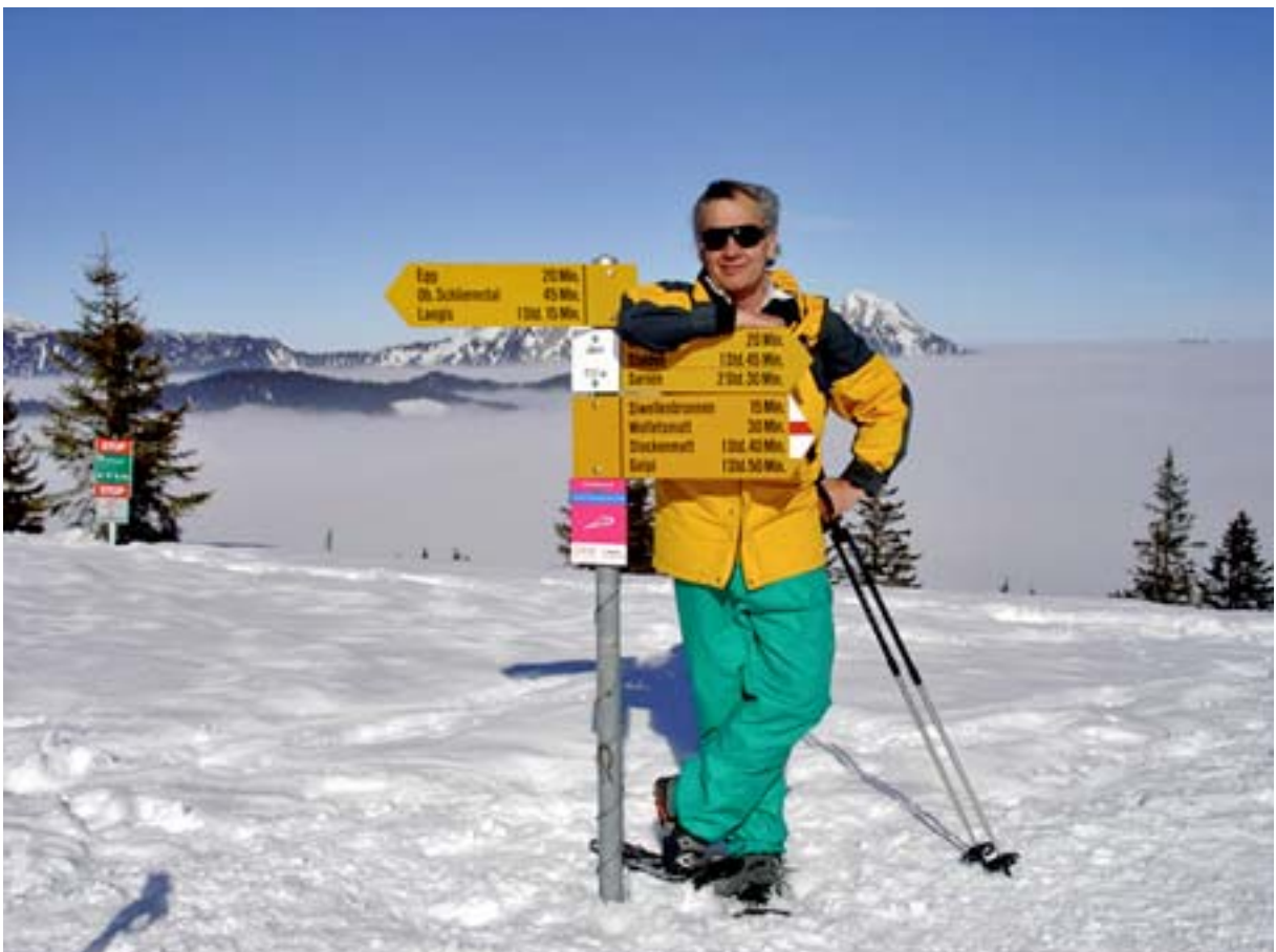
Über dem Nebelmeer auf dem Panorama-Trail Jänzi