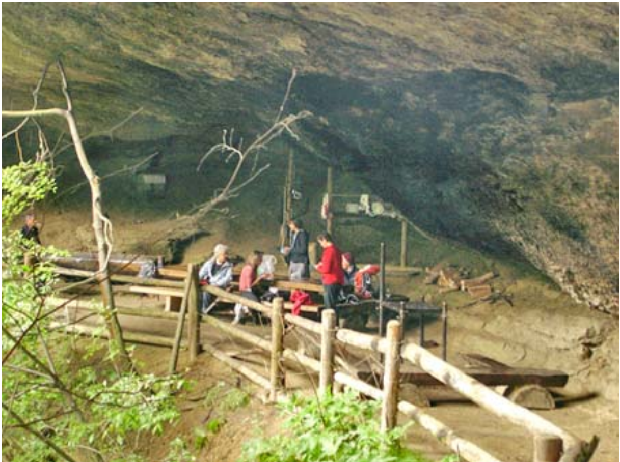
Von Wald via Brandenfels auf das Schnebelhorn nach Steg