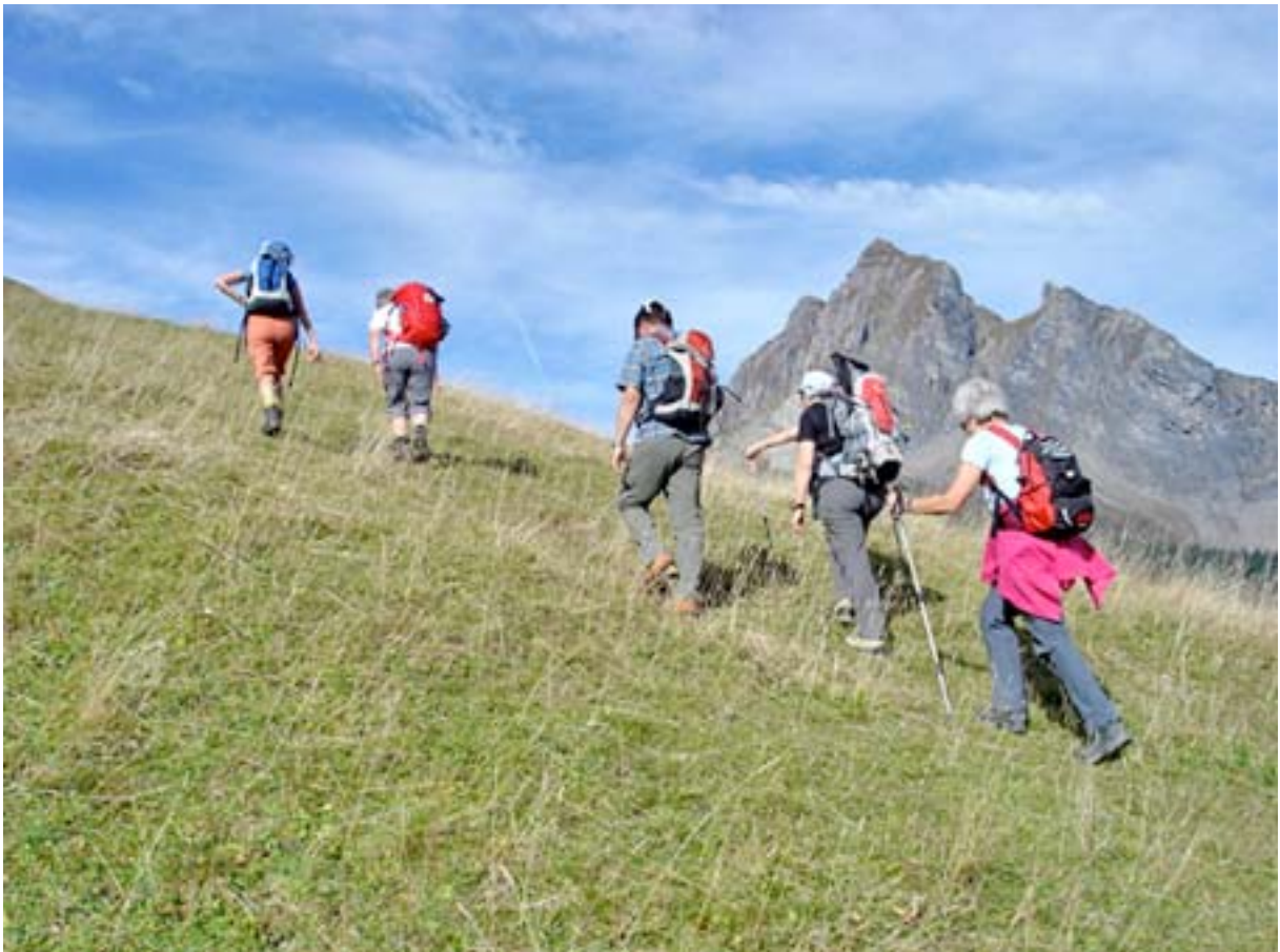
Bergwanderung Oberschan — Gonzen — Sargans