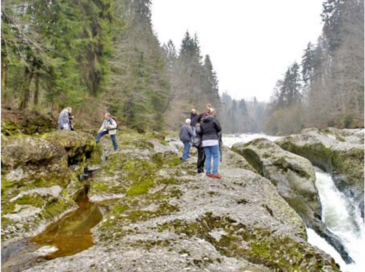
Im Chaloch der Entlebucher Biosphäre