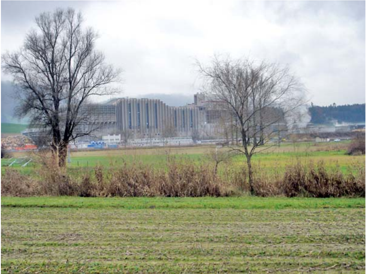
Sicht auf den mächtigen Neubau der Papierfabrik Perlen

Zwischendurch wird der Blick frei auf die weitere Umgebung: