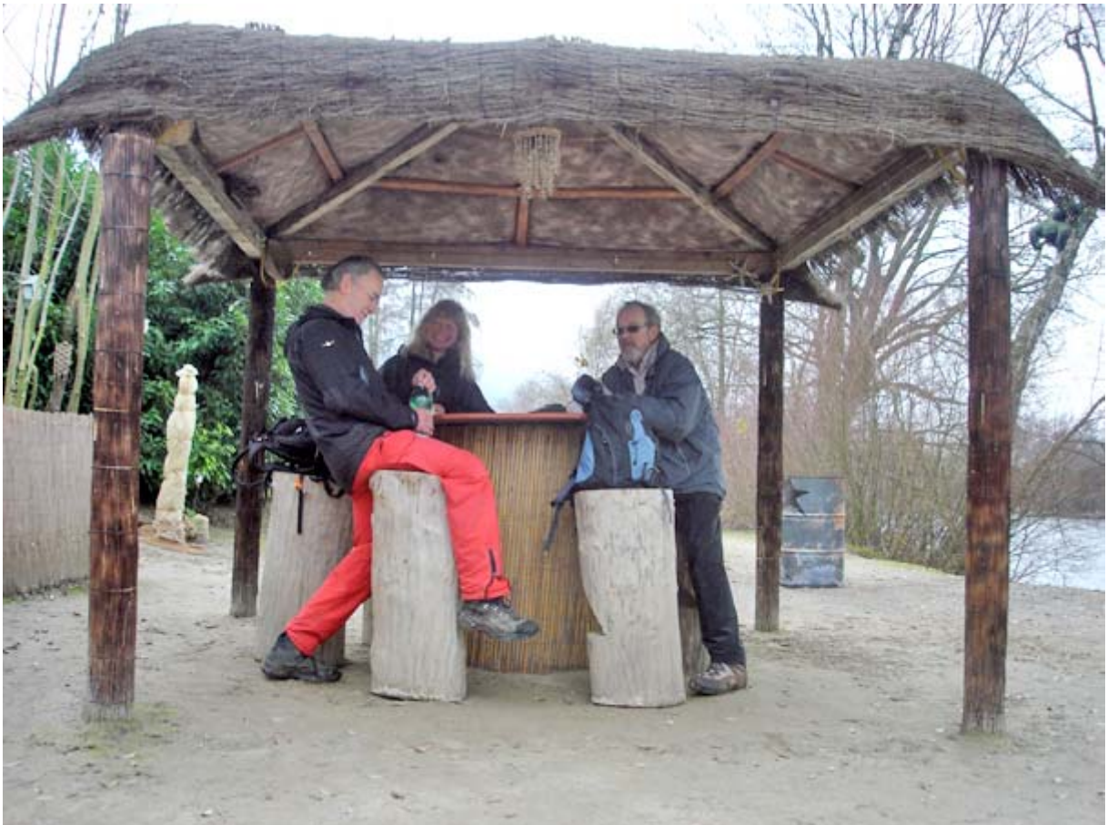
Stelldichein an der Reuss-Bar mit stimmigen Ambiente

Auf der Höhe Buchrain finden wir „den“ idealen Platz für unsere Mittagsrast: