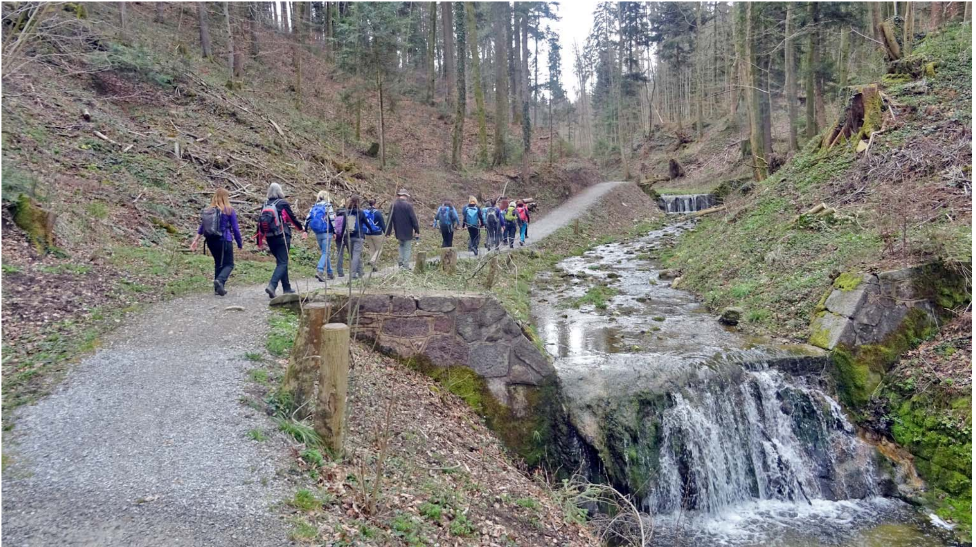
Entspanntes Frühlingswandern entlang dem fließenden Wasser

Im oberen Teil des Tobels wird der Steigungswinkel nach und nach flacher: