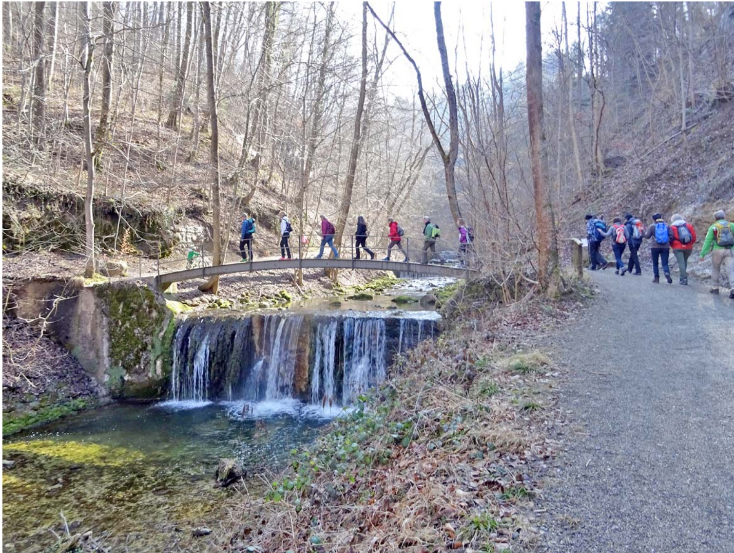
Der Ufer-Wechsel über eine der eleganten Bogenbrücken

Das Küsnachter Tobel bietet eine Vielzahl von Brücken unterschiedlichster Bauart: