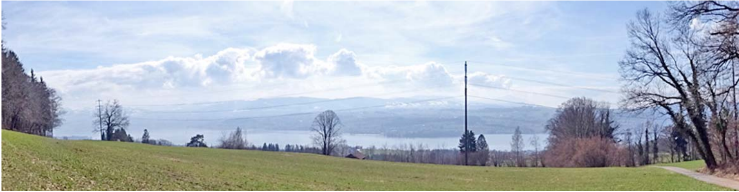
Blick auf den Zürichsee auf dem Abstieg vom Pfannenstiel