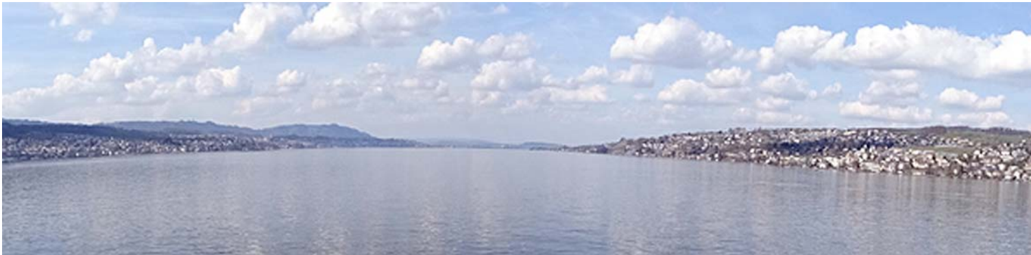
Blick gegen Norden bei der Fähren-Überfahrt Meilen - Horgen