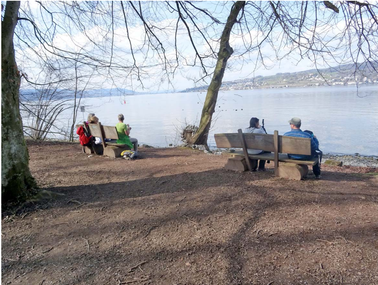
Eine verdiente Ruhe- und Verpflegungspause mit grandioser Zürichsee-Kulisse

Wir umrunden die Halbinsel Au und mach an deren Ostufer das, was hier viele tun: