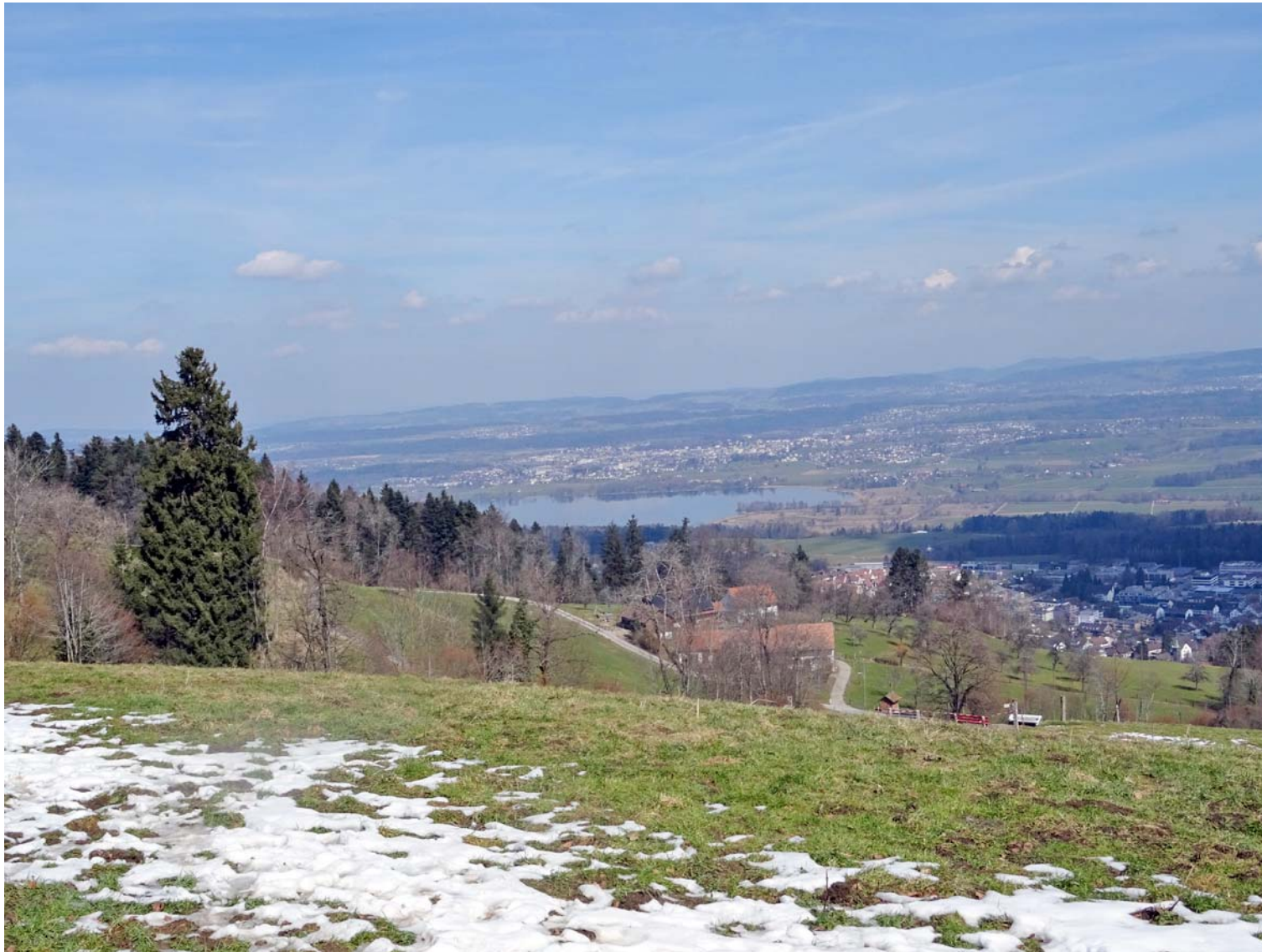
Das Südende des nahen Greifensees, dahinter die Stadt Uster

Hier doch noch ein Tiefblick von der Hochwacht: