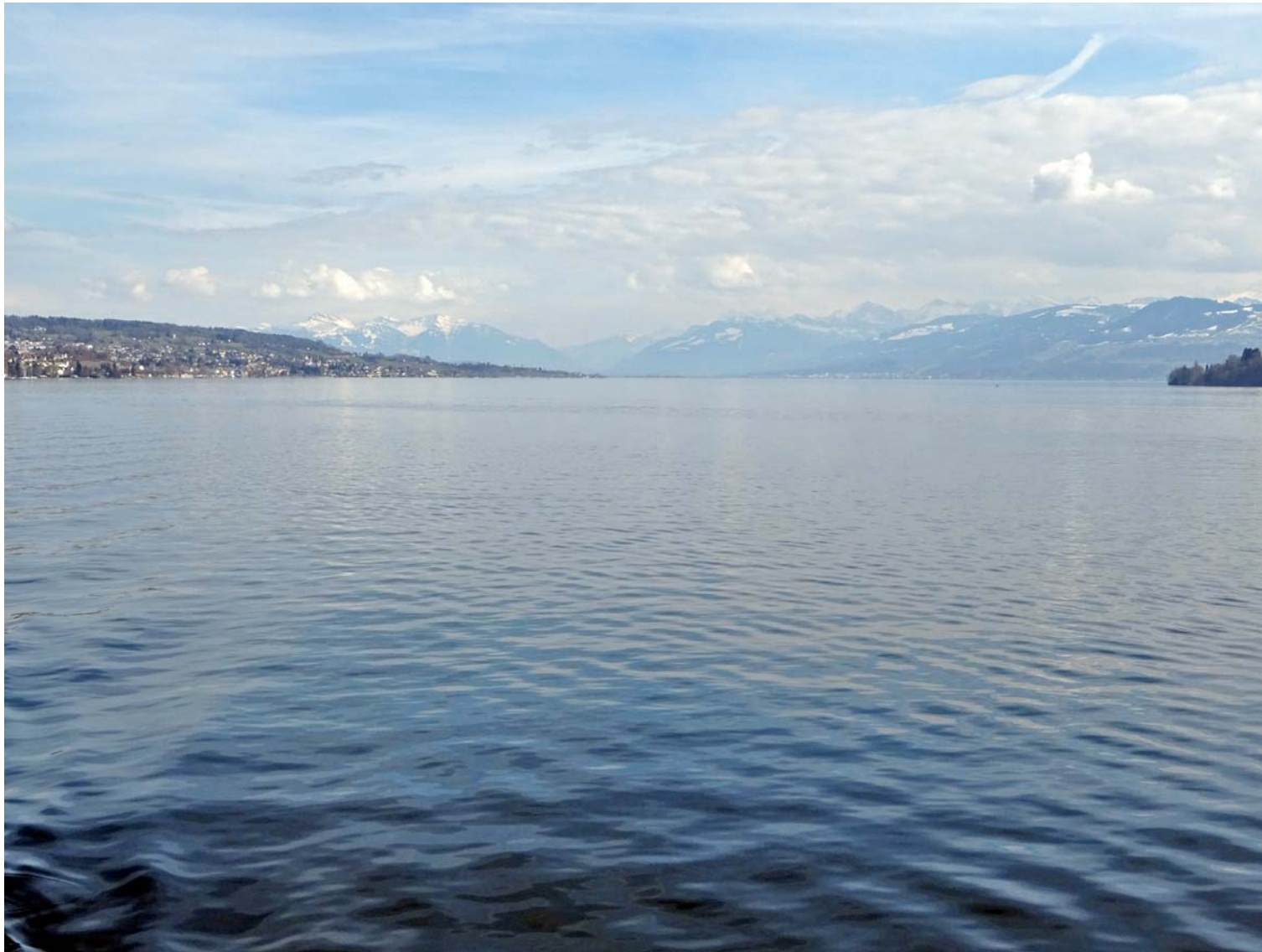
Blick von der Fähre nach Süden: Links aussen der Speer und der Federispitz

In Meilen nehmen wir die Autofähre für die Überfahrt nach Horgen: