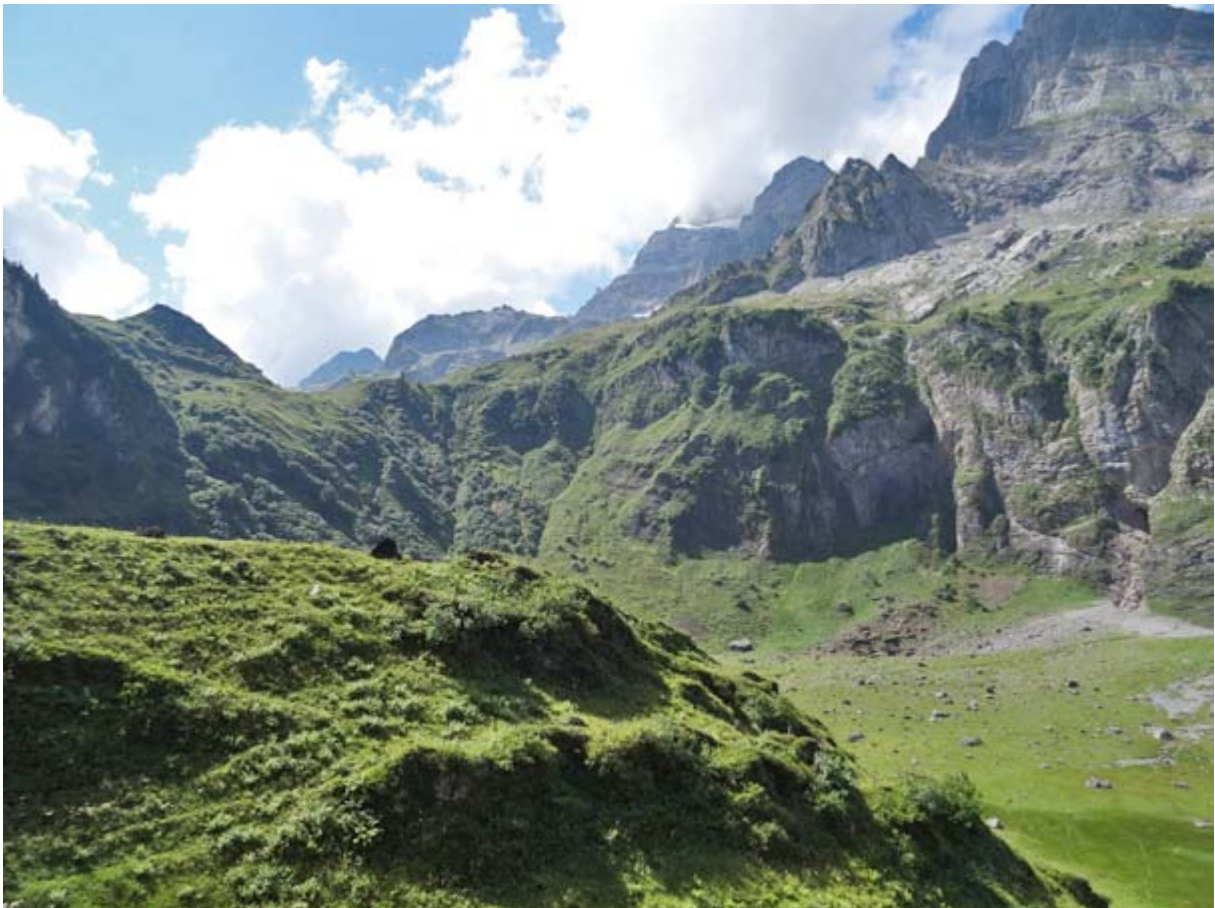
...in Richtung des ausgetrockneten Guppensees (unten) abgestiegen sind