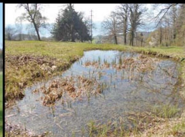
Lausiges Biotop oberhalb von Toggwil