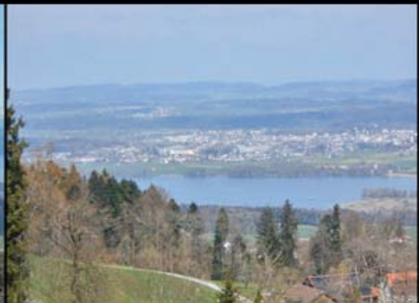
Blick 2 vom Hochwacht-Turm: Greifensee