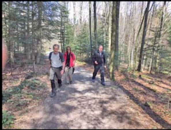
Lustvolles Wandern durch lichte Mischwälder