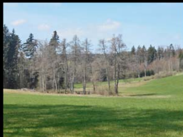
Waldlichtung unterhalb der Hochwacht mit Jura-Touch