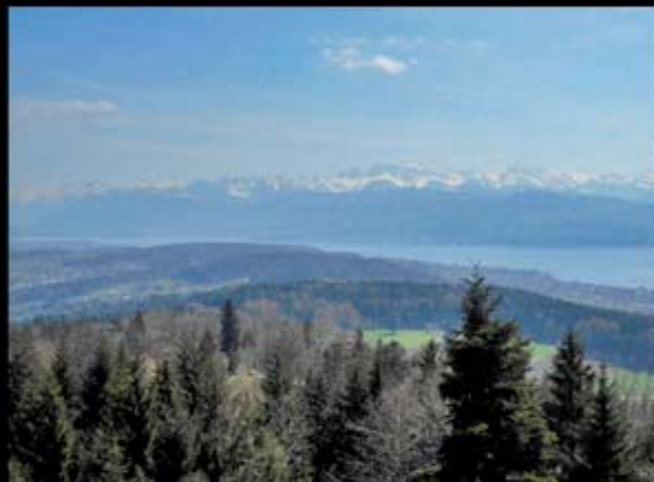
Blick 1 vom Hochwacht-Turm: Südlicher Zürichsee