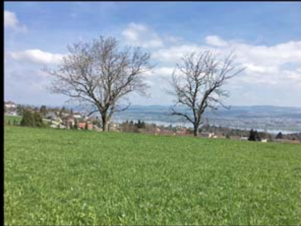
Geifensee, vom Wassberg aus gesehen