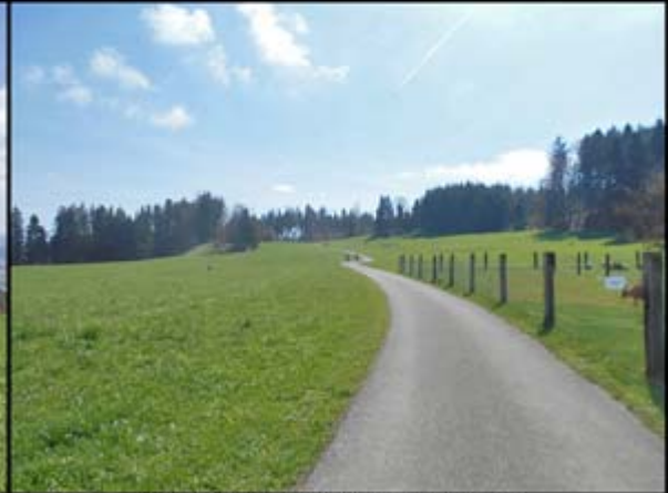
Waldlichtung Vorderer Guldenen