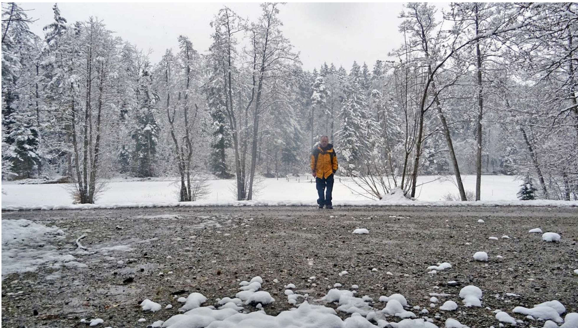
Zum Schluss dieser Bild-Serie noch ein gelber Farb-Tupfen ;-)