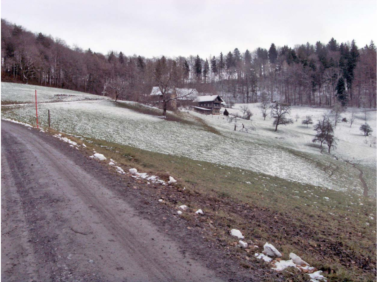
Schon fast oben: Passage durch die Lichtung Fohlenweid

In Sellenbüren erreiche ich die Silvester-Route und steige via die Bleiki zum Albis-Gratweg hoch: