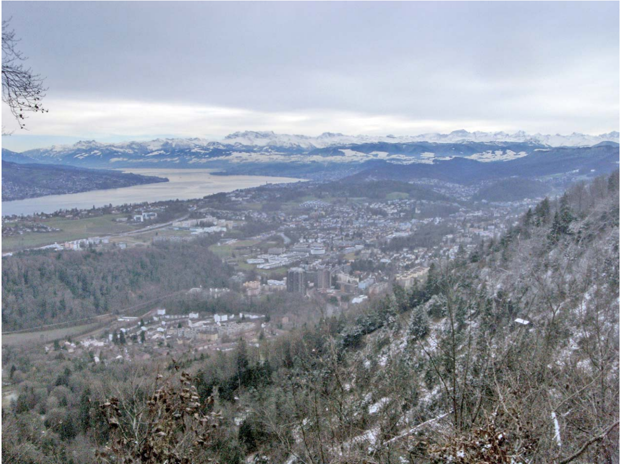
Der obere Zürichsee mit den Glarner Alpen

Oben auf der Fallätschen ein toller Weitblick: