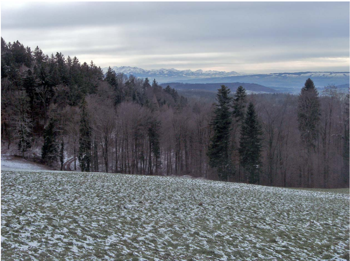
Durchblick von der Fohlenweid auf die Innerschweizer Alpen