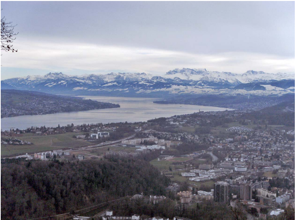
Rechts der Bildmitte das Glärnisch-Massiv