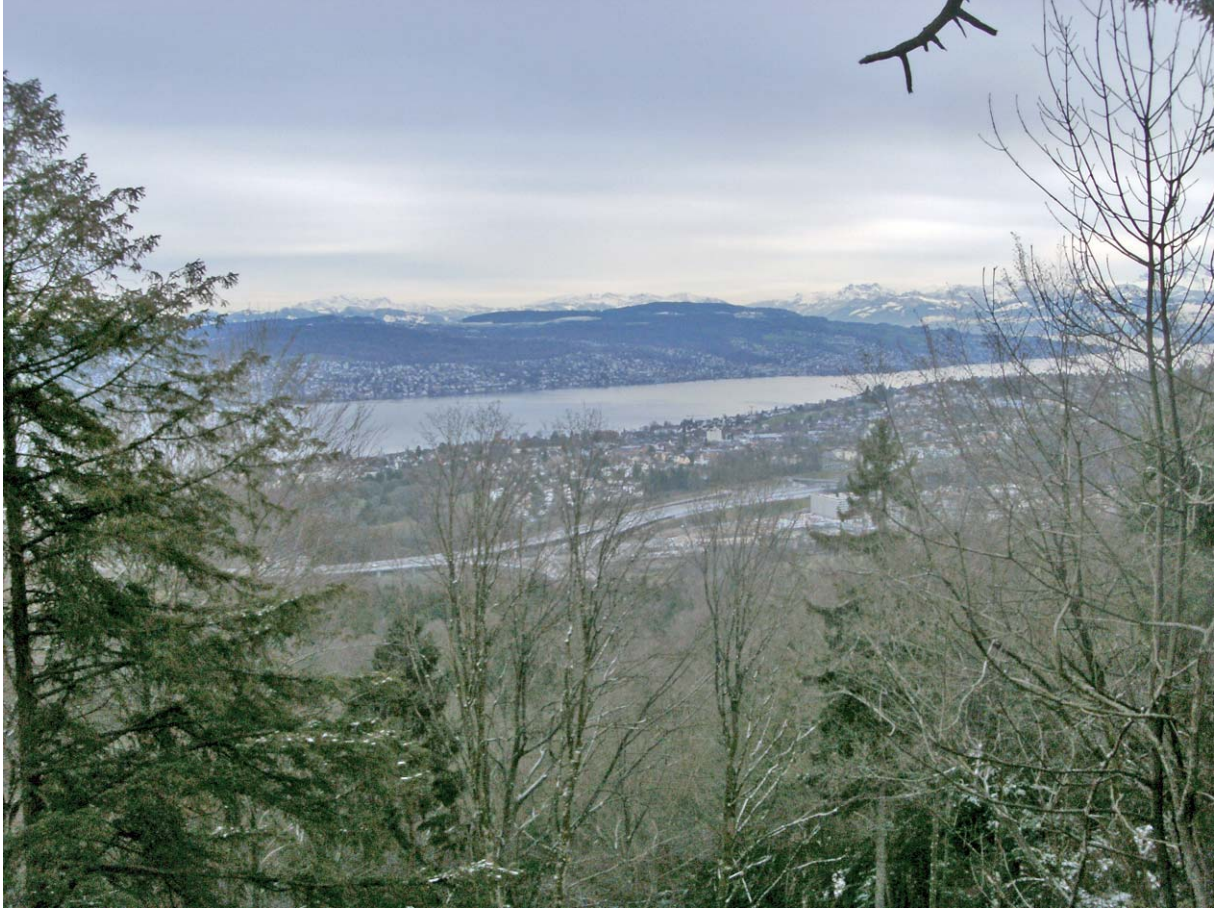
Aussichtspunkt mit Blick auf den Säntis

Etwas weiter unten, jedoch ohne direkte Sicht auf das nördliche Seebecken: