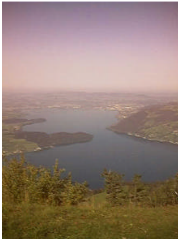
Zugersee von oben