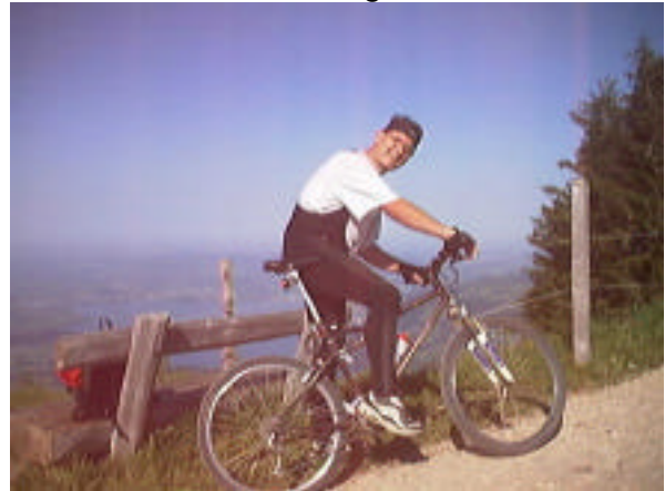
Müder Biker kurz vor dem Ziel