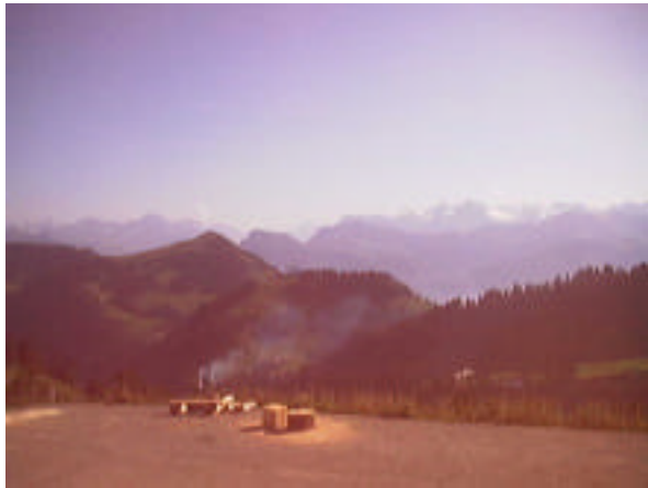
Blick Richtung Süden