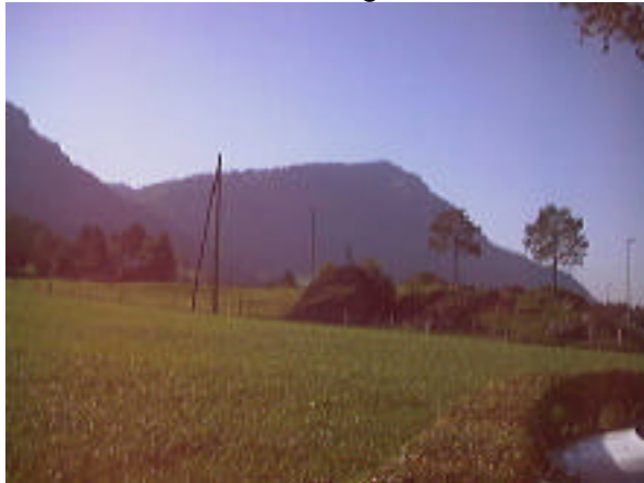
Das Ziel aus Sicht Bernerhöhe