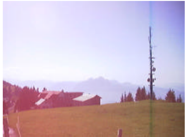
Blick Richtung Westen