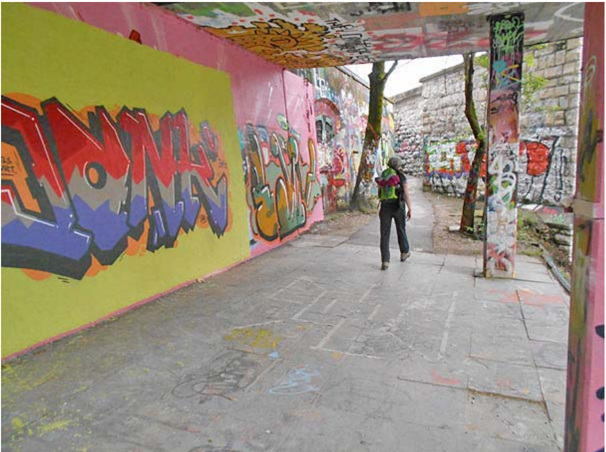
Hier eine Passage unter und bei der Kornbrücke

Auch die Schluss-Etappe durch den trendigen Stadtkreis 5 wird uns in Erinnerung bleiben: