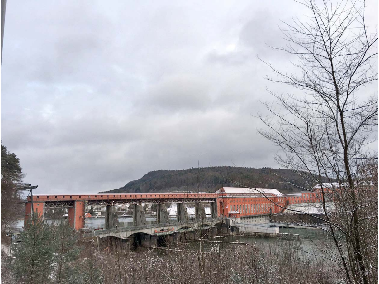
Das EW Eglisau, über das der Bahnhof Zweidlen verlockend nahe wäre

Auf halber Strecke zwischen Eglisau und Kaiserstuhl ein weiteres imposantes Bauwerk: