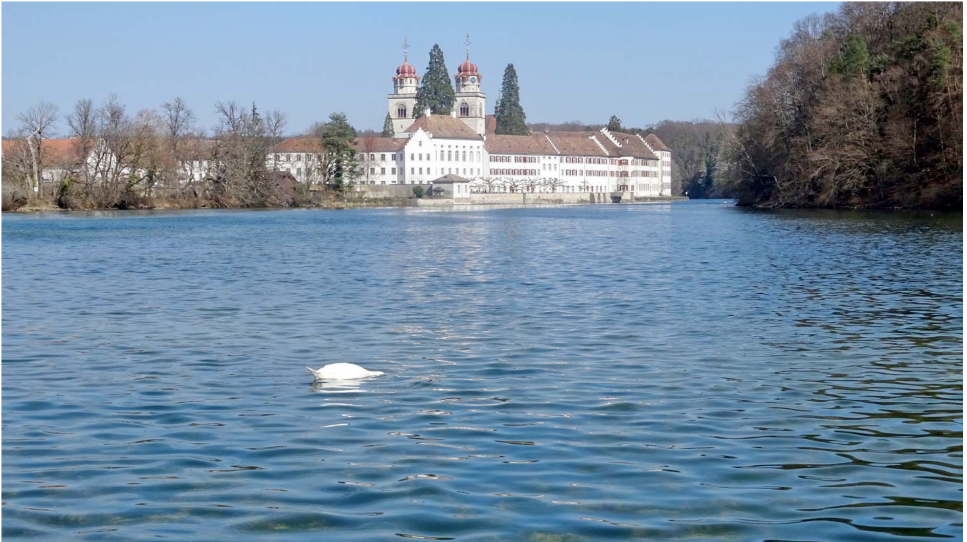
Die Kloster-Anlage Rheinau zeigt sich von ihrer fotogensten Seite

Kurz vor Rheinau wechsle ich über den Wehr-Steg ans linke Rheinufer und bin damit wieder in der Schweiz: