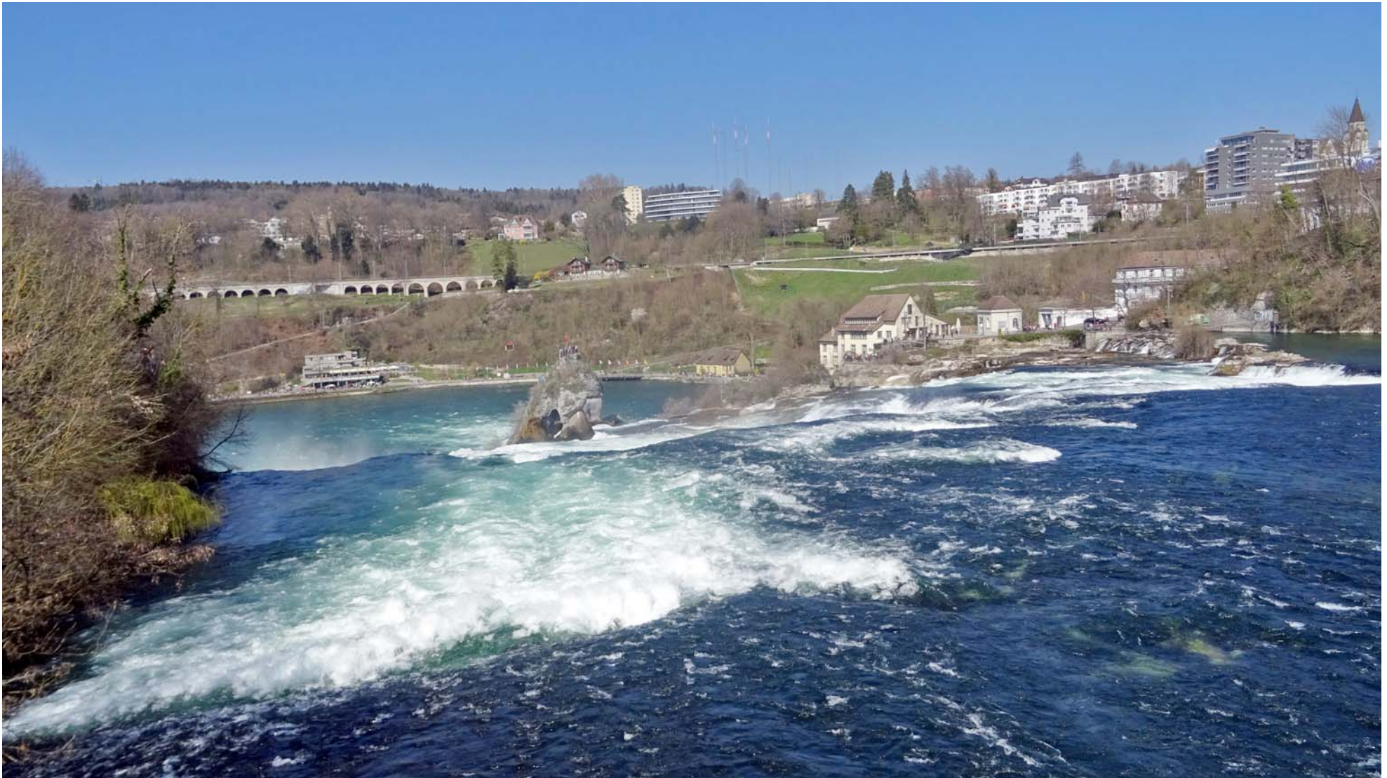
Der Rheinfall von oben gesehen

Vom Bahnhof Schloss Laufen nutze ich den Fussgänger-Steg, der mich nach Neuhausen am rechten Rheinufer führt: