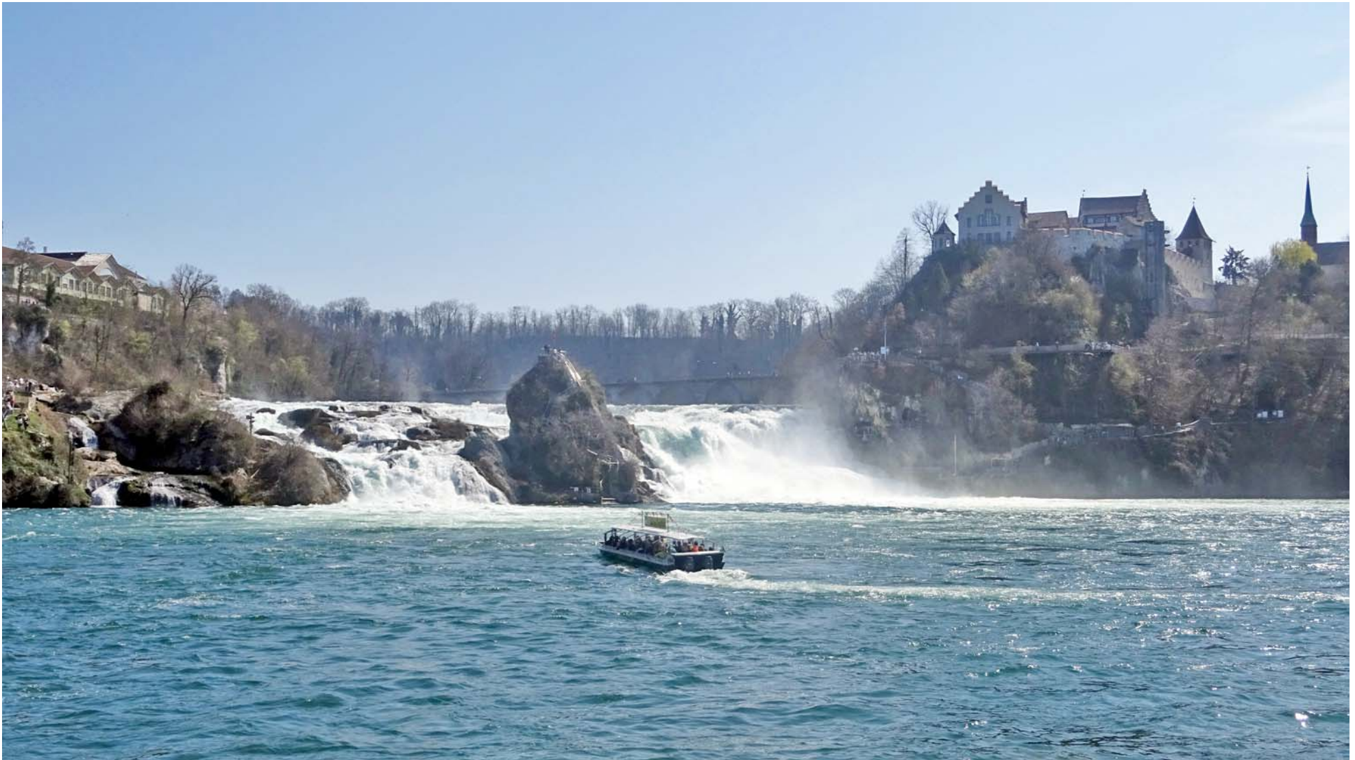
Mein „Postkarten-Schweiz“-Bild vom Rheinfall

Und dieses Bild darf natürlich nicht fehlen: