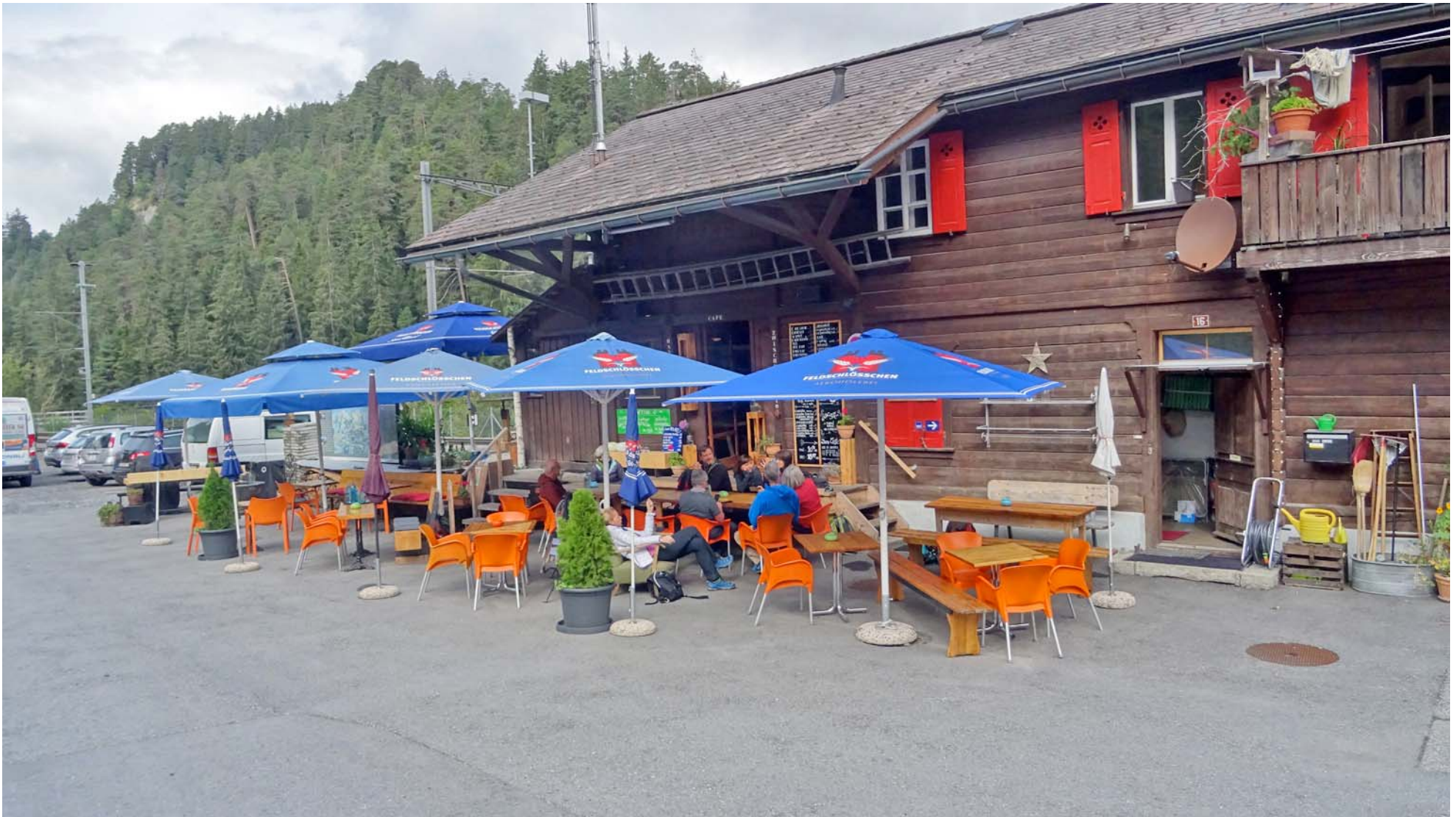
Start-Kaffee im Bahnhof-Bistro

Der Bahnhof Valendas wird nicht mehr bedient, ankommende Reisende jedoch schon ;-)