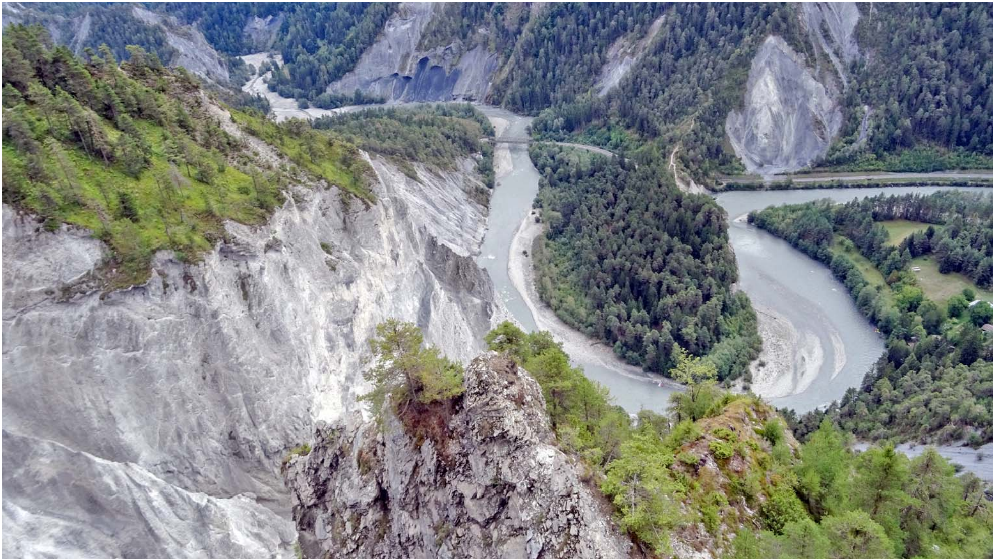
Die vorher beschriebene Halbinsel, in der Bildmitte oben die vor einer Stunde überquerte RHB-Brücke

Aus der Ausblick von der Plattform ist unbeschreiblich schön: Selbst hingehen und versuchen, Worte zu finden ;-)