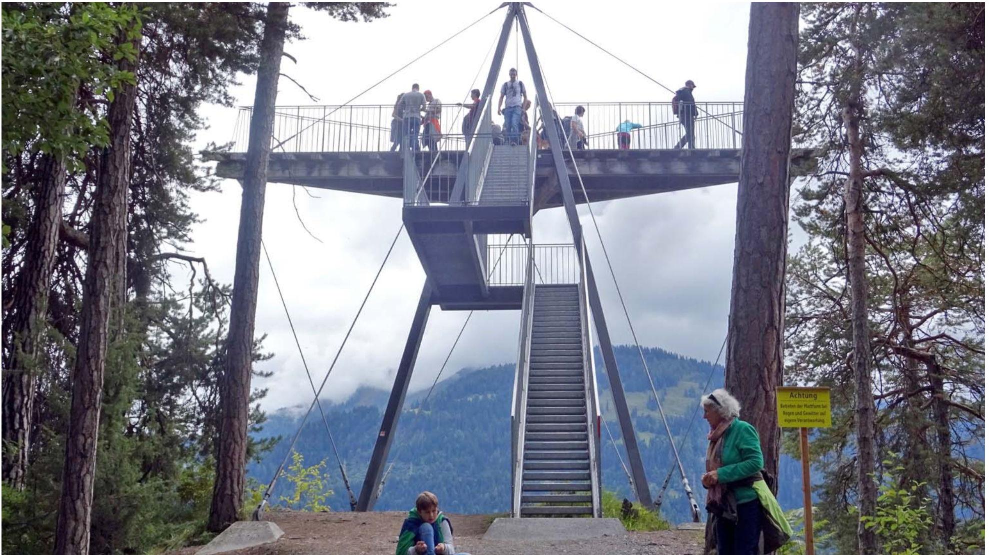
Die optimal gelegene Aussichts-Plattform Conn mit ihrem futuristischen Design

Nach einem happigen und Schweiß-treibenden Aufstieg erreichen wir die nächste Menschen-gemachte Attraktion: