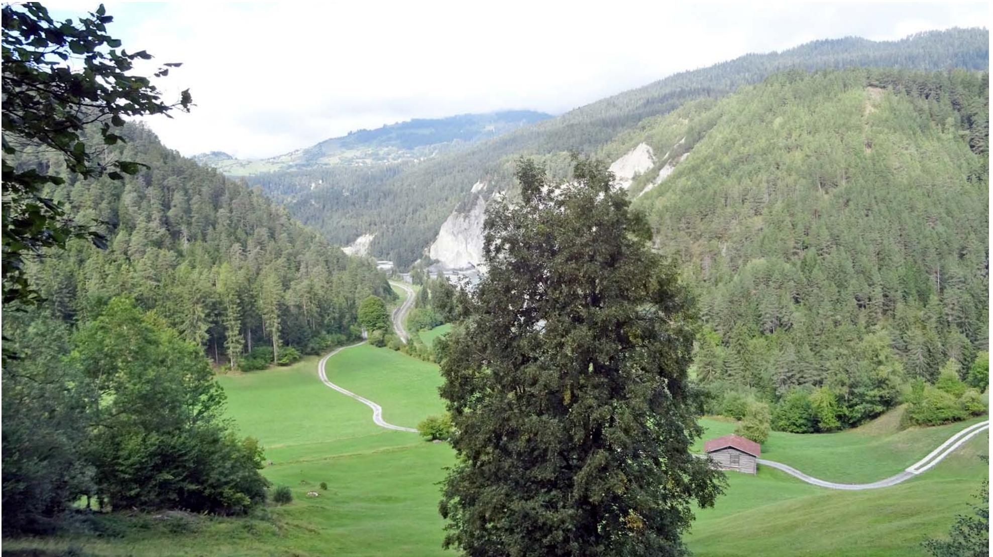
Tiefblick auf die Isla

Die einzige Grünfläche zwischen den Stationen Valendas und Versam wird auf einem kleinen Höhenweg umgangen: