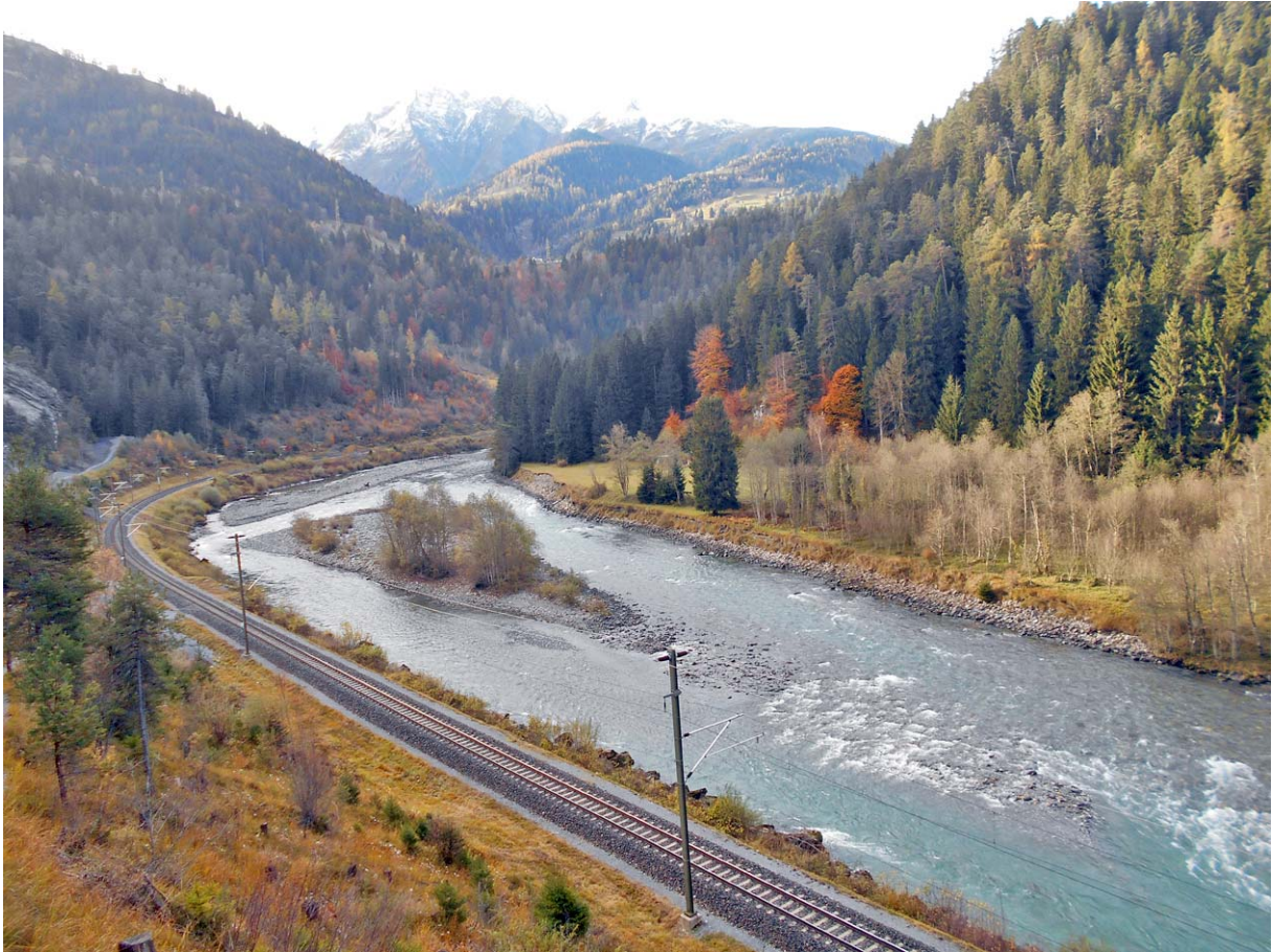
Indian Summer am Vorderrhein