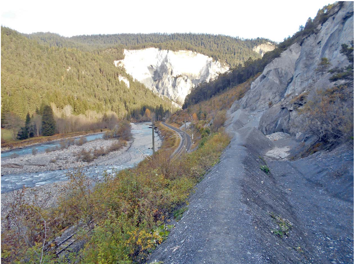
...mit spannenden optischen Impressionen