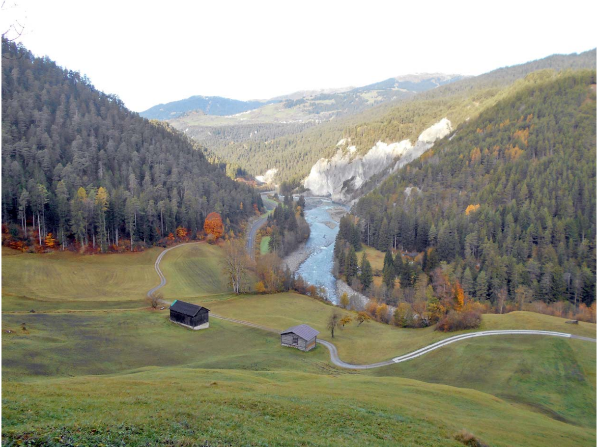
Rückblick in südlicher Richtung

Die „Wald-Insel“ Isla wird grossräumig inkl. ca. 100 Höhenmeter rechts umgangen: