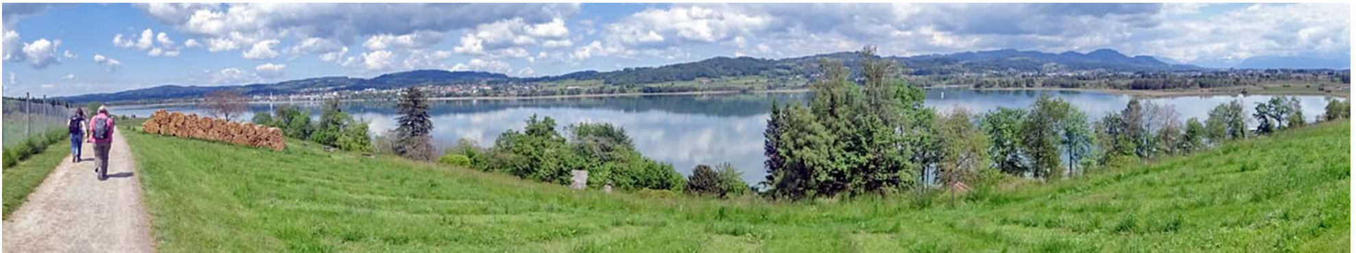
Panorama von der Jucker Farm: