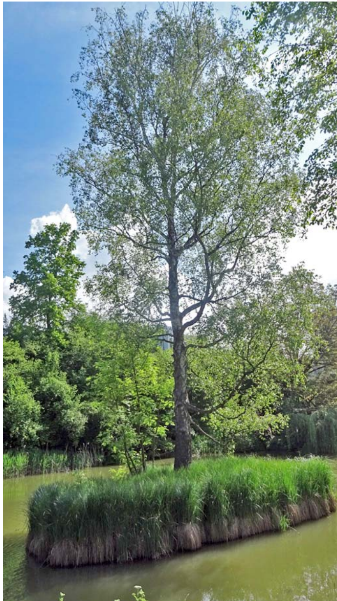
Das zweit-schönste Baum-Inseli der Schweiz ;-)