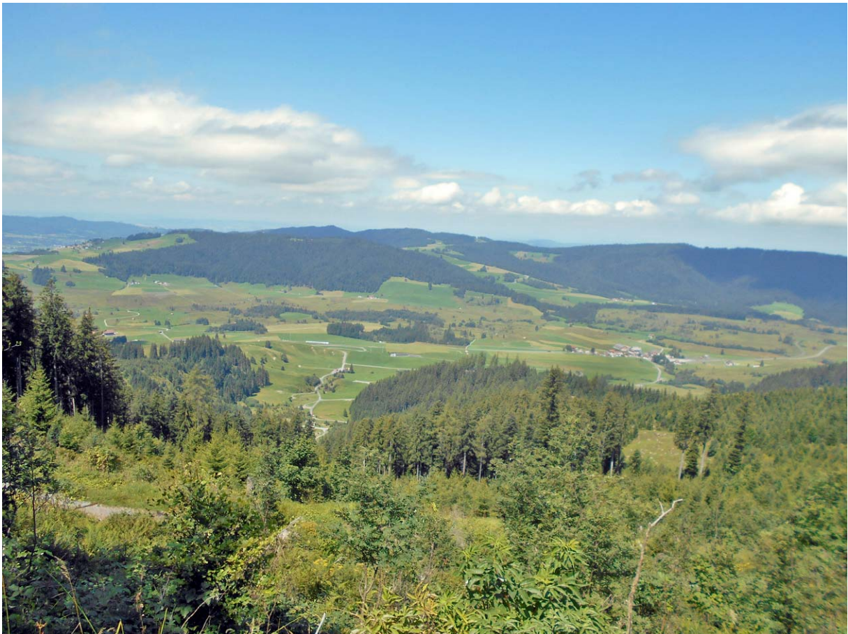
In der Bildmitte rechts die Altmatt 3, über welche später zum Bibersteg wandern werden

Im Westen zeigt sich das Rothenthurmer Hochmoor in fast voller Grösse: