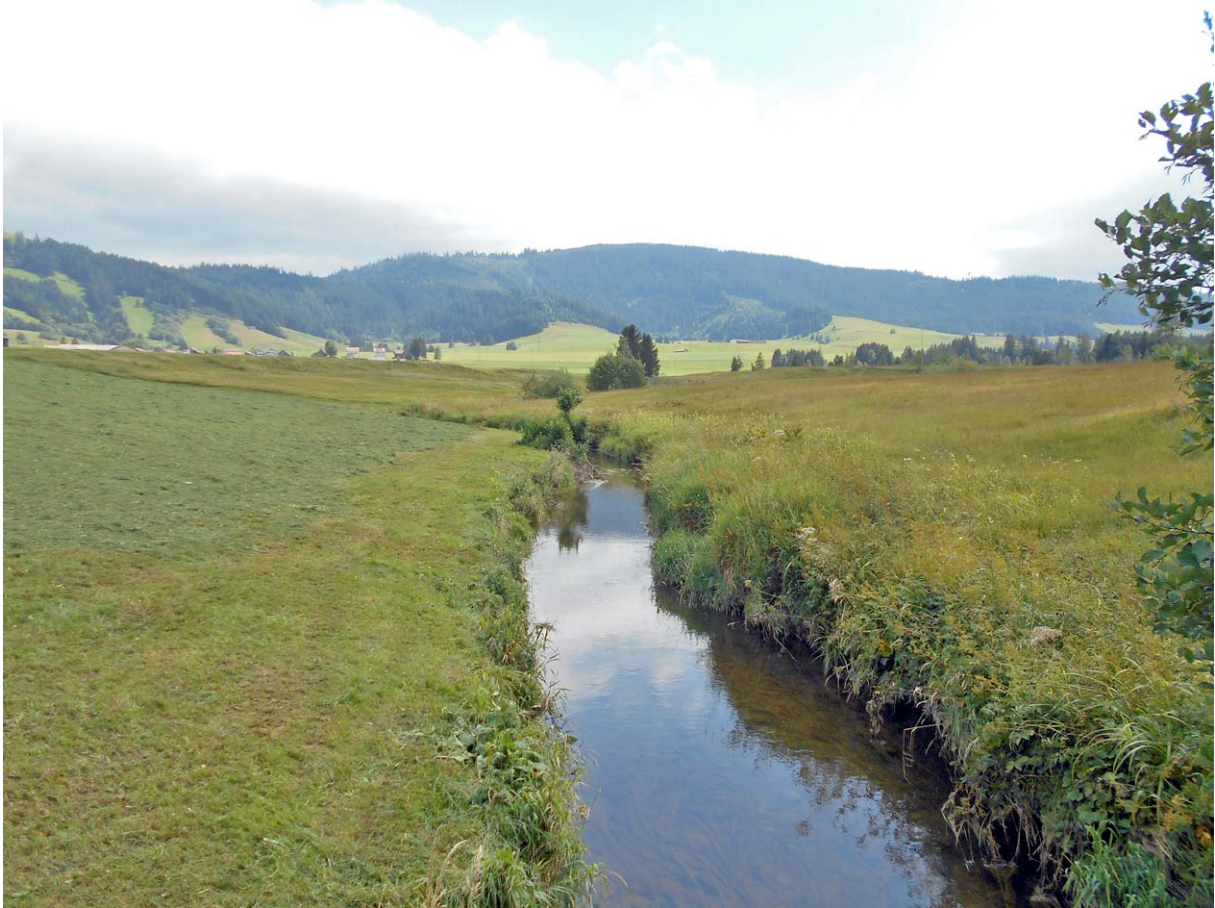
Blick vom Steg auf das ruhige Gewässer der Biber