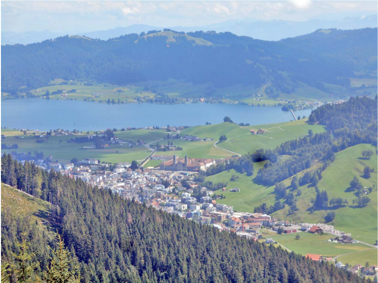
Das Klosterdorf mit dem Sihlsee

Kurz nach der Samstageren wird gegen Südosten der Blick auf Einsiedeln frei: