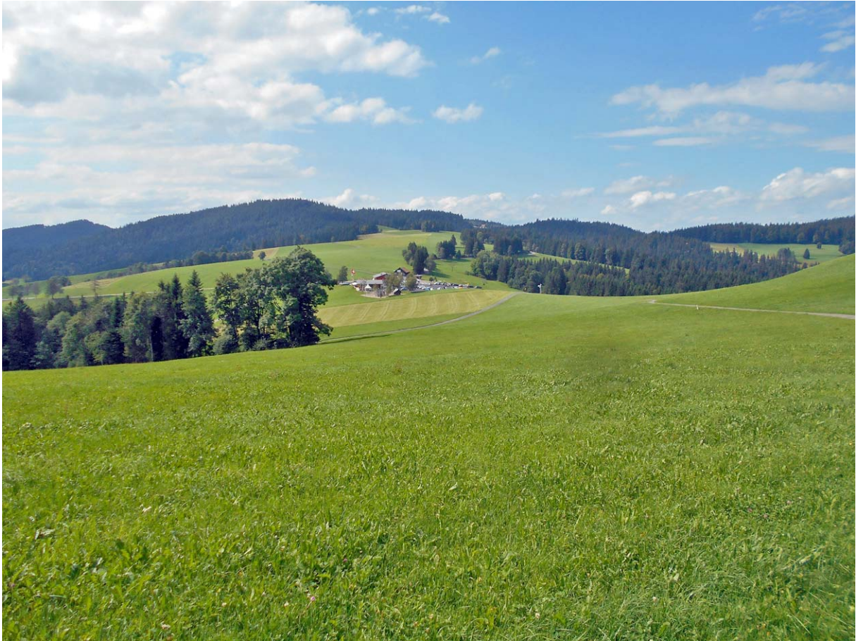
Die Raten-Passhöhe, dahinter der Gottschalkenberg.

Mit einer Punkt-Landung erreichen wir um 17:25 Uhr unser finales Wanderziel: