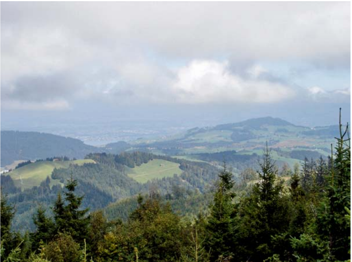
Im Norden der Etzel, links davon „etwas Zürichsee“...