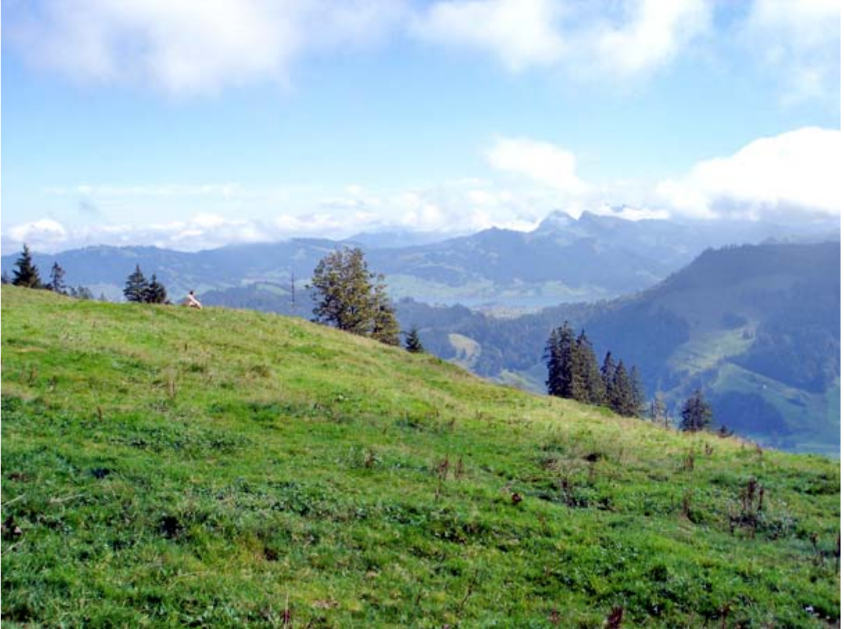
Im Osten über das Alptal ein Stück Sihlsee und die Glarner Alpen