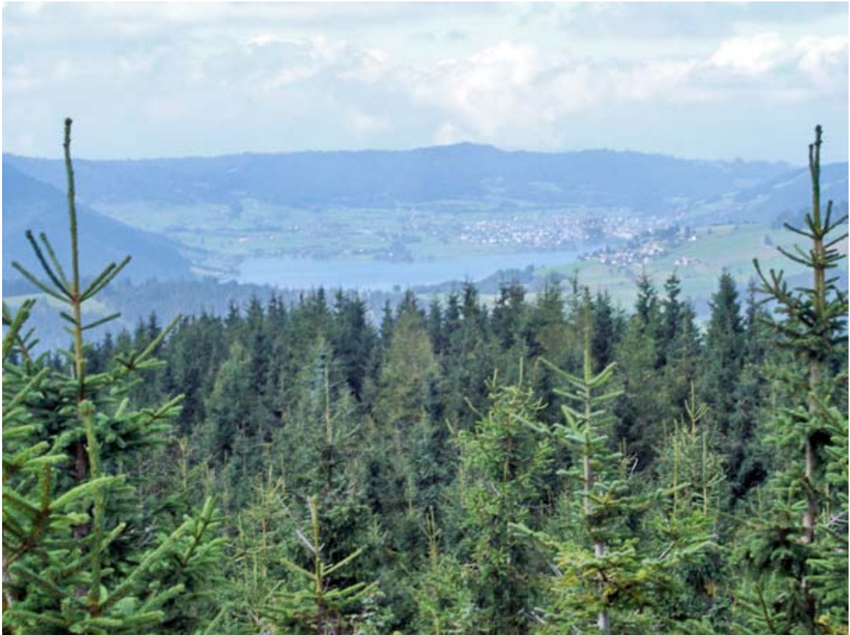
...und im Westen der Ägerisee mit dem Widspitz-Hügelzug