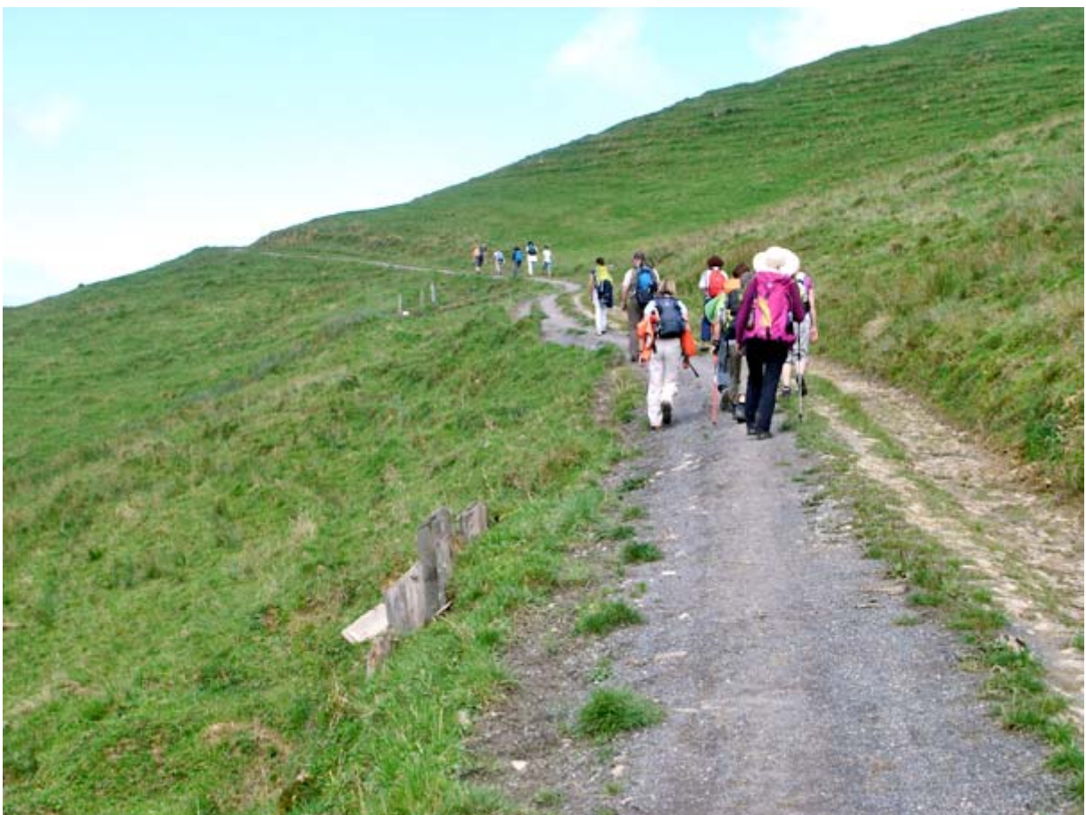
Über die Samstageren erreichen wir die Hundwileren, unsere letzte Steigung auf dieser Tour