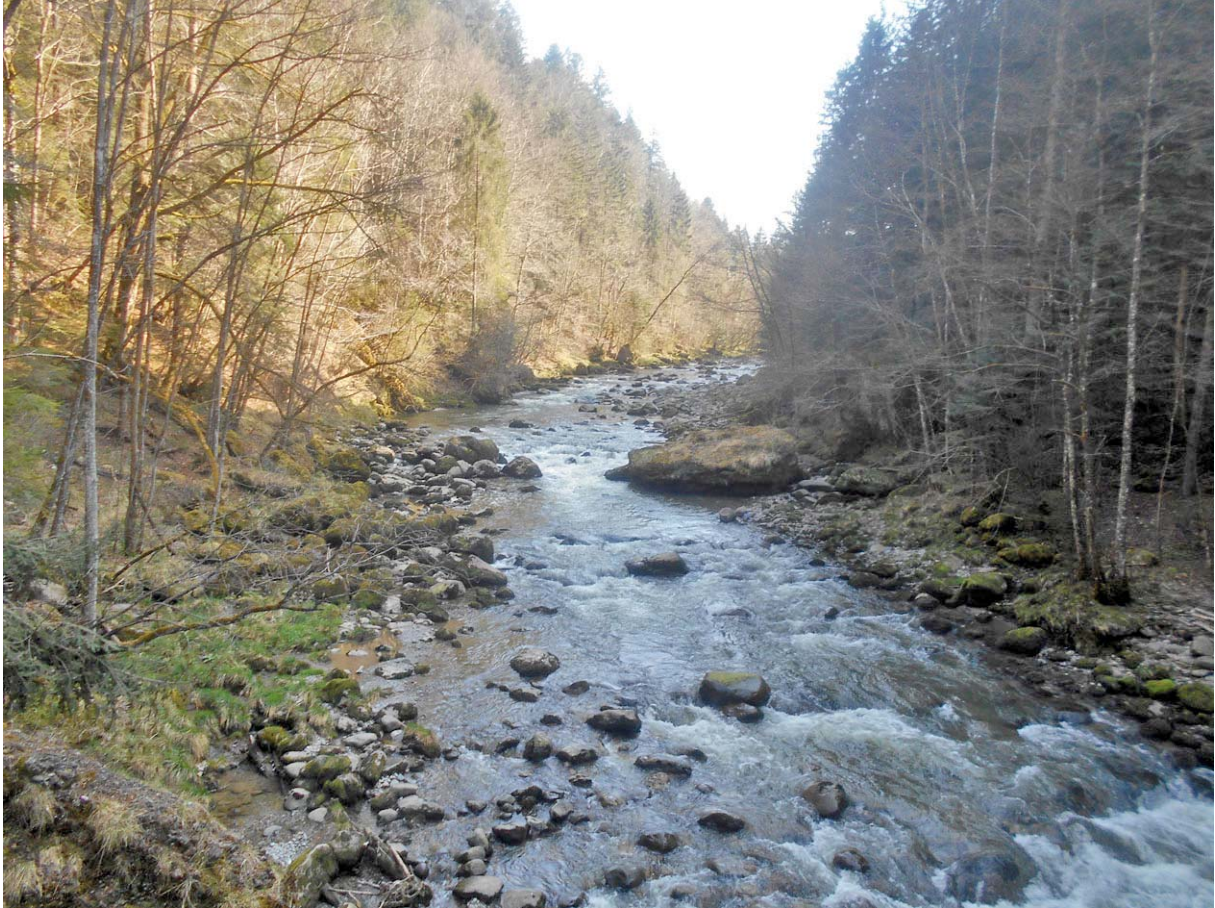
Blick vom Steg oberhalb des Sihlsprungs

Die Sihl ist in dieser Region weitgehend Natur-belassen: