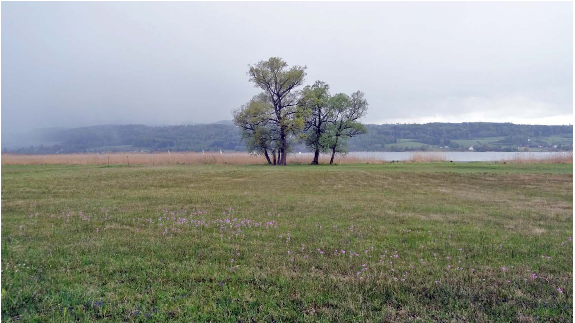
....wunderschöne Bäume im Moorgelände am rechten Ufer oder...