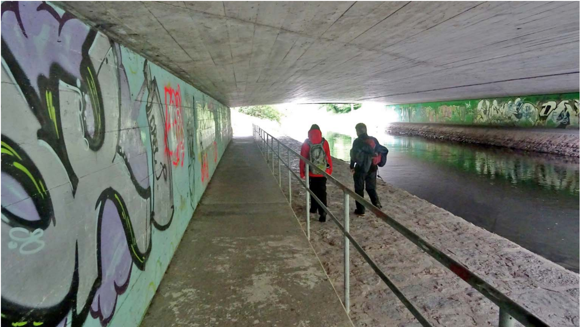
Die Unterquerung von einer der vielen Brücken

Auf dem Wegstück von Opfikon erleben wir die Autobahn-Dichte am östlichen Stadtrand von unten: