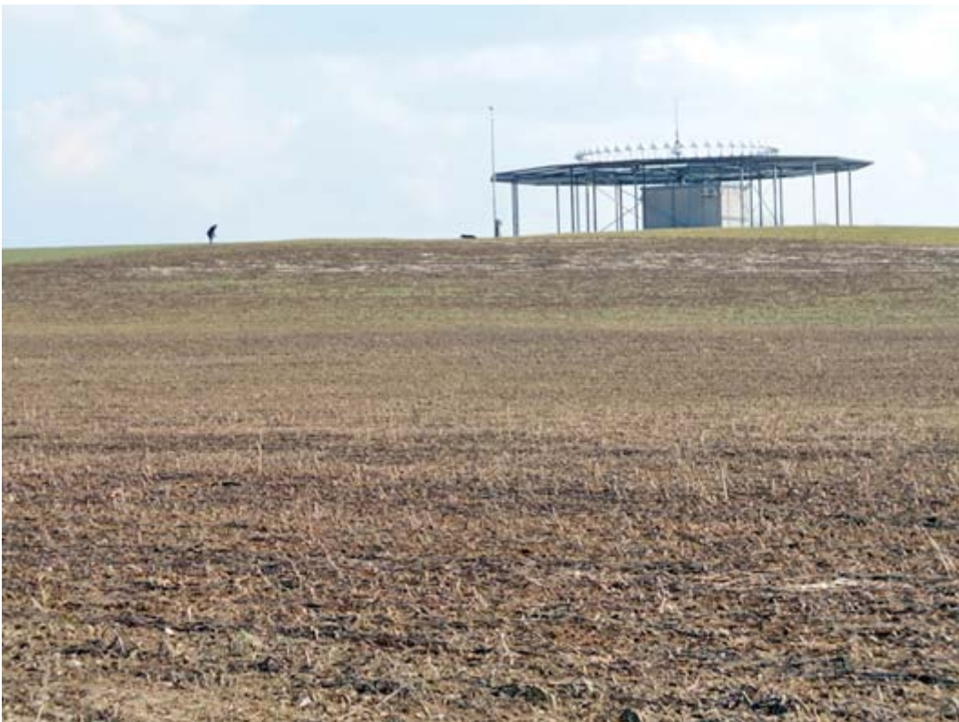
Funkfeuer-Station (für den Flughafen Kloten) auf dem Hallauer Berg