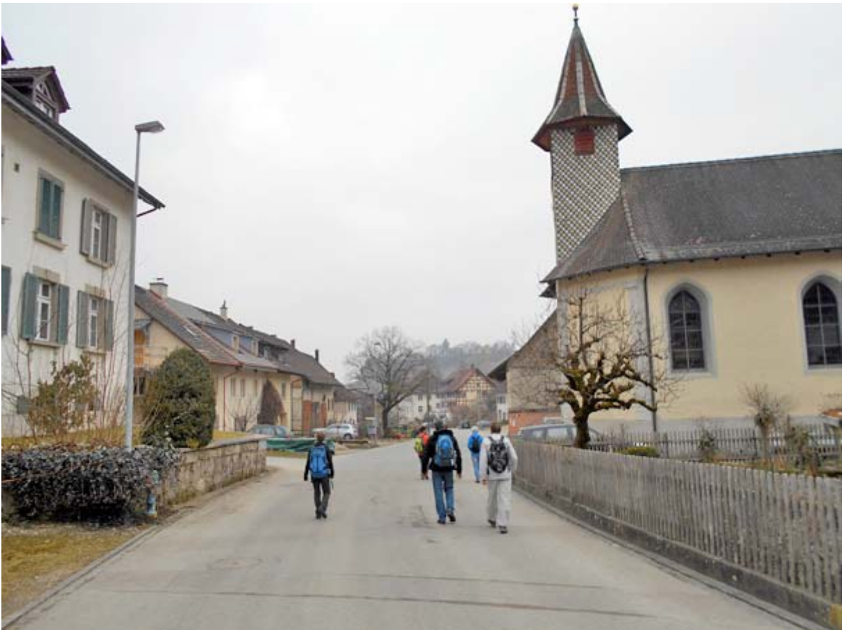
Durchquerung von Osterfingen