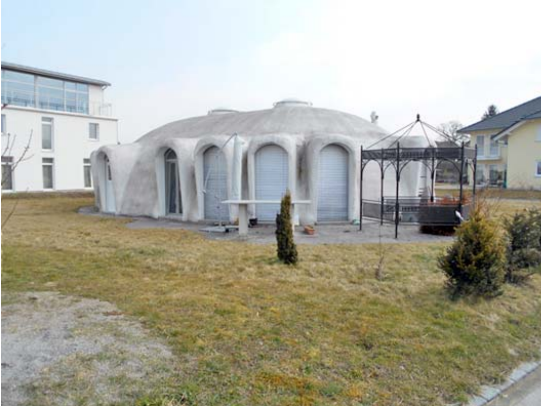
Futuristisches Haus-Design im Zentrum von Trasadingen