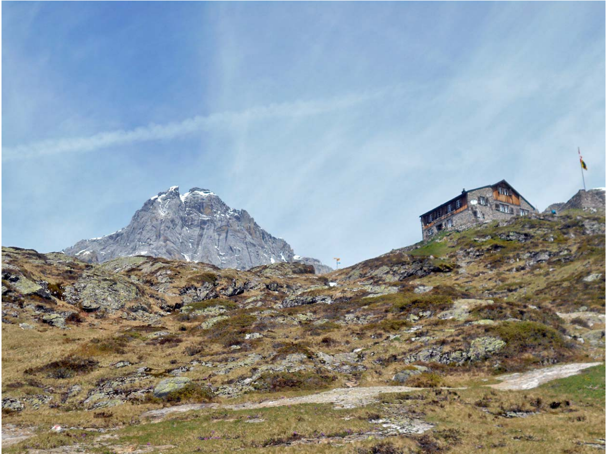
Die an prächtiger Aussichtslage auf dem Ortliboden liegende Windgällenhütte