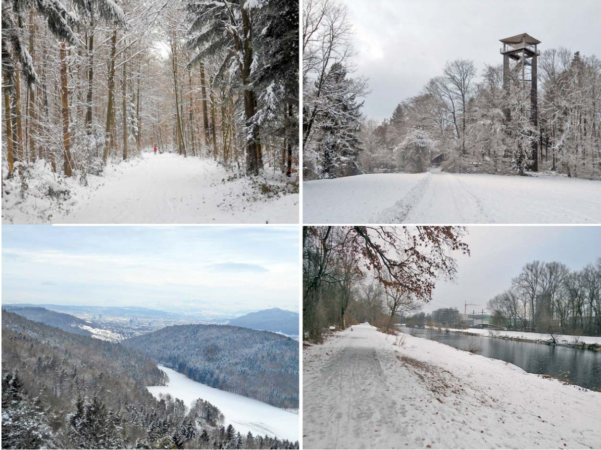
Schneeschuh-Tour Grünwald – Gubrist – Altberg – Geroldswil - Dietikon