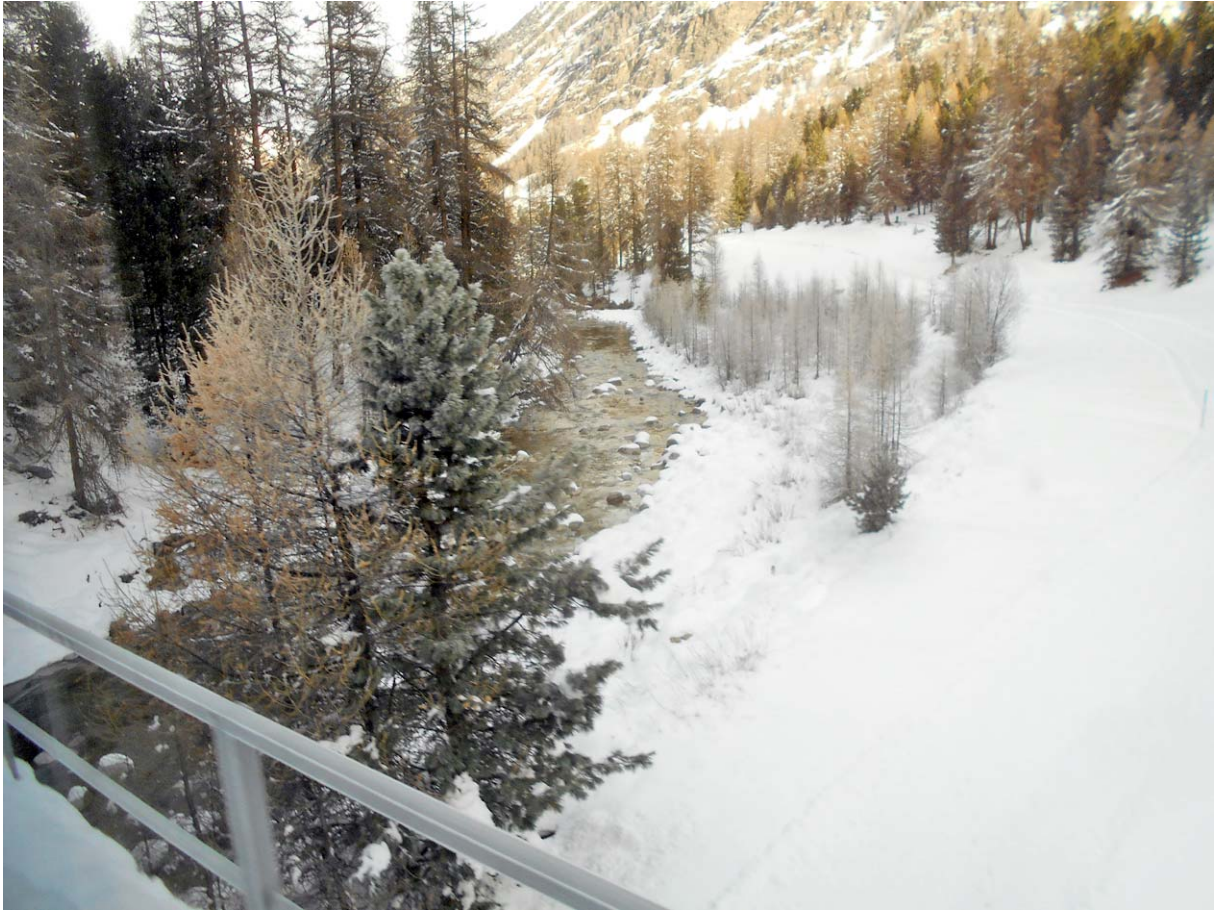
Blick auf die Ova Roseg eingangs des Rosegtals

Wie eingangs erwähnt nutze ich das Wegstück von Pontresina nach Surovas als „Warm up“: