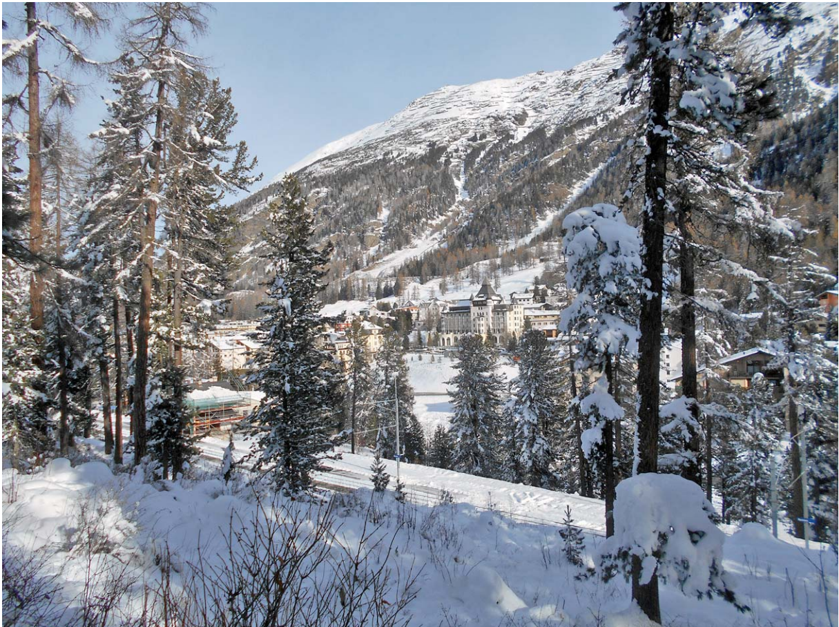
Durchblick auf die andere Talseite; in der Bildmitte oben (vermutlich?) die Segantini-Hütte

Von Surovas geht es auf einem welligen Parcours aufwärts in Richtung Morteratsch: