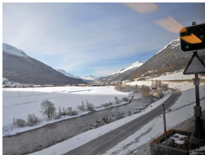
Blick auf das Oberengadin auf der Höhe von S-Charf

Auf der Anreise aus dem fahrenden Zug aufgenommen: