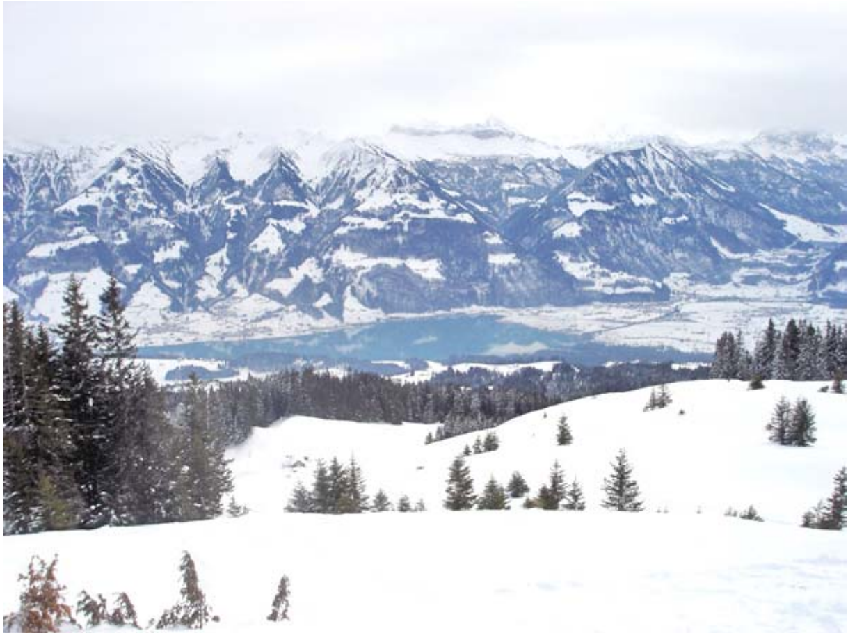
Hier der Sarner See mit der Ebene um Giswil; der Titlis etc. sind bereits eingehüllt

Oben auf dem Jänzi ist die Aussicht durch die prognostizierten Schneewolken bereits etwas getrübt: