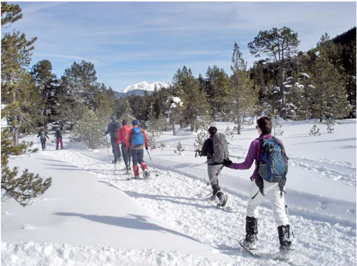
In der Bildmitte „güxelt“ erstmals der Pilatus hervor

Kurz nach 11:00 Uhr starten wir unsere Tour: