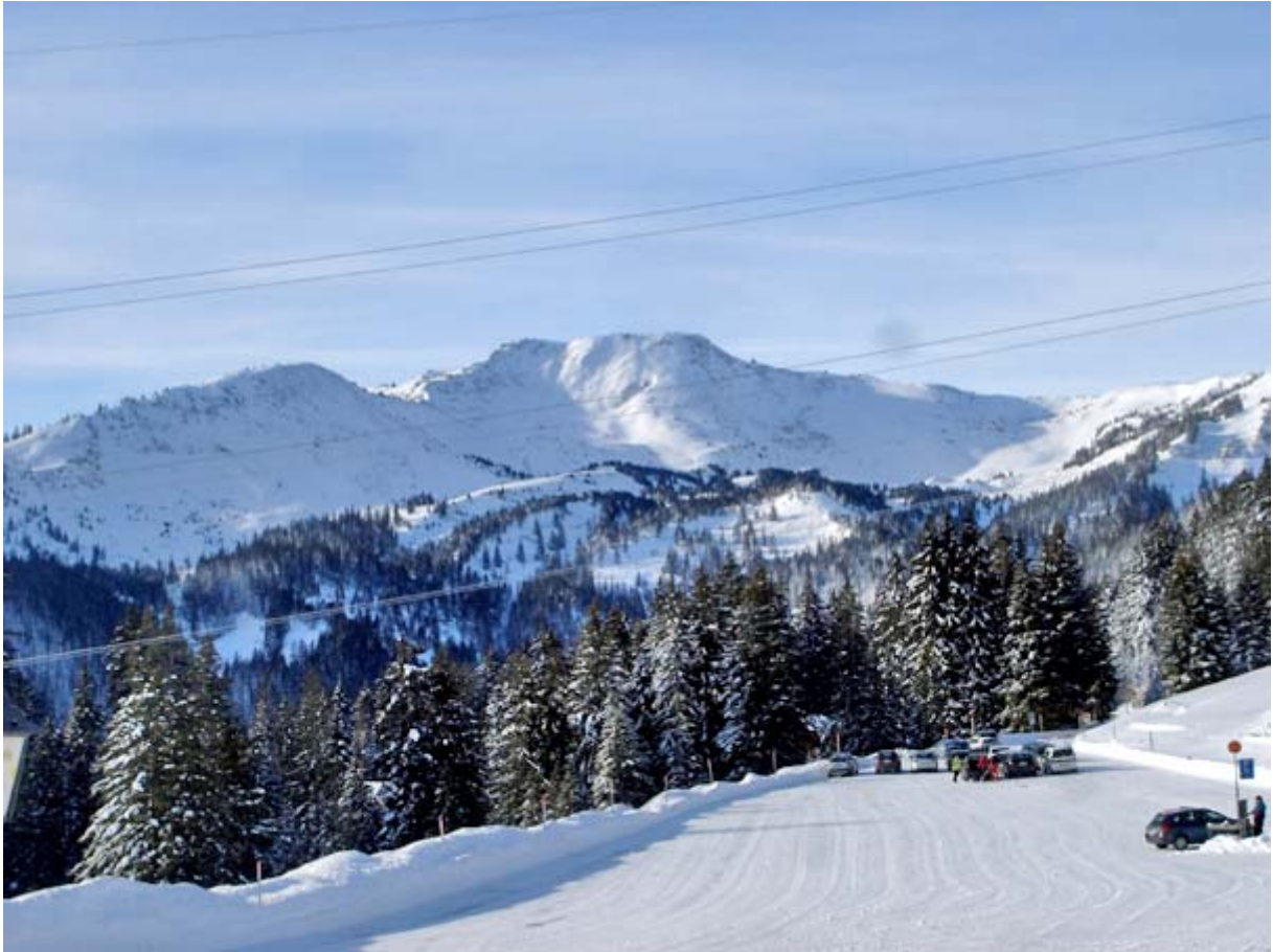
Blick in Richtung Miesenstock und Nollen

Kurz nach 11:00 Uhr starten wir unsere Tour: