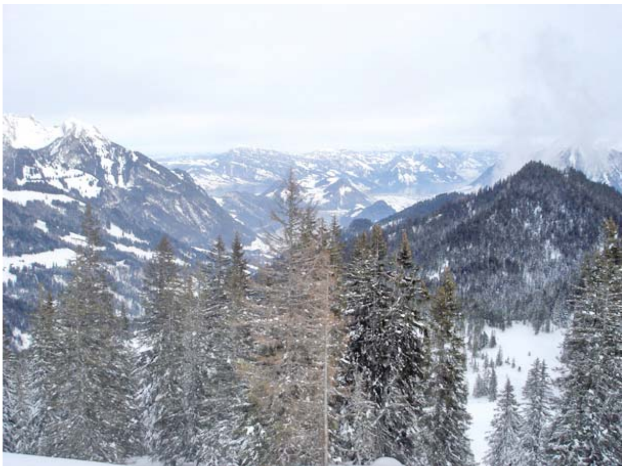
Blick in Richtung Innerschweizer Berge, links aussen der Pilatus