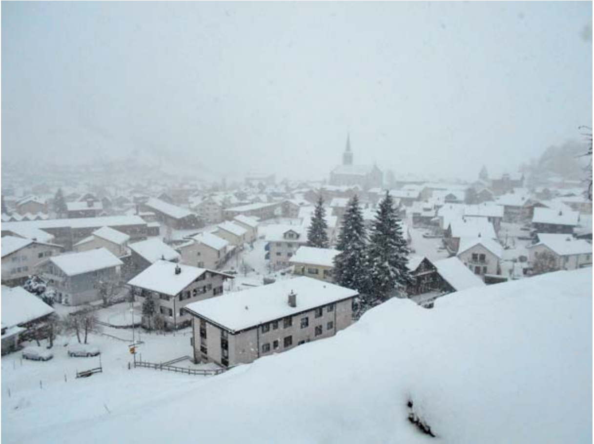
Rothenthurm im Winterkleid

Im Aufstieg ein Blick zurück auf unseren Startort: