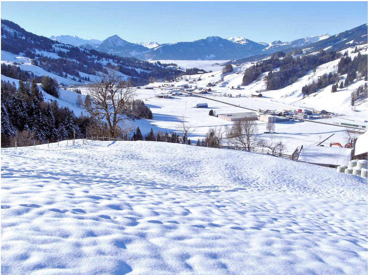
Blick in Richtung Rigi-Massiv, darunter die Nebelsuppe über Sattel

Mit jedem erstiegenen Höhenmeter wird das Panorama grandioser: