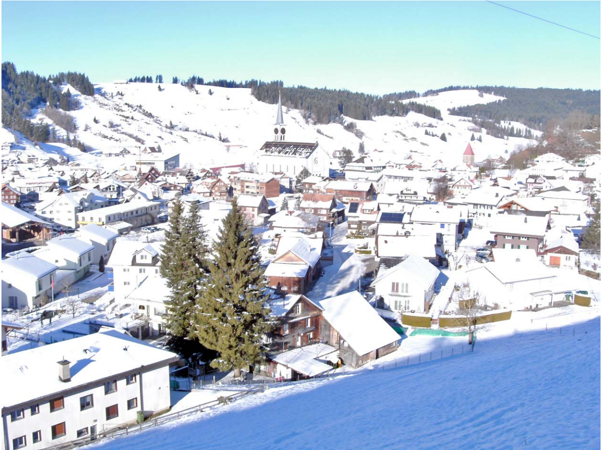
Blick zurück auf den Startort Rothenthurm

Um 10:30 Uhr starte ich am östlichen Dorfrand den Aufstieg zur Ruchegg: